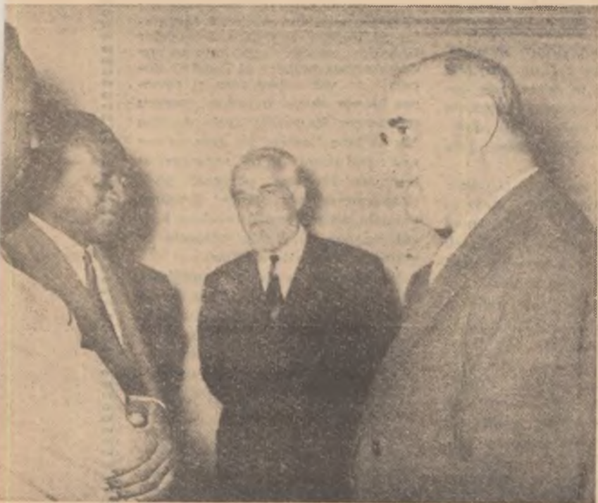
Gheorghe Gheorghiu-Dej și Ștefan Voitec întreprîndu-se cu Doudou Diouf, ministrul Afacerilor Externe al Senegalului și Albert Balima, director al cabinetului politic din Ministerul Afacerilor Externe al Voltei Superioare

Sîntem un grup de membri de rînd ai sindicatelor din New York grupate în Consiliul luptei pentru pace, se spune în încheierea scrisorii. Ne dăm seama cîtă importanță are pentru muncitorii americani discutarea acestor probleme la Adunarea Generală de către conducătorii statelor din lume.