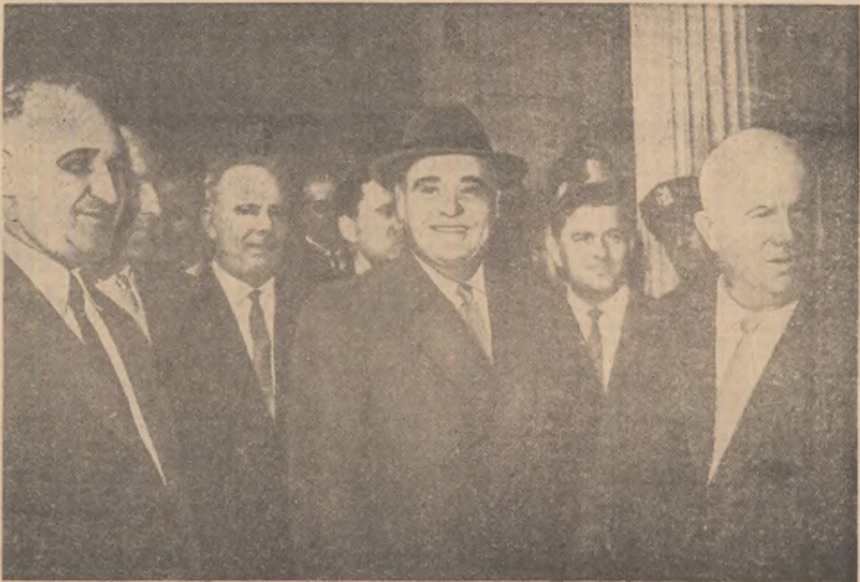
Un aspect de la sosirea invitaților la dejunul oferit de conducătorul delegației sovietice, N. S. Hrușciov în cinstea conducătorilor unor delegații la sesiunea O.N.U. În primul plan al fotografiei, de la stînga spre dreapta, tovarășii: Todor Jivkov, Gheorghe Gheorghiu-Dej, Nikita Sergheevici Hrușciov.