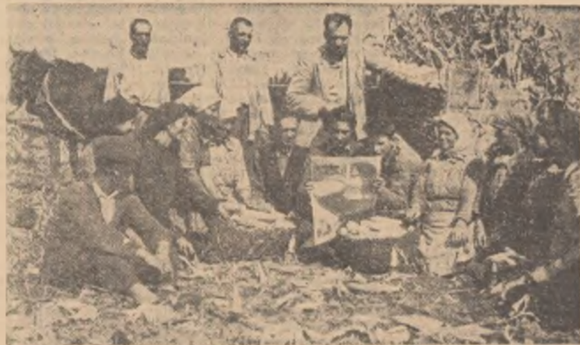
Un grup de colectiviști din satul Bucumeni, regiunea București, aflați la recoltatul porumbului, urmăresc cu o deosebită atenție știrile apărute în presă cu privire la lucrările celei de a 15-a sesiuni a O.N.U.

În ultimele zile, asemenea adunări în cadrul cărora s-au adoptat moțiuni către delegația țării noastre la O.N.U., au avut loc în nenumărate întreprinderi și instituții, precum și în comune ca Simihaiu de Cimpie, raionul Beclean, Gurba, raionul Ineu, Filipeștii de Pădure, raionul Cîmpina și altele, în gospodăriile agricole de stat, institute de cercetări agricole și centre mecanice.