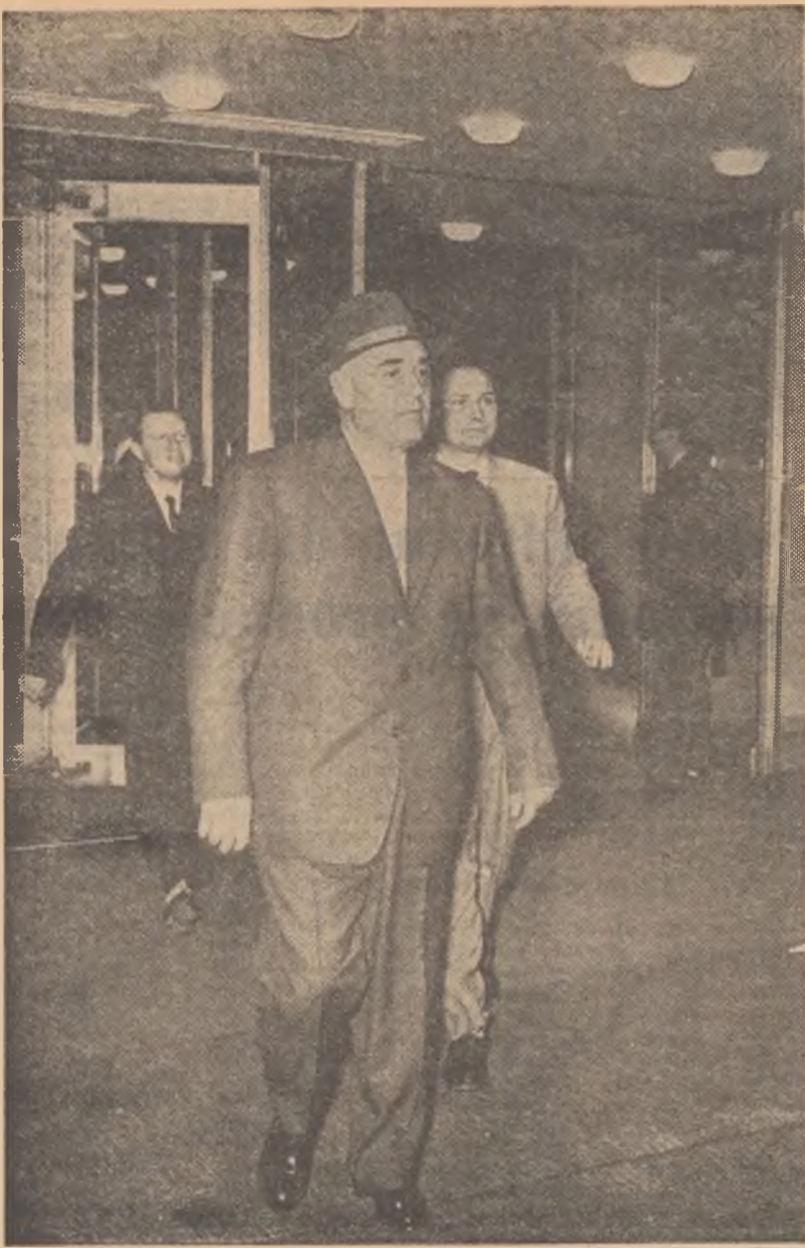
Tovarășul Gh. Gheorghiu-Dej, întrind în sediul Organizației Națiunilor Unite