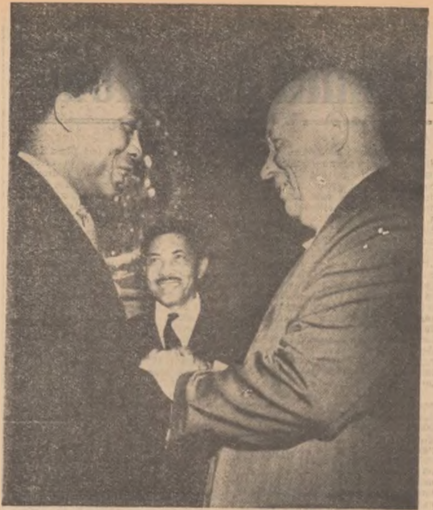
N. S. Hrușciov, președintele Consiliului de Miniștri al U.R.S.S. și Kwame Nkrumah, președintele Republicii Ghana, stînd de vorbă în clădirea reprezentantului permanent al U.R.S.S. de la O.N.U. din New York

Deosebit de semnificative în această direcție sînt răspunsurile date scrisorii din 20 septembrie, semnată de președintele Ghanei, primul ministru al Indiei, președintele Indoneziei, președintele R.A.U. și președintele Iugoslaviei, în care se recomandă ca guvernele U.R.S.S. și S.U.A. să reia contactele întrerupte în ultimul timp. În timp ce președintele S.U.A. Eisenhower, s-a grăbit să refuze net și categoric, N. S. Hrușciov a arătat în scrisoarea sa de răspuns: „După convingerea profundă a guvernului sovietic, actuala stare a relațiilor dintre U.R.S.S. și S.U.A., care s-au înrăutățit, poate fi lichidată. Pentru aceasta este însă necesar să se recunoască în mod clar care a fost cauza înrăutățirii acestor relații, să se recunoască în mod clar că această înrăutățire a fost provocată de acțiunile perfide fără precedent ale guvernului S.U.A., care a mers pe calea înfăptuirii acțiunilor agresive provocatoare împotriva Uniunii Sovietice. Cu alte cuvinte, sîntem gata să luăm contact și să ducem tratative cu președintele și cu guvernul Statelor Unite ale Americii, scontînd că guvernul S.U.A. va găsi curajul pentru a condamna aceste acțiuni care au provocat înrăutățirea relațiilor sovieto-americane și că va manifesta bunăvoință în ce privește îmbunătățirea în practică a acestor relații”.