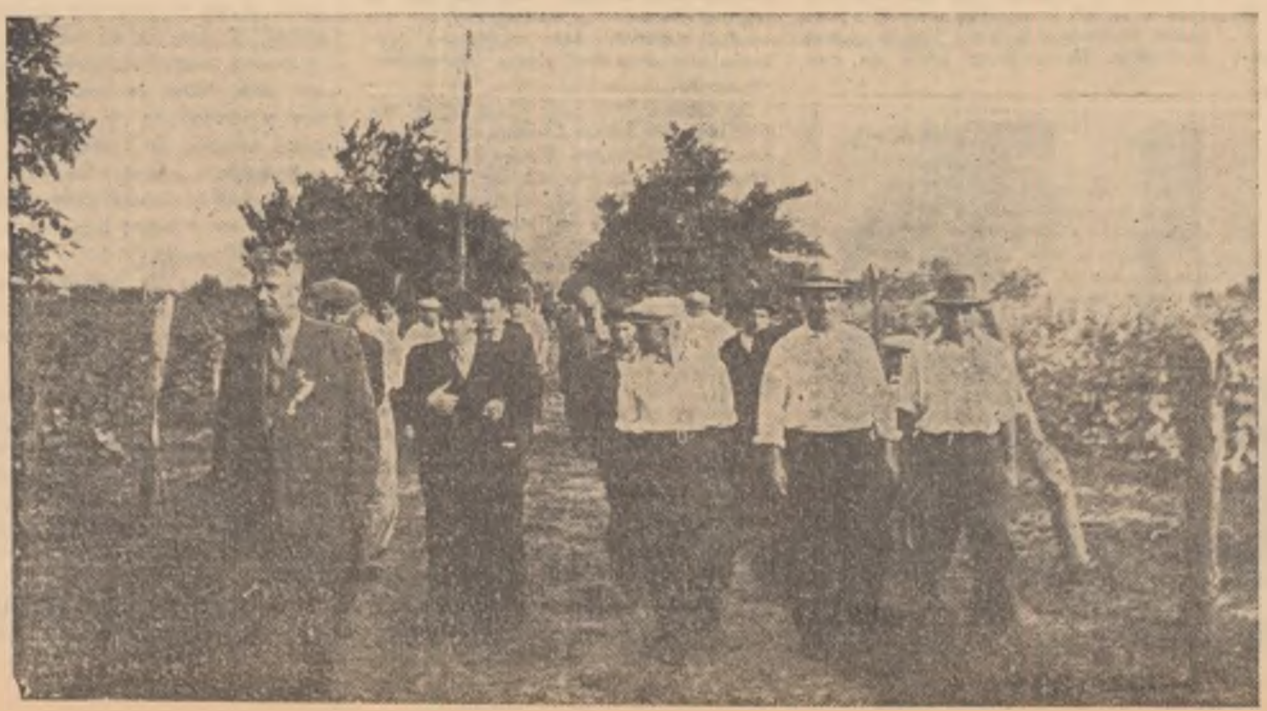
Vizita delegației agricole sovietice la g.a.c. „Viața Nouă” din comuna Baba Ana, regiunea Ploiești.