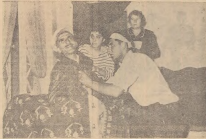
În întreaga țară se desfășoară faza regională a celui de-al II-lea Festival biennial de teatru „I. L. Caragiale”. În fotografie: scenă din piesa „Și pe strada noastră” de Horia Lovinescu, în interpretarea echipei de teatru a Casei de cultură din Cernavodă.

După cum am văzut, în regiunea Pitești organizarea muncii majorității brigăzilor se face în bune condiții. Asta nu este însă îndeajuns. Ce folos că o brigadă științifică se duce azi într-o comună și tocmai peste trei luni în alta? Una din trăsăturile de bază ale brigăzilor științifice este de a face deplasări periodice, regulate, reușind în felul acesta să cuprindă un număr cât mai mare de sate. În această privință regiunea Pitești nu se prezintă de loc la