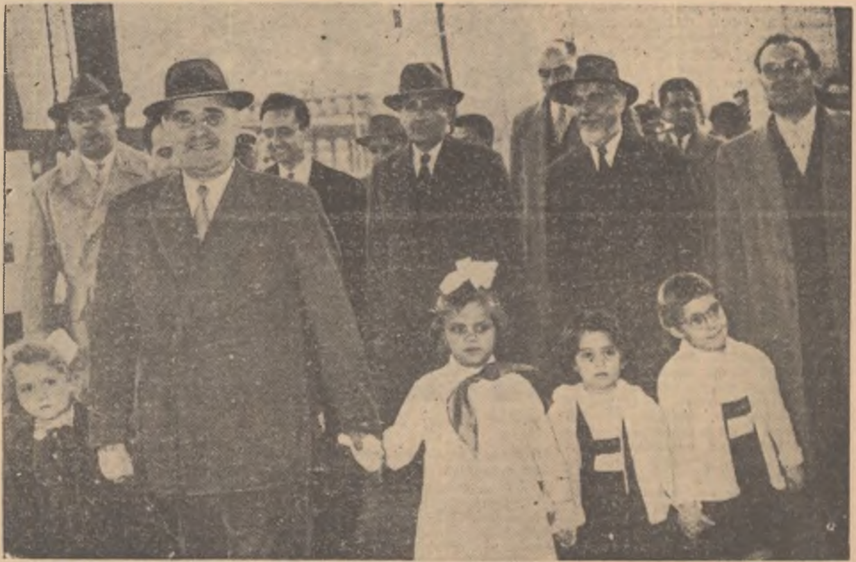
Tovarășii Gheorghe Gheorghiu-Dej, Leonte Răutu și Ștefan Voitec la sosirea în capitala Franței.

Tovarășii Gheorghe Gheorghiu-Dej, Leonte Răutu și Ștefan Voitec și-au continuat în aceeași zi călătoria cu trenul spre Paris, unde au sosit după-amiază.