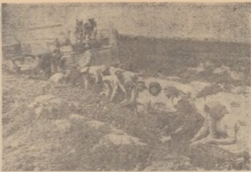
Pină la începutul lunii octombrie, colectivisti din comuna Făcăeni, raionul Fetesti, au livrat Agevacoopului peste 4.600 kg gogoșari. În fotografie: se pregătește un nou transport.