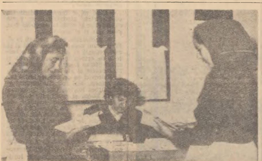
Înzestrată cu peste 5.000 de volume, biblioteca căminului cultural din comuna Tirnova, raionul Ineu, atrage zilnic numeroși iubitori ai cărții beletristice și agrotehnice

Săpături arheologice de dată recentă și de proporții tot mai mari au scos la iveală importante urme ale unui trecut ce începe încă din epoca pietrei necioplite. Nenumărate piese de mu-