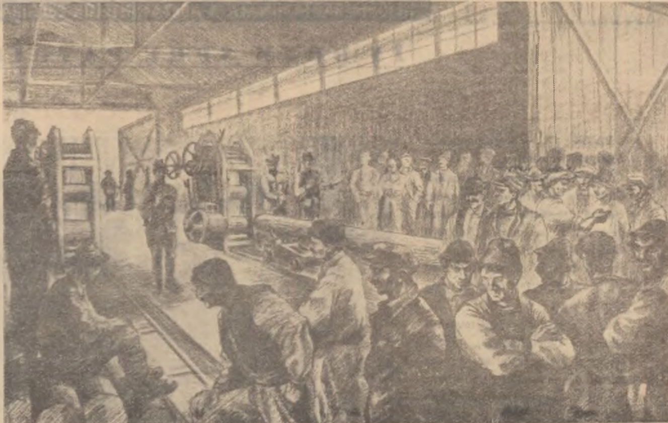
Aspect al grevei din octombrie 1920 în industria lemnului de pe valea Nemeșului.

Cu scopul de a stăvili grevele, în august 1920 guvernul a prezentat parlamentului scelerata lege Trancu-lăși, ceea ce a dat naștere la o și mai mare dezlănțuire a luptei greviste. În București 30.000 de muncitori au demonstrat timp de două ore pe străzile Capitalei împotriva crimei legii Trancu-lăși. Greve generale puternice s-au desfășurat la Ploiești, Iași, Constanța, Turnu Severin, Banat și Transilvania. Totodată muncitorii protestau contra intervenției antisovietice, pentru pace și prietenie cu U.R.S.S. Guvernul a răspuns prin intensificarea măsurilor teroriste. La Arsenalul armatei din București s-a tras în muncitori; au fost omorîți și răniți mai mulți dintre ei. S-au făcut numeroase arestări. Cu toate acestea, însă, în luna septembrie grevele generale au continuat. În total, după date oficiale, între 1 martie și 20 octombrie 1920 au avut loc în toată țara 345 de greve generale pe ramuri, orașe, regiuni etc., din care 112 în București. În timpul acestor bătălii de clasă s-a întărit lupta ideologică și politică dusă de grupurile comuniste împotriva reformismului și a crescut procesul de clarificare ideologică în mișcarea muncitorească. A crescut tot mai mult influența grupurilor comuniste care cereau trans-