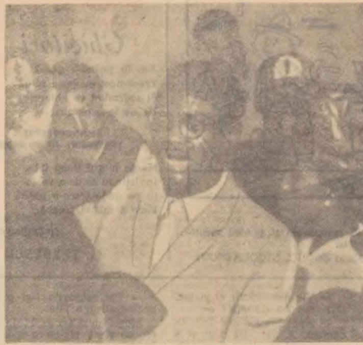
Premierul congolez Patrice Lumumba, în momentul cînd iese din locuința sa

Proiectul de rezoluție al celor 28 de țări din Asia, Africa, Europa și America Latină prezentat de K. Menon a fost adoptat în unanimitate.