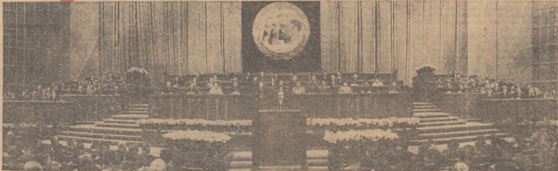
In sala Congresului

Miercuri dimineața s-a deschis în sala Palatului R. P. Romine cel de-al IV-lea Congres al Sindicatelor din Republica Populară Română.