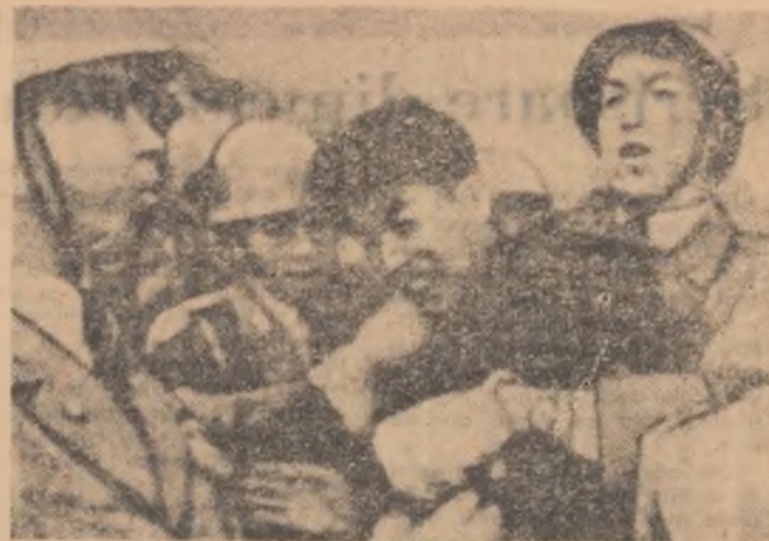
Poliția din Tokio reprimă cu brutalitate pe participanții la demonstrațiile de protest împotriva asasinării lui Asanuma.

În ciuda tuturor manevrelor, a furiei care l-a apucat, Mobutu nu poate salva regimul său de la faliment. Guvernul legal al lui Lumumba se bucură de sprijinul majorității în parlament și a poporului care este hotărît să dea o lecție usturătoare colonialiștilor și să apere independența și integritatea teritorială a tinerii Republicii Congo.