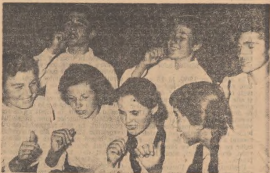
Un sprijin în întărirea gospodăriei colective „Dunărea” din Ostrov, regiunea Constanța, l-a dat și brigada artistică de agitație a căminului cultural. Iată-i pe membrii acestei formații, prezentînd un program la stația de radioficare din comună