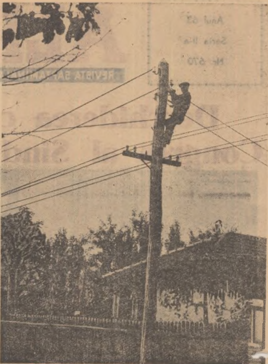
În comuna Sălcuţa, raionul Titu lucrările de electrificare sînt în plină desfăşurare. Pînă la începutul acestei luni s-au tras peste 5 km reţea electrică.

Realizările măreţe în dezvoltarea bazei energetice a ţării şi în special în realizarea planului de electrificare, n-ar fi fost posibile fără sprijinul amplu şi dezinteresat acordat de Uniunea Sovietică în utilaj, specialişti, documentaţie tehnică,