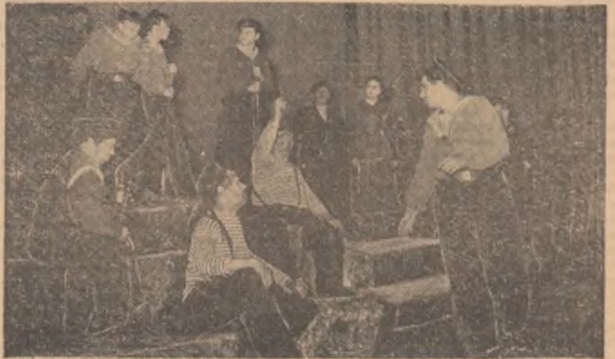
Scenă din spectacolul „Tragedia optimistă" de V. Vișnevschi, prezentat în Capitală în cadrul Lunii prieteniei romino-sovietice, în interpretarea colectivului Teatrului Academic de Dramă „A. S. Pușkin" din Leningrad.

Cules din com. Glimbocata, reg. Pitești de G. BREAZU