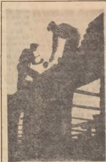
Construirea unui nou grajd cu o capacitate de 120 vite la gospodăria colectivă „Unirea” din comuna Mănășia, raionul Urziceni