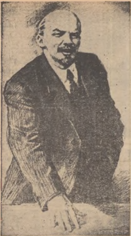
V. I. LENIN (Desen de P. Vasiliev)

fără precedent. Imaginei de vasl șantier de construcție, rod al înfăptuirii politicii partidului de industrializare socialistă a țării și a alături imaginea satelor și a agriculturii în plin proces de transformare socialistă, imaginea vaselor ogoare colectivistice, unde munca se deslășoară spornic, ca niciodată în trecut, pe baza unei tot mai largi mecanizări.