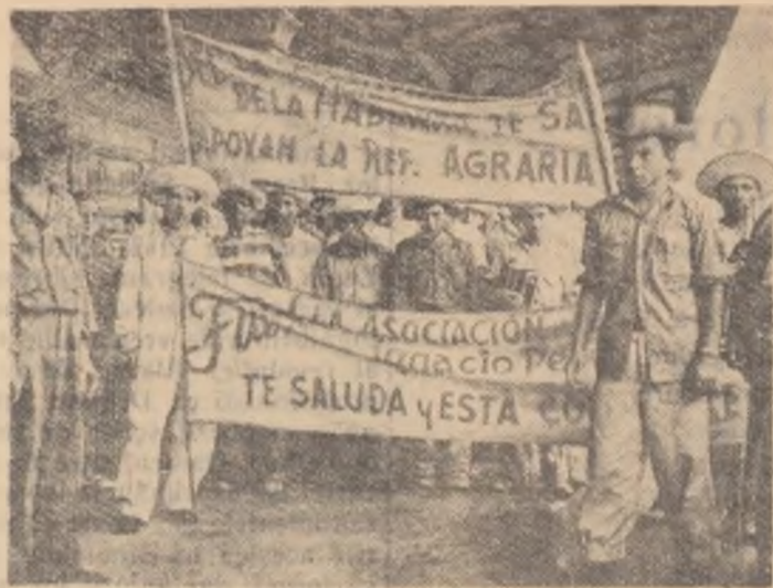
Muncitorii agricoli din Cuba, care au cunoscut apăsarea jugului exploatații monopoliste, salută și sprijină cu entuziasm înfăptuirea reformei agrare promulgată de actualul guvern.

Luînd cuvîntul în ședința Comitetului Politic Special reprezentantul U.R.S.S., A. A. Soldatov, a subliniat că este necesar nu numai să se lărgescă reprezentarea noilor state în organele principale corespunzător cu schimbarea numerică a componenței Organizației Națiunilor Unite, dar și să se revizuiască după cum o reclamă schimbările calitative din lume întreaga structură a O.N.U., astfel încît ea să corespundă actualei repartiții a forțelor pe arena internațională.