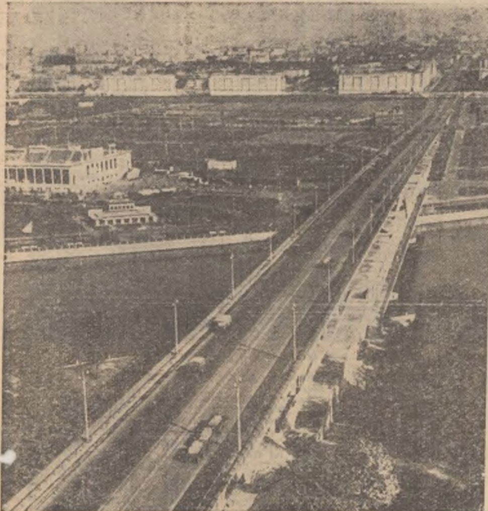
Moscova. Podul peste metro văzut de pe Colinele lui Lenin