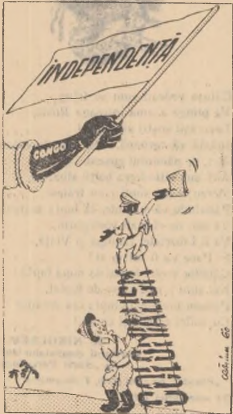
MOBUTU: — Nu ajung, domnule... Scara asta e prea scurtă.

Oricît s-ar strădui colonialiștii și interpuștii lor de a împiedica lupta dreaptă a poporului congolez pentru libertate și independență, el nu poate împiedica sfîrșitul victorios al acestei lupte.