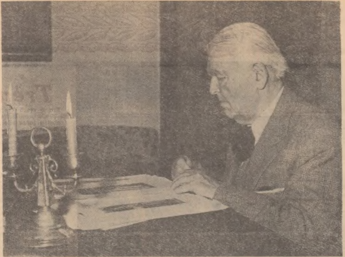
Intr-una din camerele casei sale de la Neamț. (septembrie 1960).