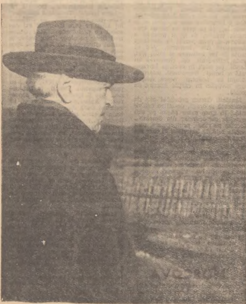
Maestrul scrutînd, ca-ntotdeauna, plaiurile țării dragi.