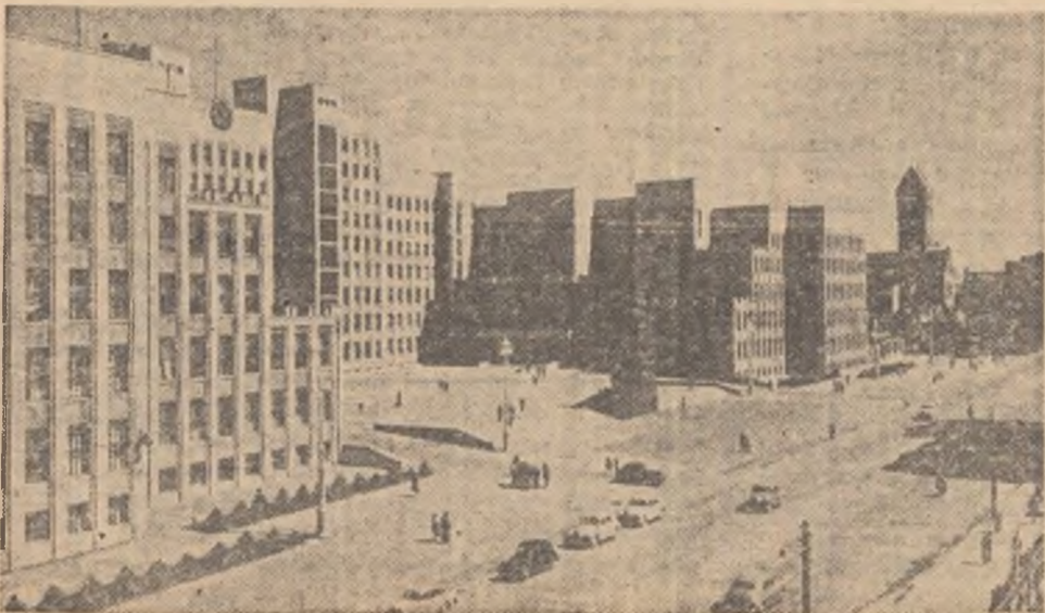
Clădirea guvernului R.S.S. Bielorusă din orașul Minsk