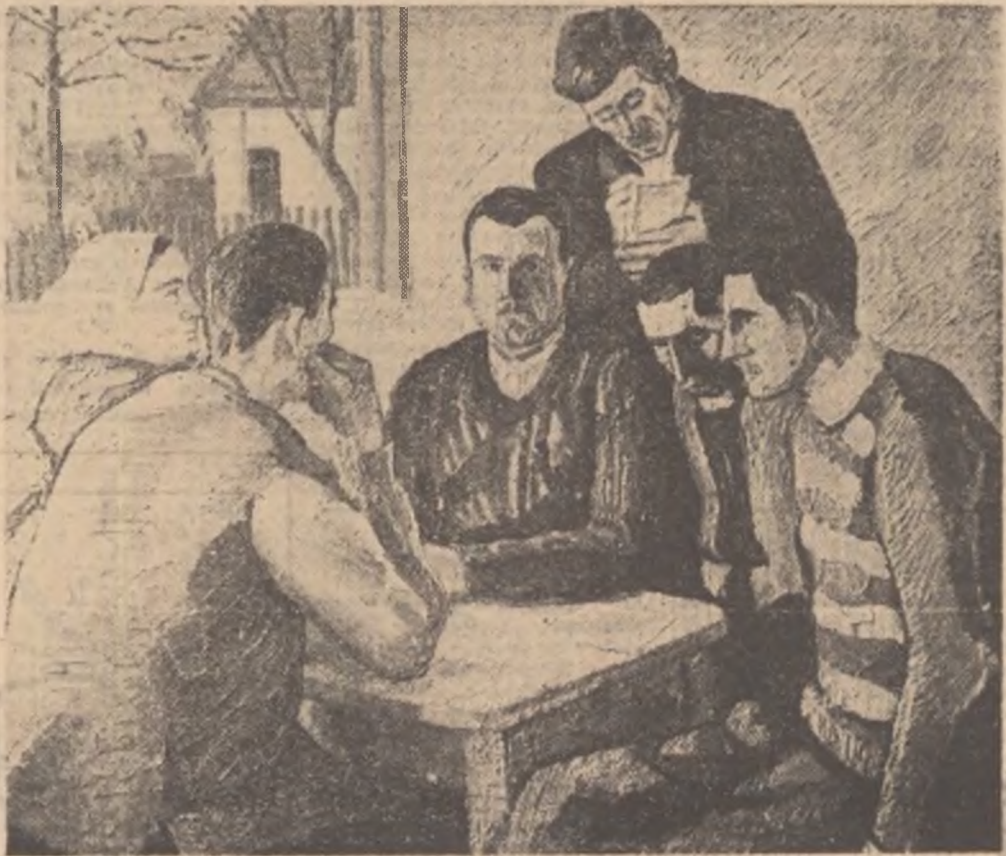
„Colectiviști întocmind planul de muncă”