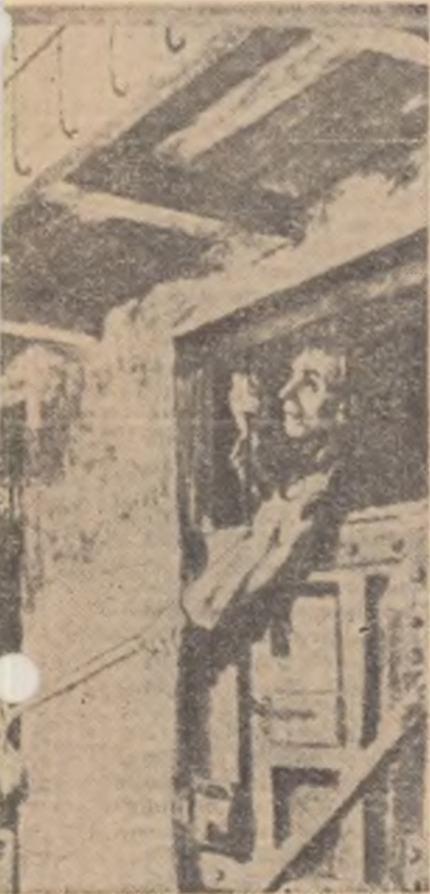
ul și Intortocheril coridorului, „deț- niști reuseau cu ajutorul „măgăreței” ismită materiale și alimente. reața”, (pictură de A. ANASTASIU).

Un coloz de granit, împrejmuit cu zid gros și înalt de cîteva staturi de om, și cu turnuri de pază. Opt sec- ții de celule, legate de corpul cen- tral printr-o clădi- re în formă de potcoavă. Celulele întunecoase și în- bușitoare, cu par- doseală de ciment și tavanul de tablă ondulată, menți- neau totdeauna o umezeală rece care pătrundea pînă-n oase. Instalația de încălzire era nu- mai un element de decor. Nu func- ționa aproape nici- odată. Gerurile iernii puteau fi înregistrate înăun- tru cu aceleași grade sub zero ca și afară, sub cerul liber. Zdrenguții, aproape goi, bătuți pînă la schilodire, hrăniți cu turtol de tărîțe și o sa- ramură infectă (scoasă dintr-o baltă sărată unde se-mbăiau boierii, vara), în care plu- teau cîteva frunze de buruienii sau două, trei boabe de fasole (nefier- te și acelea pen- tru că direcția in- chisorii „economi- sea” lemnele) — deținuții îndurau pe deasupra aceas- te teroare a frigu-