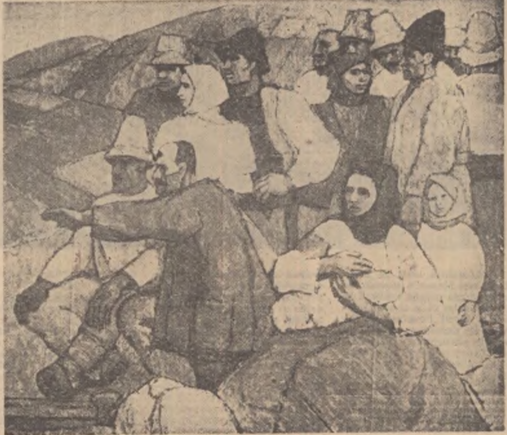
„Toate pămînturile laolaltă” (o colectivă la moși).

Anul 63 • Seria II • Nr. 872 • Miercuri 9 noiembrie 1960 • 8 pagini — 15 bani