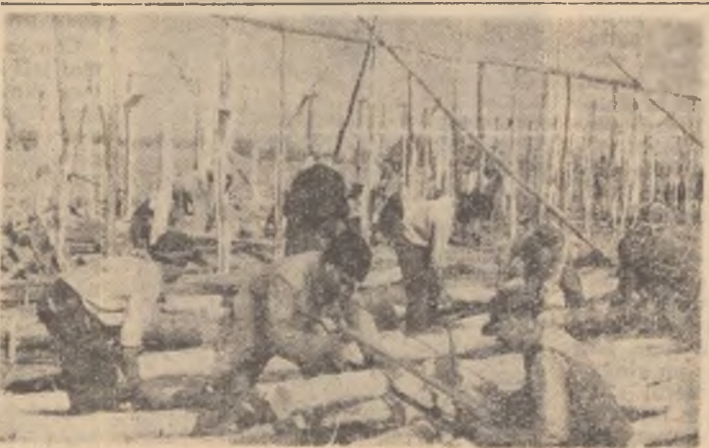
La gospodăria colectivă din Adunații Copăceni, raionul Vidra, au început lucrările la cel de-al doilea grajd cu o capacitate de 100 vite.