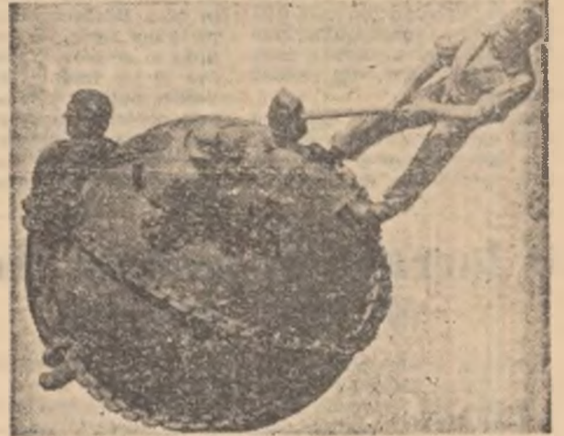
Sculptură în lemn executată la Doftana în anul 1932, reprezentînd ruperea lanțului imperialist de către pro- letariatul rus pe a șasea parte a globului pămîntesc.