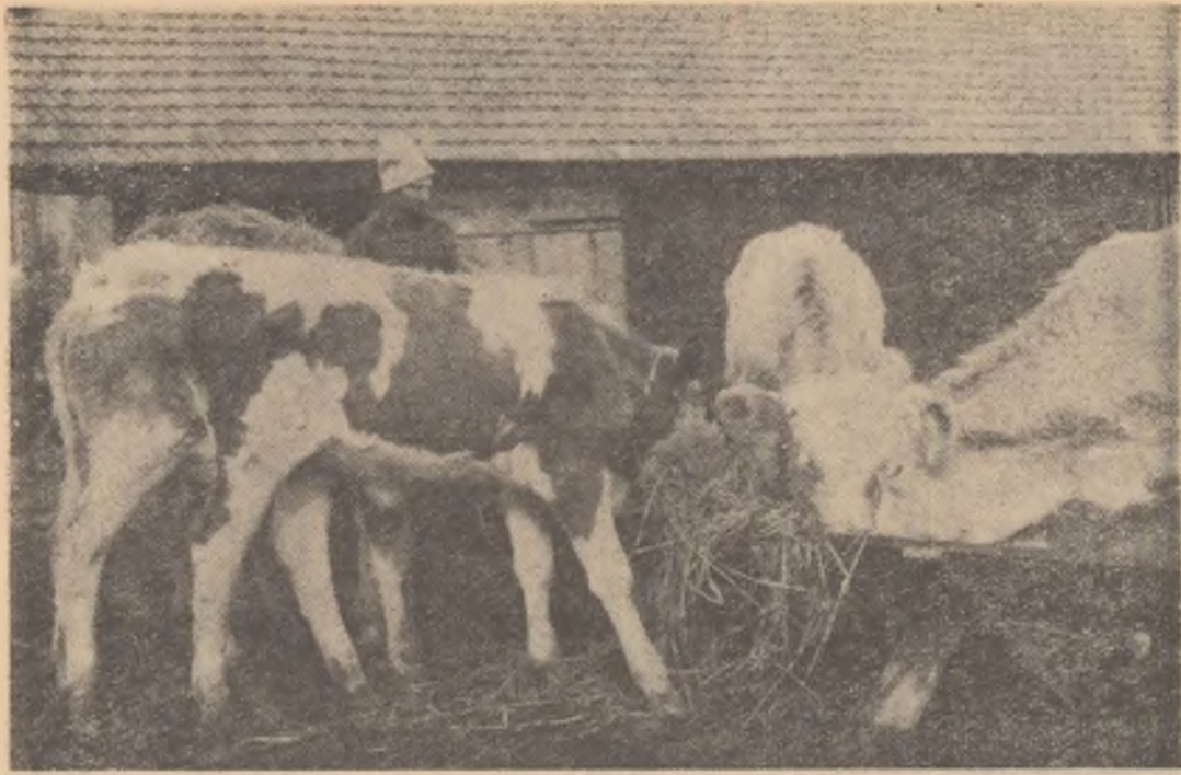
O parte a iotului de vișel al gospodăriei colective din Nădab, regiunea Oradea.