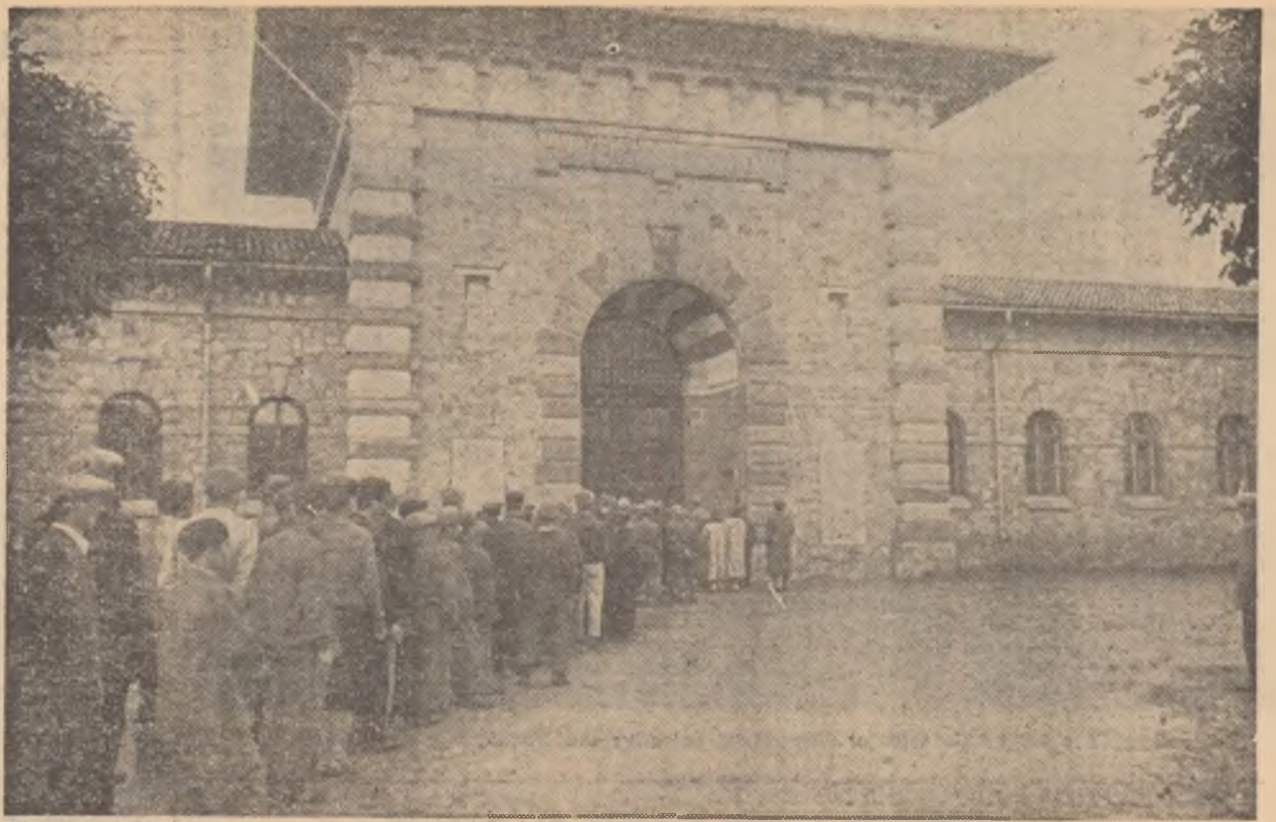
Zi de vizită la muzeul Doftana.

Gîndul însuflețitor, idealul sfînt pentru care s-au avîntat în luptă cei mai buni fii ai poporului muncitor, s-a dovedit de neînfînt. Toate res- presiunile și schingiuirile născocite de zbirii inchisorii, toate provocă- rile ticăloase, regimul de extermi-