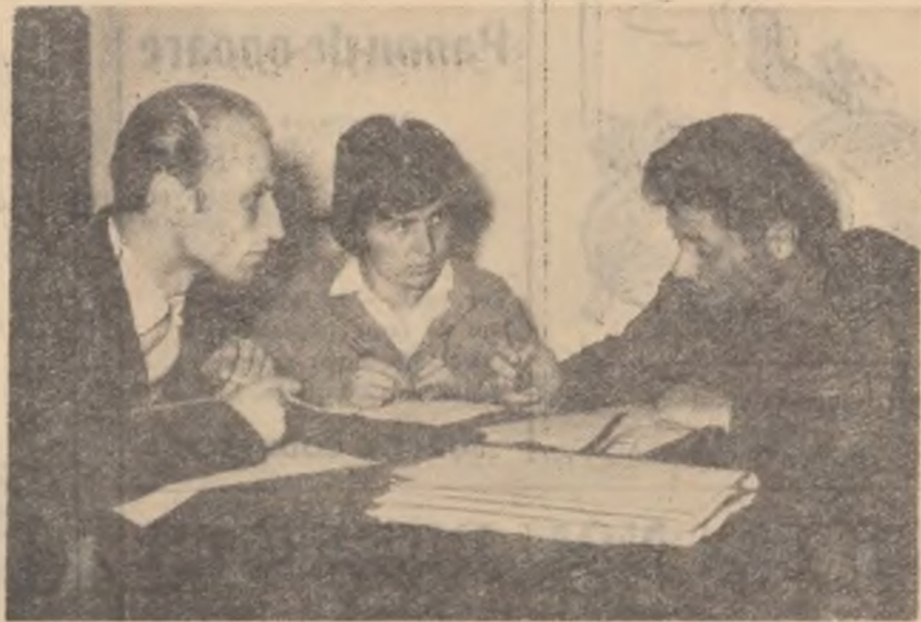
„De la lume adunate și-n Comana arătate”, așa se intitulează programul brigăzii artistice de agitație a căminului cultural Comana, raionul Vidra, la care colectivul de creație aduce ultimele îmbunătățiri.