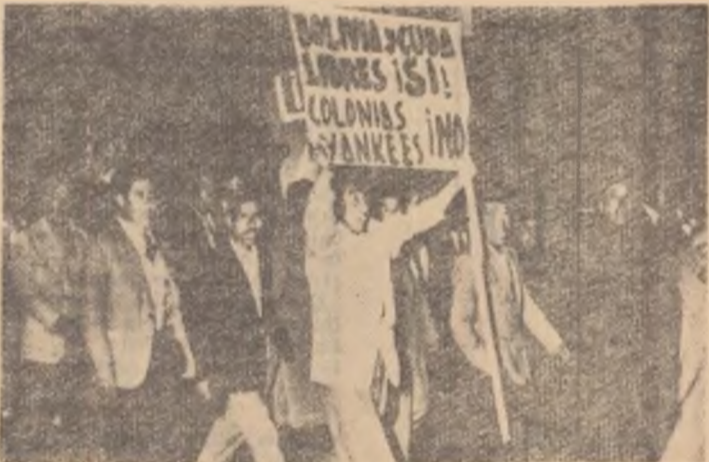
Lupta dreaptă a poporului cuban pentru libertate și independență este sprijinită și de popoarele din America Latină. În Venezuela, Bolivia, Peru și în alte țări din această parte a globului au loc puternice manifestații de solidaritate cu lupta poporului cuban. În fotografie: Manifestanții din La Paz, capitala Boliviei, purtînd pancarte pe care scrie: „Vrem ca Bolivia și Cuba să fie libere, nu colonii americane!”