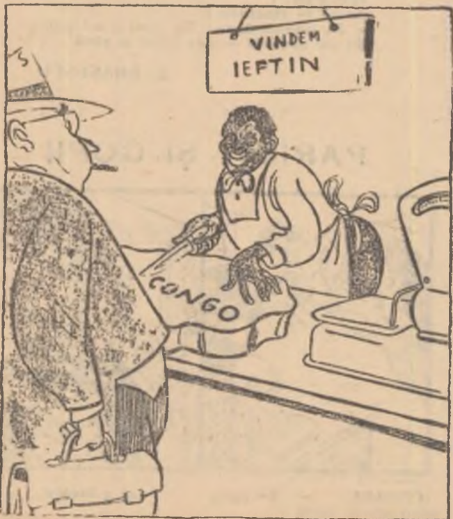
Kasavubu: — De unde să vă tai? Monopolistul: — Nu! o iau pe toată...

Exprimîndu-și speranța că în timpul cînd Kennedy va fi președinte al S.U.A., relațiile dintre Uniunea Sovietică și Statele Unite ale Americii vor intra pe făgașul lui Roosevelt, tovarășul N. S. Hrușciov scrie în telegrama de felicitare trimisă lui Kennedy: „Sîntem convinși că nu există obstacole care să nu poată fi înlăturate din calea spre menținerea și consolidarea păcii. Pentru atingerea acestui țel sîntem gata, în ceea ce ne privește, să continuăm eforturile pentru rezolvarea unei probleme atât de actuale ca dezarmarea, prin rezolvarea dezbaterii germane pe baza încheierii cît mai grabnice a unui tratat de pace și pentru realizarea unui acord în alte probleme, a căror rezolvare ar duce la destinderea și însănătoșirea întregii situații internaționale”.