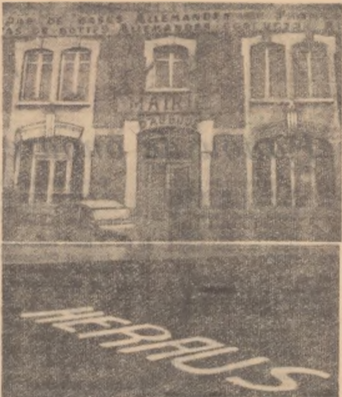
„Nici o bază germană în Franța”, „Nici o cizmă germană pe solul nostru”. Aceste lozinci sînt înscrise pe frontispiciul primăriei din localitatea Auboué, care a interzis intrarea trupelor vest-germane pe teritoriul ei. HERAUS! (AFARĂ!) este inscripția care se poate citi pe caldarîmul străzilor din localitățile franceze prin care au trecut sau unde au fost dislocate unități vest-germane.

Comentînd evenimentele din Vietnamul de Sud, numeroase ziare străine subliniază că, în pofida insuccesului răscoalei, aceasta a demonstrat subrezistența regimului ngodinhdiemist. Așa de pildă, ziarul englez „Sunday Times” relevă că răscoala din 11 noiembrie constituie „cea mai gravă criză” din întreaga perioadă de cînd în Vietnamul de Sud se află la putere Ngo Dinh Diem. Acest dictator, subliniază ziarul, „este izolat de popor și de opinia publică”.