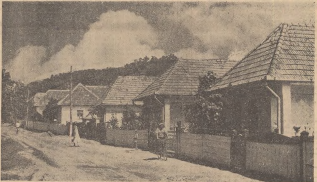
Datorită veniturilor mari realizate în gospodăria colectivă, în ultimii ani 130 de colectivști din Curteni, Regiunea Autonomă Maghiară, și-au construit case noi. În fotografie: un grup de case construite de curînd.