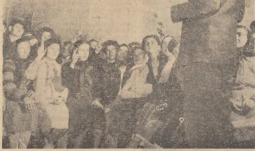
La căminul cultural din comuna Broscari, raionul Vinju Mare, seriile de întrebări și răspunsuri, organizate în cadrul „Joi tineretului”, se bucură de o vie și numeroasă participare