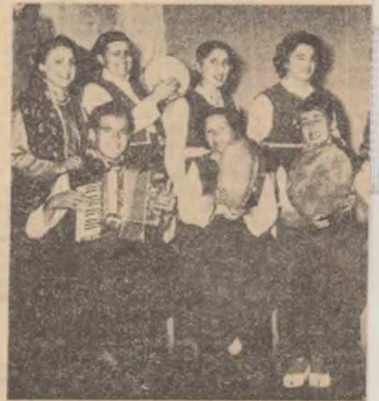
Cine va fi lăudat? Cine va fi criticat? E o activitate artistică de agitație a căminului cultural. Într-o seară, face repetiții cu noi.

În paginile de față publicăm câteva articole scrise de unii participanți la consfătuire.