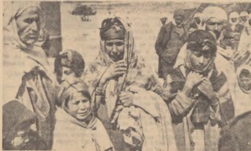
Satele lor au fost arse de colonialiștii francezi. Acești țărani algerieni sînt minajați acum ca vitele în lagăre de concentrare. Și... cîți dintre ei mai scapă oare cu viață?...