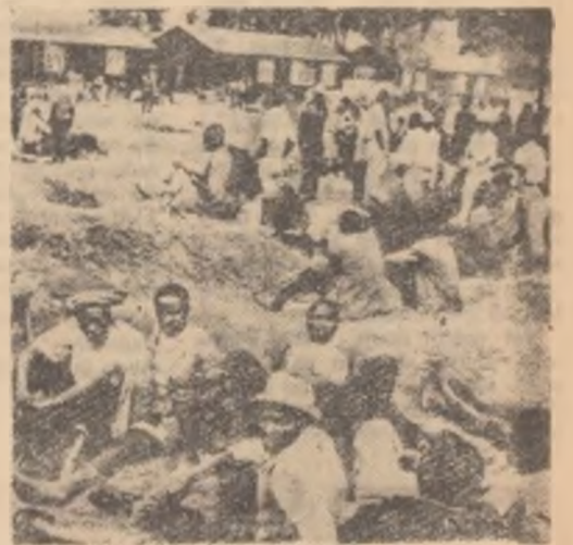
Șomeri din Kenya așteptînd zadarnic să primească ceva de lucru

Încercînd să mențină mai departe Kenya sub jugul colonial, Anglia a întreprins diverse mașinațiuni menite să dea africanilor iluzia unei oarecare autodeterminări. Realitățile din Kenya, valul terorist care continuă, discriminarea ce răpește africanilor și pe mai departe toate drepturile în propria lor țară, faptul că în Kenya mișună trupe coloniale și polițiști englezi, faptul că jaful și