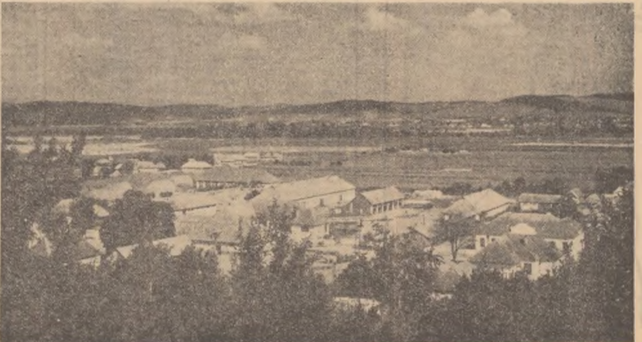
Satul Curteni este colectivizat în întregime. Gospodăria și-a dezvoltat mult sectorul zootehnic, s-au extins suprafețele cu cereale, s-au plantat pomi fructiferi, viță de vie și s-a dezvoltat mai mult grădinaritul. În fotografie: vedere generală a satului. În prim plan se află construcțiile zootehnice ale gospodăriei.