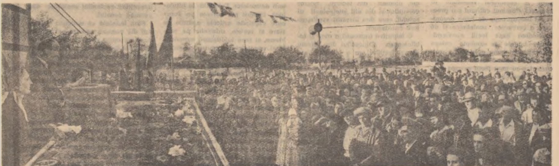
În cronica comunei Domnești, regiunea București, s-a înscris de curînd o nouă biruință: constituirea gospodăriei agricole colective.