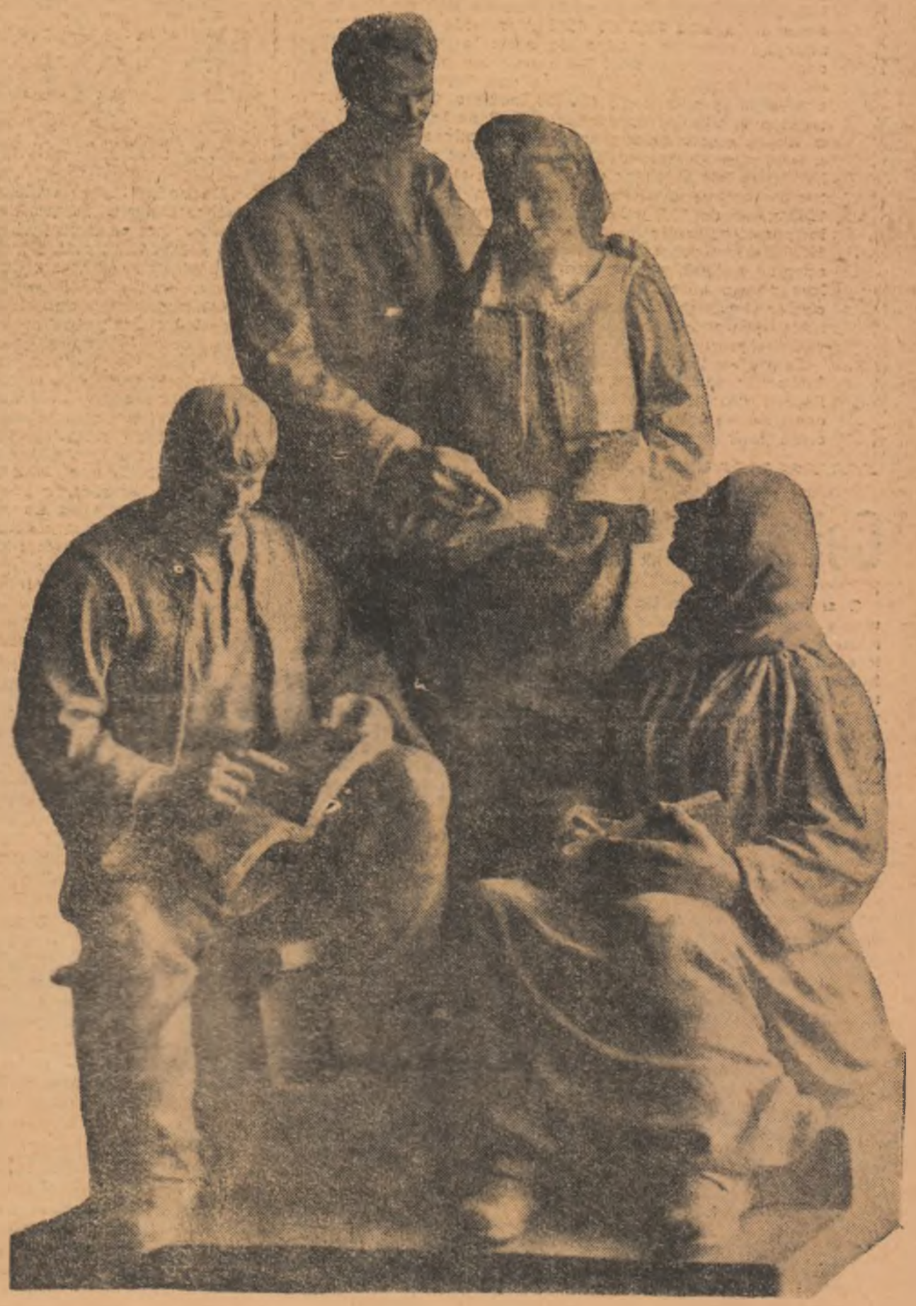
Studiind istoria partidului Sculptură de IOAN FLORICA