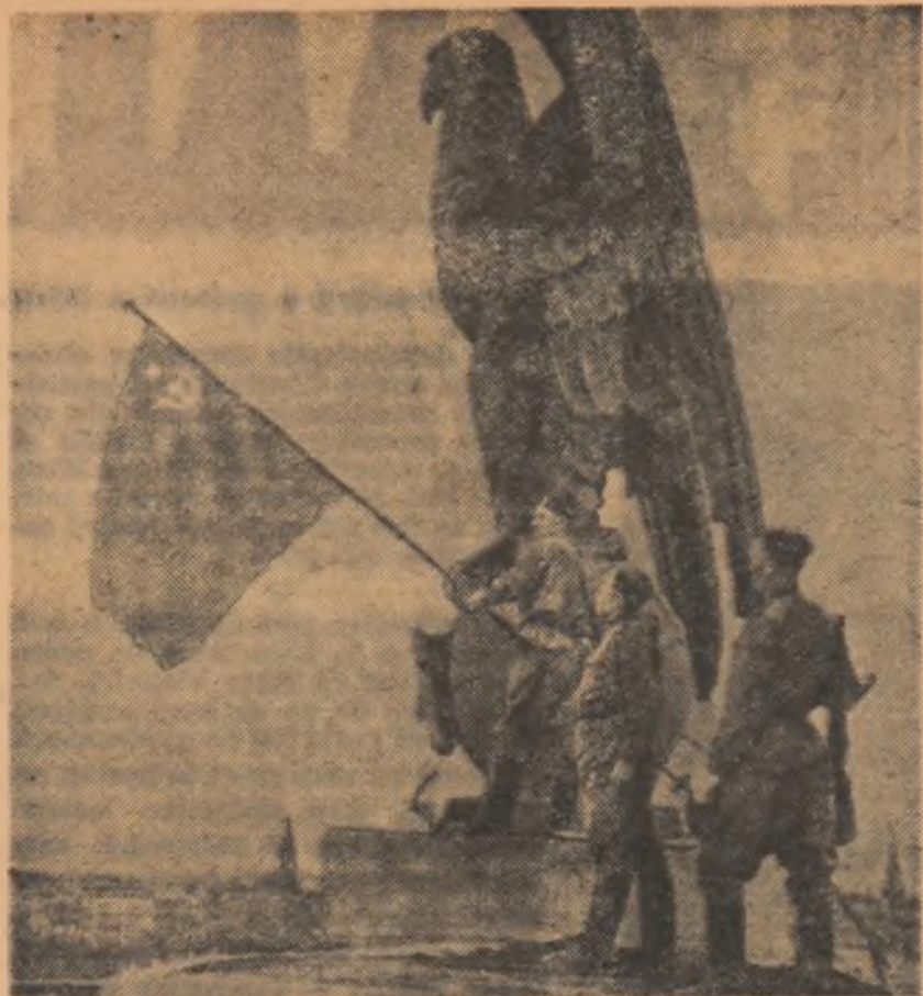
Steagul victoriei înălțat deasupra Reichstagului de către ostașii glorioasei Armate Sovietice