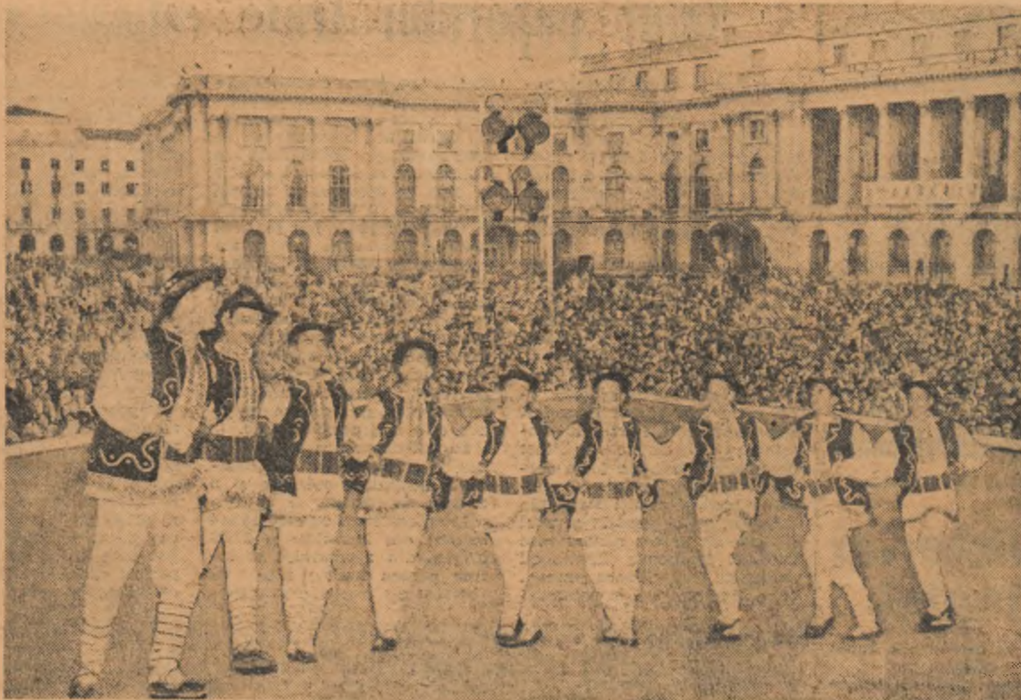
În Piața Palatului R.P.R., pînă noaptea târziu s-au perindat pe scenă formații artistice. În chișeu: O echipă de dansatori executînd o învîrtită focoasă sub privirile admirative ale numeroșilor spectatori.

1 Mai. Simpla rostire a cuvîntului stîrnește de fiecare dată în inimi negrăit de frumoase ecouri. E una din cele mai iubite sărbători prin luminosul simbol pe care-l poartă. Generațiile pămîntului îl petrec de șapte decenii, dar el nu este nicăieri atît de frumos, de încărcat de bucurie ca aici, la noi, în Moscova marea, în Pekin, Varșovia, peste tot acolo unde poporul muncitor își ține soarta în mâini.