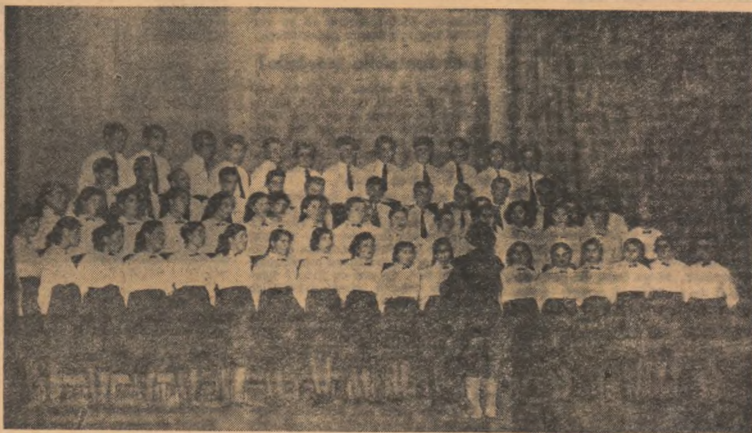
Corul căminului cultural din Ostrov interpretează cîntecul „Părinte drag, partid“ de Gh. Bazovici

Spectacolele brigăzilor artistice au impresionat prin conținutul lor bogat, inspirat din viața nouă a zilelor noastre, prin ideile și procedeele originale de regie, prin ținuta lor artistică. Ele au adus pe scenă mindria și bucuria realizărilor, aspecte majore din lupta însuflețită pentru creșterea productivității și a calității produselor, din munca depusă pentru întărirea și dezvoltarea gospodăriilor agricole colective etc. Majoritatea brigăzilor au scos în evidență marile succese dobîndite sub conducerea partidului, viața liberă și îmbelșugată în comparație cu viața plină de mizerie, de împilare din timpul regimului burghezo-moșieresc. Brigada artistică a Întreprinderii Regionale de Electricitate Dobrogea și-a început programul intitulat: „Întuneric și lumină“ cu o comparație a vieții triste din trecut, cu viața luminoasă de azi a Dobrogei. Pe scenă e întuneric. E sugerată Dobrogea veche, Dobrogea suferințelor și umilințelor din timpul regimului bur-