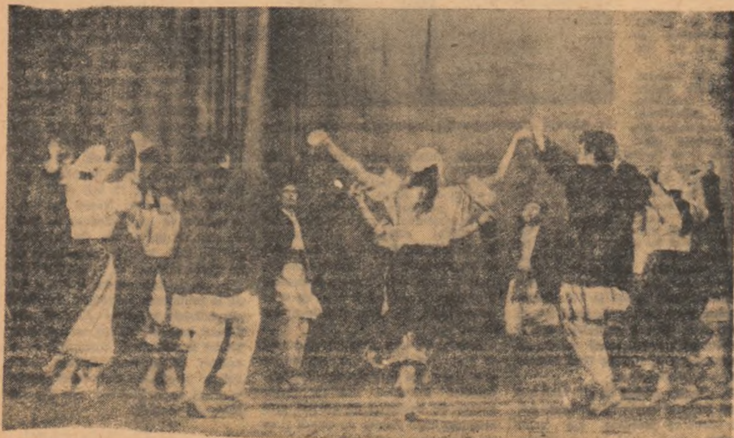
Echipa de jocuri din satul Coslugea