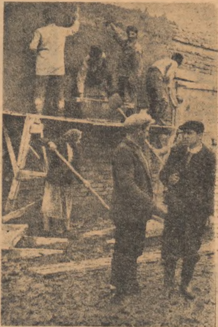
Se execută ultimele lucrări de finisaj la o nouă clădire