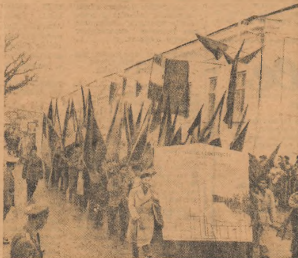
La demonstrația oamenilor muncii din Suceava

Mai viguros ca niciodată a răsunat în lumea întreagă chemarea: „Proletari din toate țările uniți-vă“.