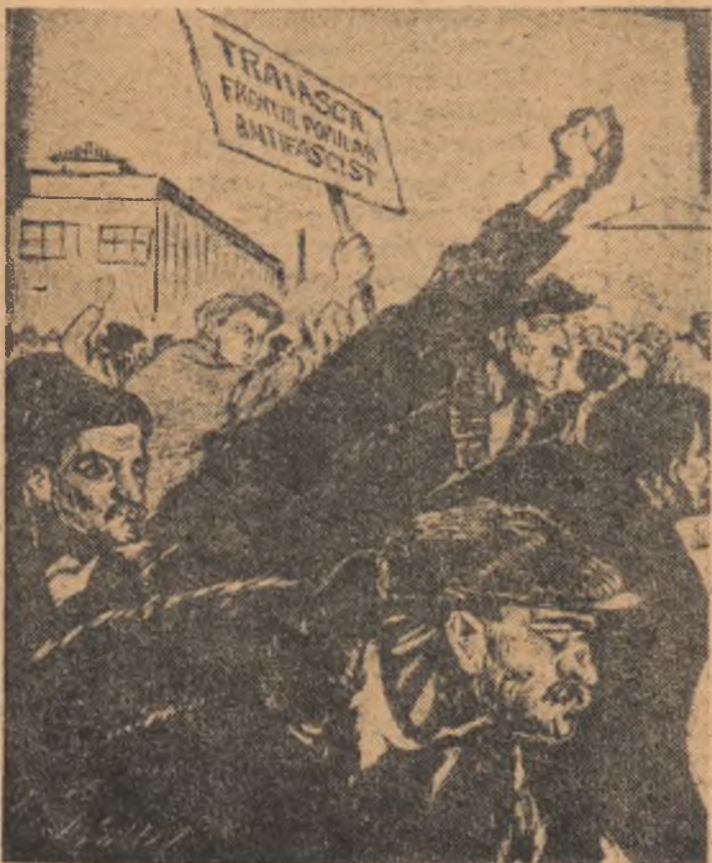
„Manifestație muncitorească antifascistă” Linogravură de M. GION

La aniversarea sa, îi închinăm toată dragostea și recunoștința noastră, întreg avîntul nostru creator.