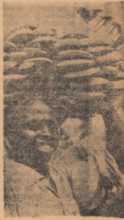
Bananele — una din principalele culturi din Guinea

Charta prevede că orice alt stat african poate intra în această Uniune.