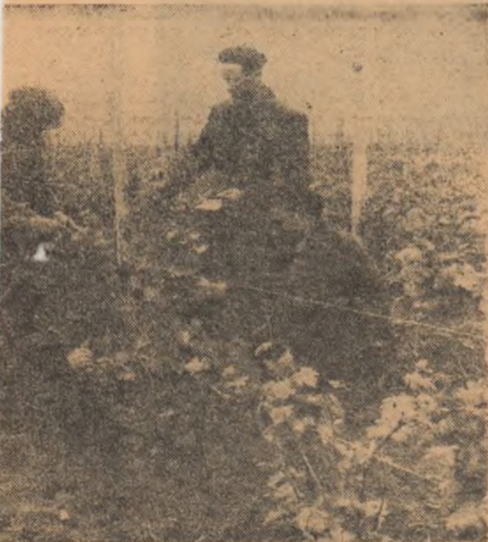
ra modului cum s-au executat lucrările la vie

beci de Palas. că vom avea ptele au dove- să ia aminte