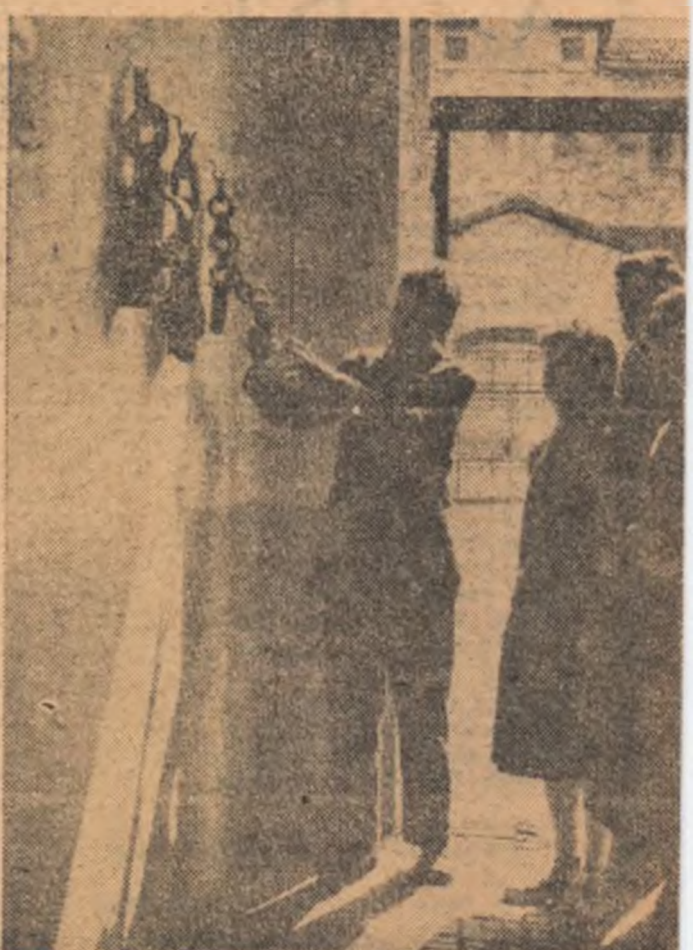
În vizită la Muzeul Doftan