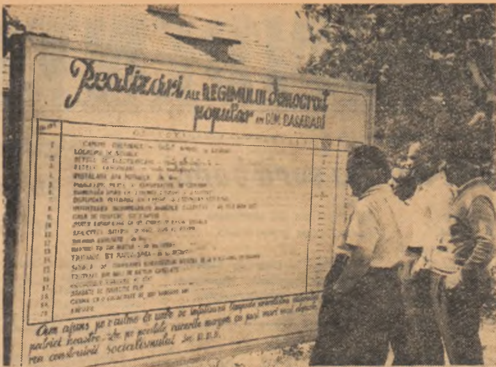
Acest panou se află în centrul comunei Basarabi.

Agapie, care nu înțeleseseră să-și facă garduri frumoase ca vecinii lor. Satira nu le-a convenit, dar le-a folosit. Astăzi, trecind prin fața caselor lor poți vedea garduri din piatră și ciment.