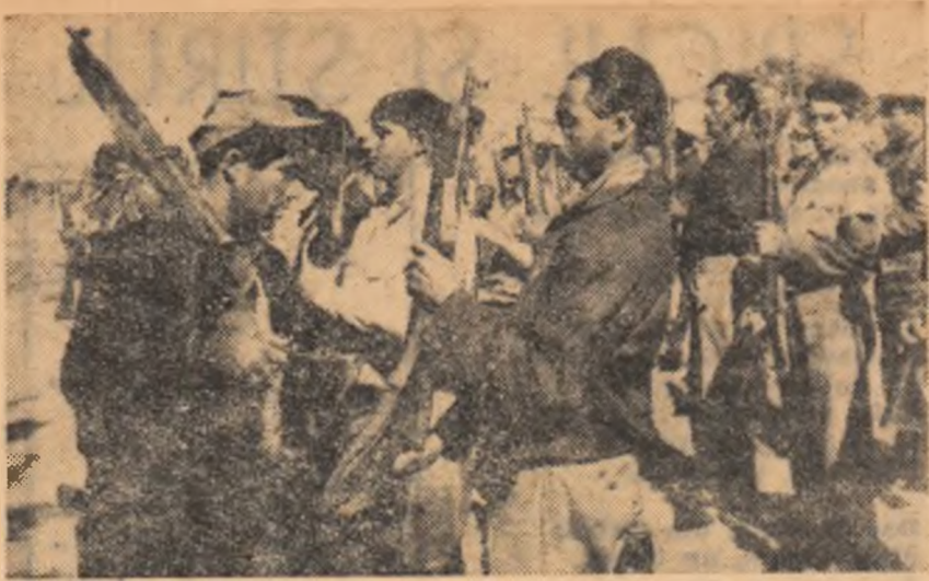
Alături de muncitorii de la orașe, țărani cubani își completează și ei instrucția militară pentru a fi gata oricând să înfrângă orice atac al dușmanilor revoluției. În fotografie: țărani cubani din cooperativa agricolă „Pinos” la o bază de instrucție.