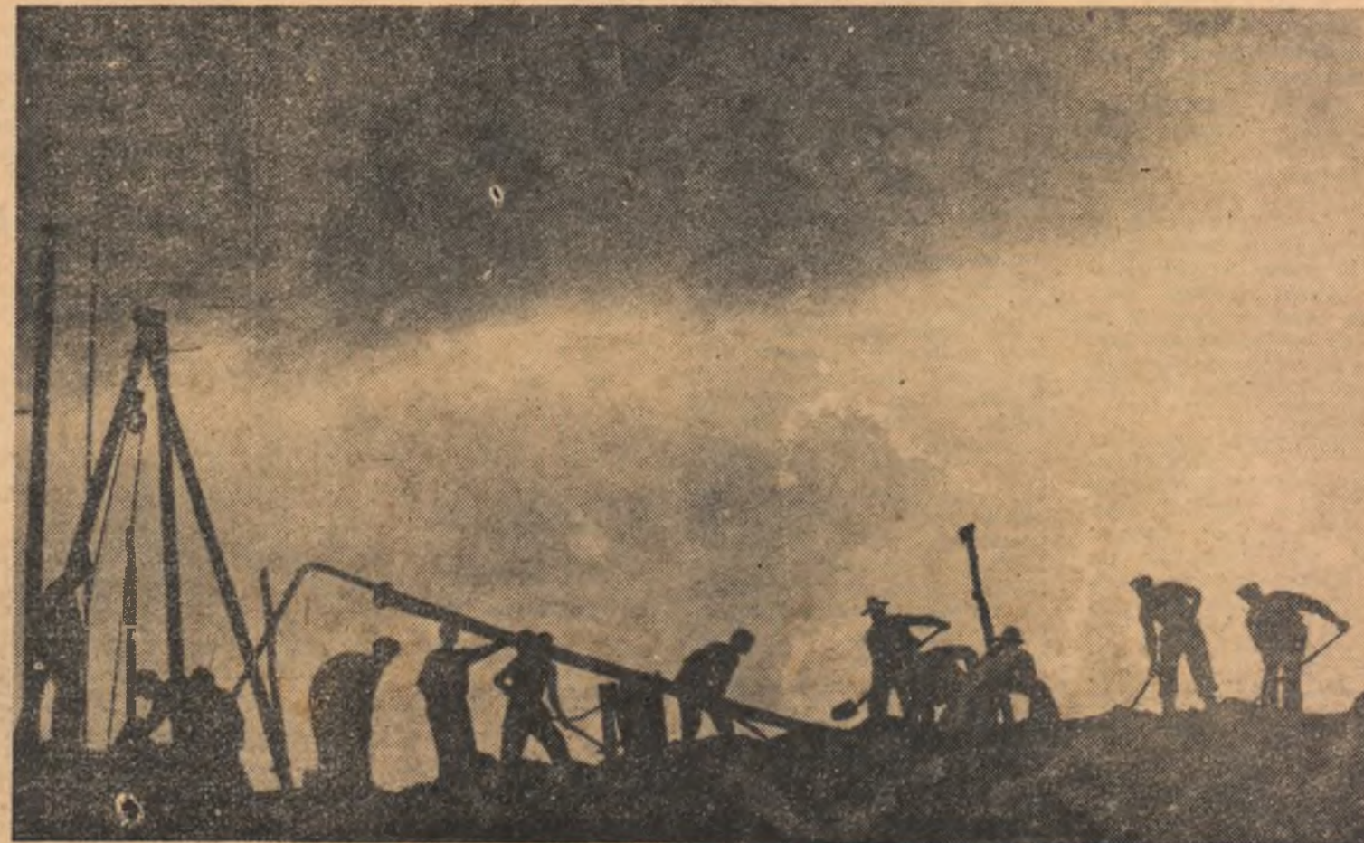
Lucrări de brigăzi

Se schimbă oc și locurile. Dispare” al satului liba din chirpici gard de gunoai vîntul de vară iar ploile toamna roaie. De dispare” nu-i pare menii fac totul cu mai curînd. Viața nă de bucurii p rit-o cere un na șurare.