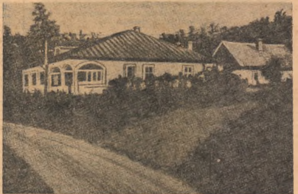
Casa de la Mircești a vornicului Vasile Alecsandri

Într-adevăr, la fiecare pas vezi semnele vieții noi: gara modernă și magazinul universal, sanatoriul de copii renovat și căminul cultural în construcție, șoselele pietruite și zecile de case noi, ridicate de gospodari harnici și pricepuți, care au schimbat înfățișarea locurilor. În noua școală de 7 ani, cu săli spațioase și luminoase, versurile poetului sună parcă mai armonioase, pline de farmec și noi înțelesuri. Și cînd te gîndești că pe vremea lui Alecsandri și pînă cu ani în urmă, sutele de analfabeți din Mircești îi cunoșteau versurile nu din citite, ci din auzite, de la unul și de la altul, minunîndu-i deopotrivă prin simplitatea și farmecul cu care vorbeau despre ei și natura înconjurătoare. Azi rar găsești o casă de gospodar din Mircești fără măcar cîteva cărți de-ale lui Alecsandri, iar pe fiecare din