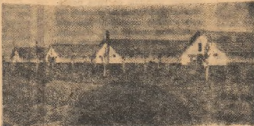
O parte din grajdurile G.A.C. „Drum nou”, comuna Drănic, raionul Segarcea.