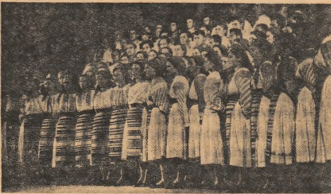
Corul Casei raionale de cultură Năsăud, regiunea Cluj