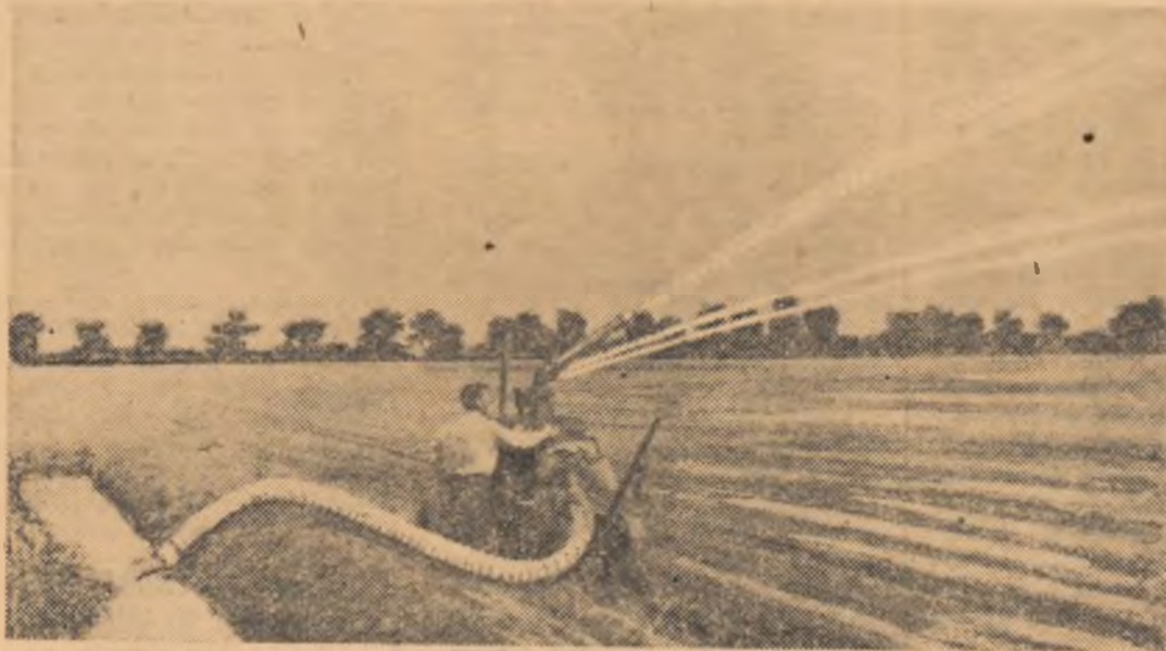
Sursa de apă se află la 4 km, în brațul Borcea. Rețeaua de canale și aspersorul au adus-o pînă aici la cultura dublă de porumb siloz

Vreau să mai subliniez — spune tovarășul Habor, încă înainte de a avea răgazul să-i adresăm întrebarea următoare — unele acțiuni de sprijinire directă a gospodăriilor agricole colective. La Malu, Gogoșari, Singureni și apoi în întreg raionul, s-au organizat cursuri cu participarea șefilor de brigăzi și de echipe, unde s-a predat despre modul în care se calculează ziua-muncă, acordul pe echipe și individual etc. Acestea s-au bucurat de un interes co-