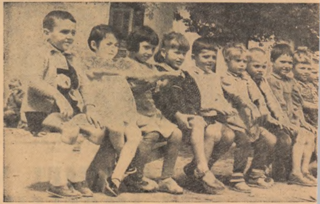
Grădinița sezonieră a g.a.c. din comuna Dragoș Vodă, raionul Giurgiu.

Intr-un grafic se arată: cite mărfuri industriale au fost desfăcute într-un an și cît au livrat cele două gospodării statului pe bază de contract. Balanța trage mai greu la produsele industriale. În satul de stepă arid și mizer cîndva, ați azi în magazine totul, de la sticlucă de odicolon pînă la motocicletă. Oamenii trăiesc pentru prima dată în viața lor confortabil și civilizată. Președintele a mărturisit că nu poate suferi