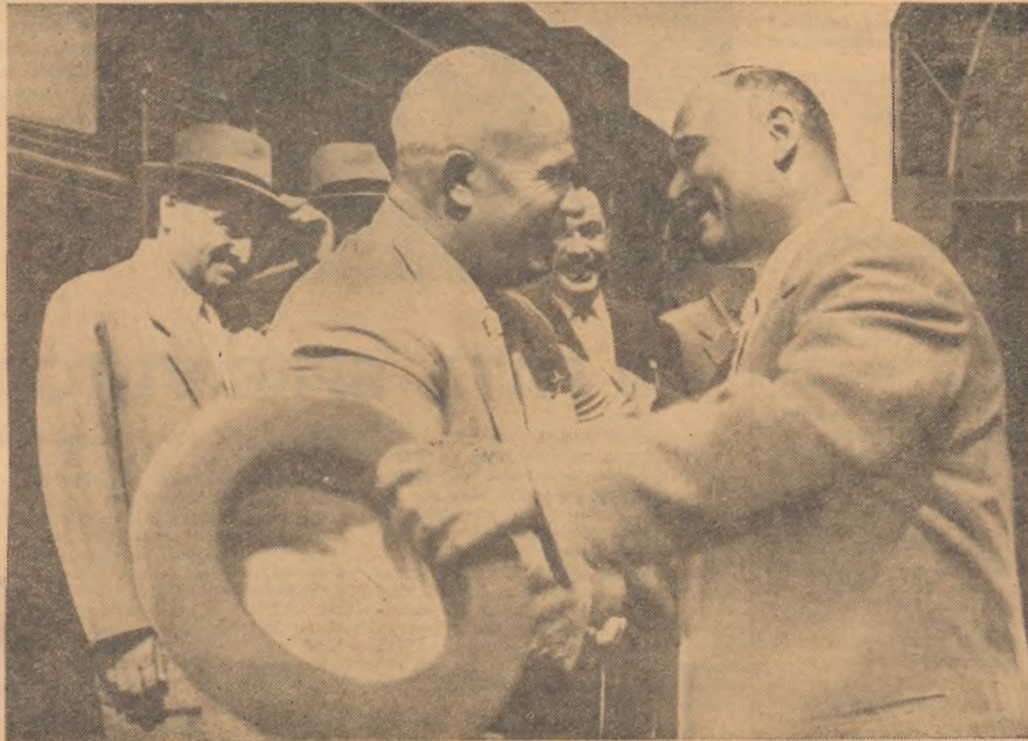
La sosire, în gara Kiev

Capitolul șapte este intitulat „Partidul în perioada construcției desfășurate a comunismului”.