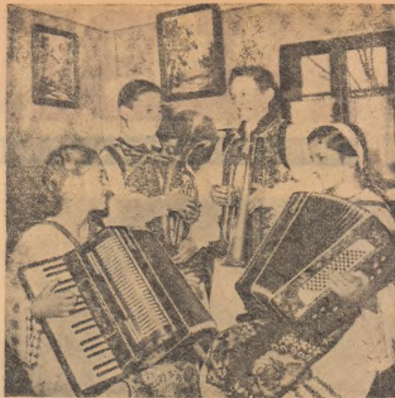
Numeroși fii de colectivisți din comuna Topolovățul Mare, raionul Lugoj, învață să cînte la acordeon și instrumente de alamă pentru fanfare. În fotografie: aspect de la una din repetiții.