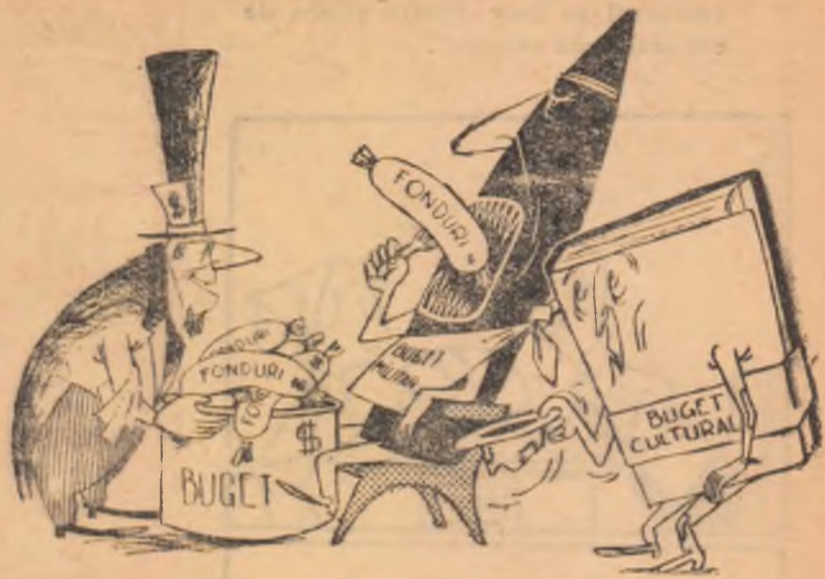
BUGETUL CULTURAL: — Of!.. Asta înghite tot!! (Desen de N. CLAUDIU)