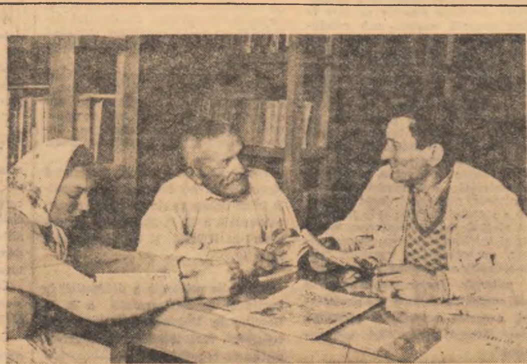
Cititori ai bibliotecii comunale din Lunca, regiunea Crișana, cercetînd noile cărți sosite la bibliotecă.