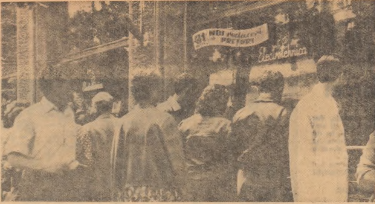
Recenta Hotărîre a partidului și guvernului a fost primită cu bucurie legitimă de oamenii muncii din țara noastră. Vitrinele magazinelor cu lista noilor prețuri au devenit în aceste zile obiectul atenției generale.