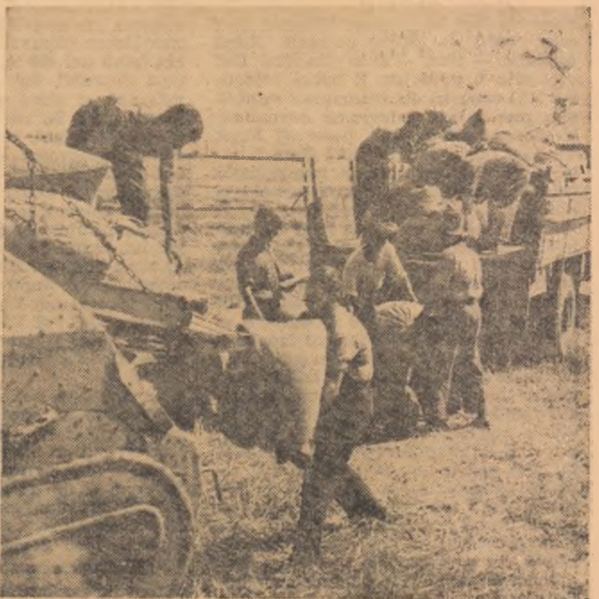
Colectiviiștii din comuna Recaș, regiunea Banat, și-au luat angajamentul să recolteze la timp și fără pierderi. Camioanele gospodăriei transportă fără întrerupere grăul recoltat cu combinele.