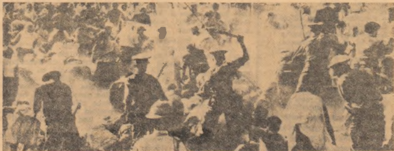
Regimul de opresiune și teroare din Uniunea Sud-Africană nu poate înfrînge voința poporului african de a lupta pentru o viață liberă și independentă. În fotografie: represii ale autorităților împotriva manifestanților care cer libertăți democratice.