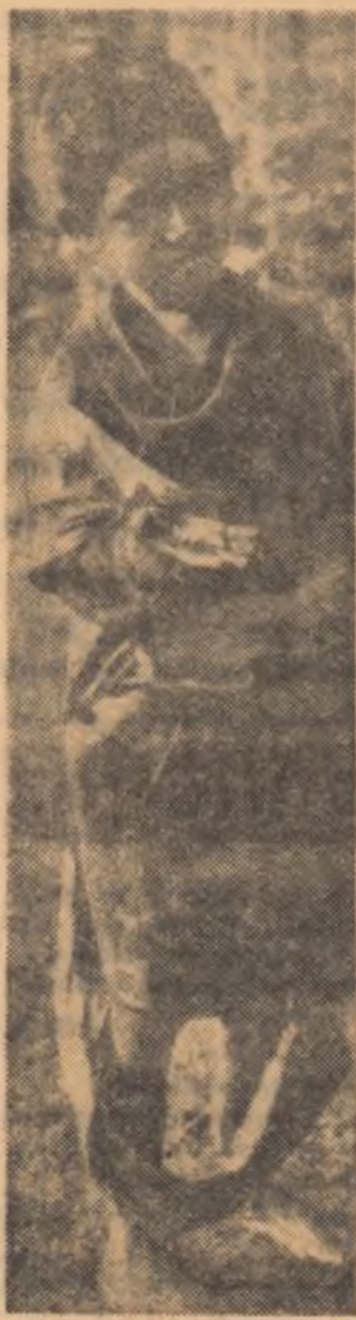
Asemenea aspecte dezolante se pot vedea adesea pe străzile satelor și orașelor iraniene

● Președintele republicii Indonezia, Sukarno, a declarat de curînd că poziția Indoneziei în problema Iranului de vest rămîne neschimbată: Olanda să înapoizeze necondiționat acest teritoriu Indoneziei. „Numai în acest caz sîntem gata să ducem tratative cu Olanda“, a declarat președintele.