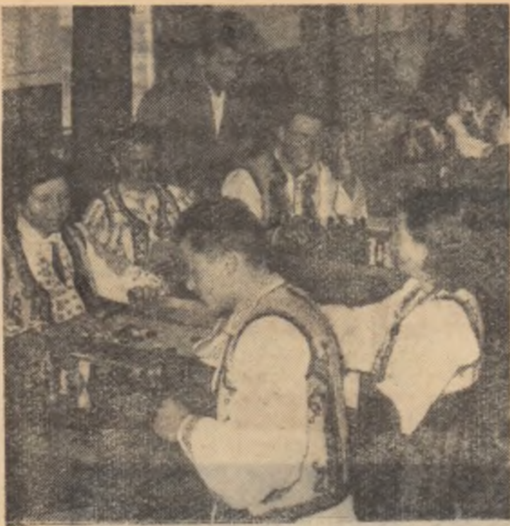
La colțul roșu al g.a.c. din comuna Săveni, raionul Fetești, tineri colectivizști participînd la un concurs de șah organizat de cîminul cultural