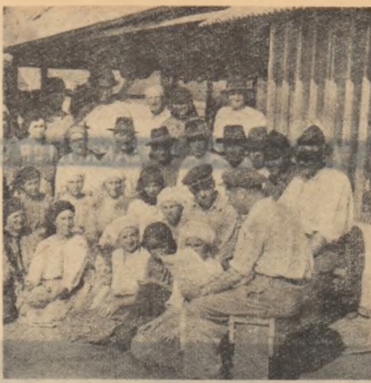
Citirea ziarului în pauza de prînz la brigada legumicolă a G.A.C. „24 Ianuarie” din Țigănești, regiunea București.