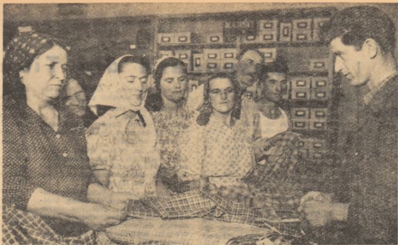
Un grup de colectiviste din comuna Tudor Vladimirescu, raionul Galați, cumpărînd țesături de la cooperativă