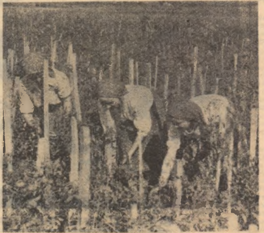
Se culeg roșiile la gospodăria agricolă colectivă „24 Ianuarie” din comuna Tîgănești, raionul Alexandria