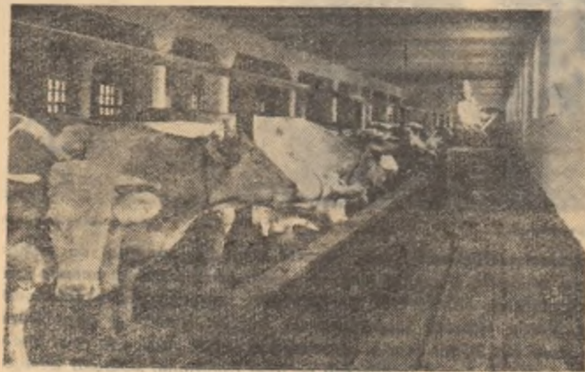
Gospodăria agricolă colectivă din Bod, regiunea Brașov, are un puternic sector zootehnic. În fotografie: Aspect de la ferma de vaci