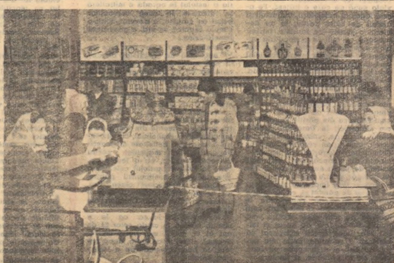
Magazinul cu autodeservire din comuna Miercurea Niraj, regiunea Mureș-Autonomă Maghiară