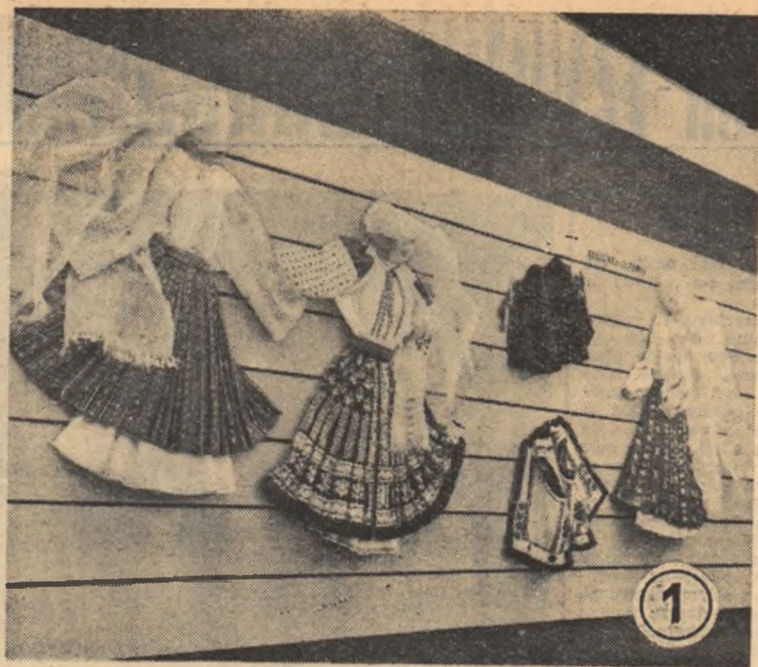
BIENALA ARTEI POPULARE

ărie colec- sta să salte 45 de lei, o alte ase- fării.