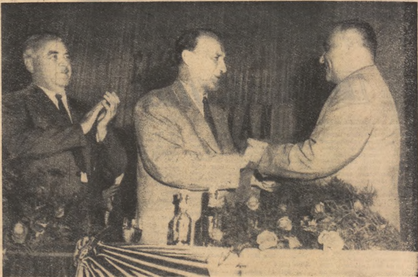
Tovarăşii Gheorghe Gheorghiu-Dej, János Kádár şi Ion Gheorghe Maurer la tribuna oficială

Mulţumind pentru urarea făcută, tovarăşul Gheorghe Gheorghiu-Dej a amintit că a mai vizitat Sztálinváros-ul atunci cînd în aceste locuri abia începuseră lucrările de construcţie ale noului oraş. Tovarăşul Gheorghe Gheorghiu-Dej a urat succes, sănă-