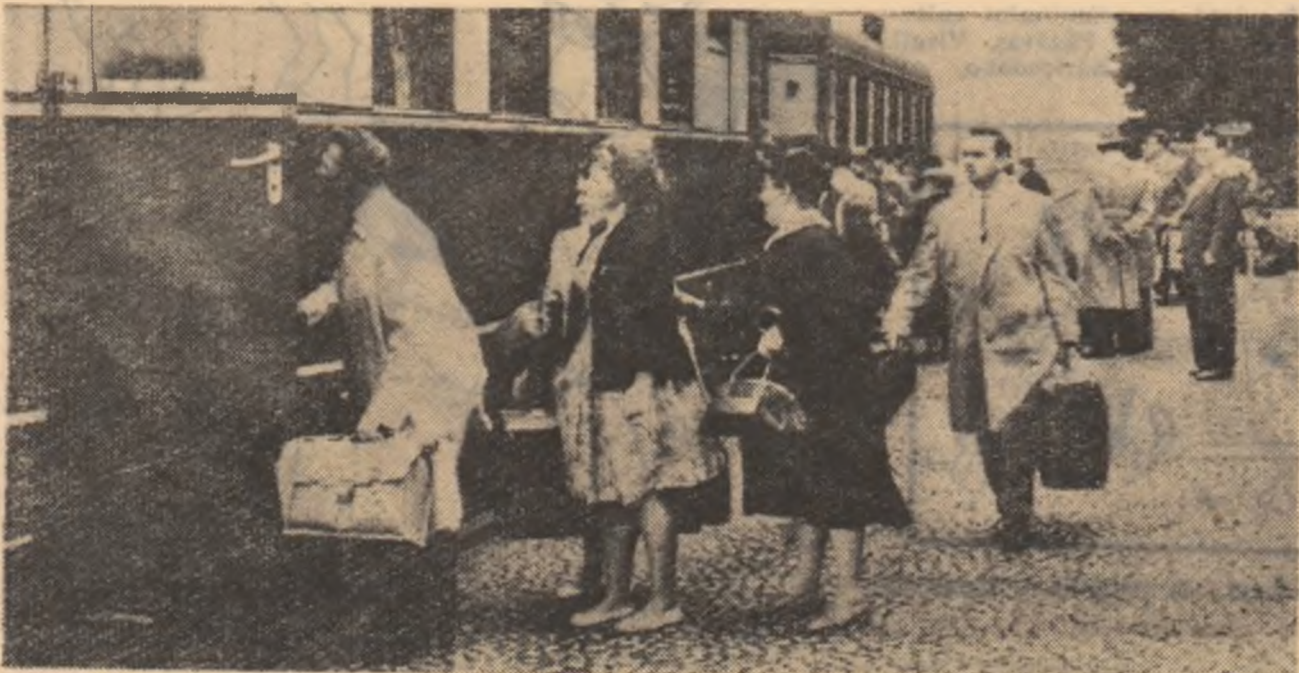
Un grup de cetățeni din Germania occidentală refugindu-se în R. D. Germană din cauza mizeriei și măsurilor represive luate împotriva populației de guvernul lui Adenauer.

Lucrările întîlnirii de la Belgrad au marcat un eșec pentru cercurile reacționare din Occident și pentru numeroși propagandiști ai Washingtonului și Bonnului care rolau în jurul delegaților și ziarștilor din țările neutre pentru a influența asupra cursului conferinței