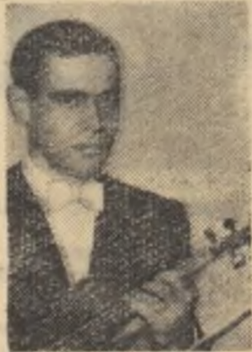
Violonistul sovietic Leonid Kogan

„Românii le place muzica” — au remarcat mulți dintre invitații străini la festival și ei spuneau cu asta