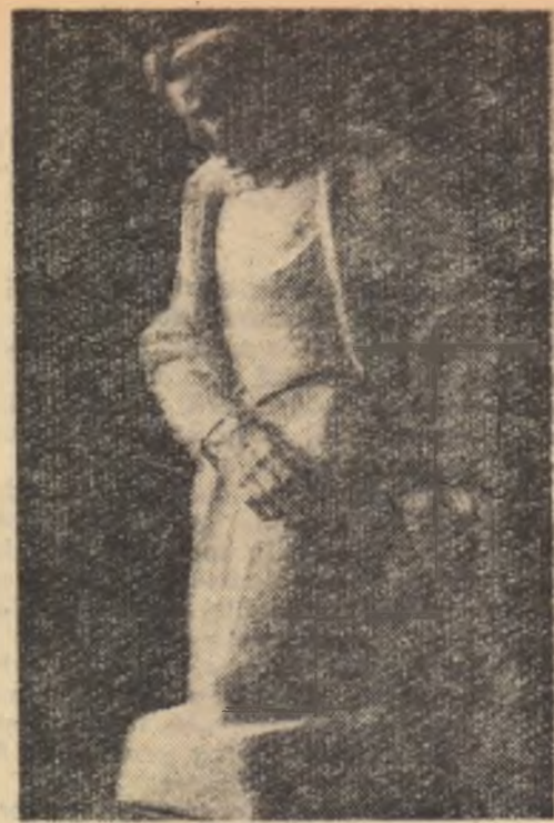
George Enescu Sculptură de BORIS CARAGEA

U.R.S.S.: „Am făcut câteva promenade prin orașul dv. și am rămas încântat. O arhitectură veselă, caldă a noilor clădiri, parcuri cu o vegetație exuberantă”.