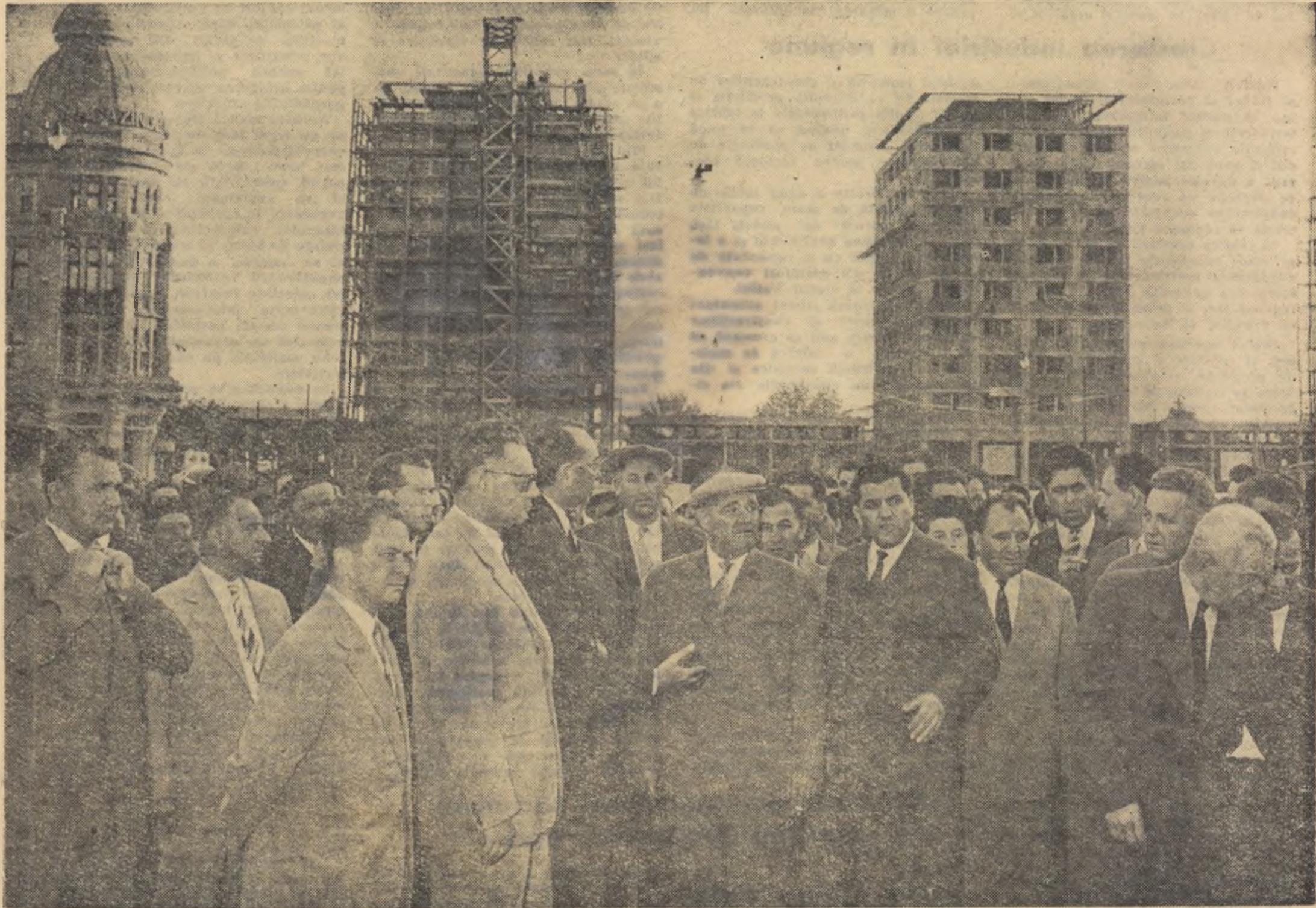
Conducătorii de partid și de stat la Iași, pe șantierul noilor blocuri din Piața Unirii.