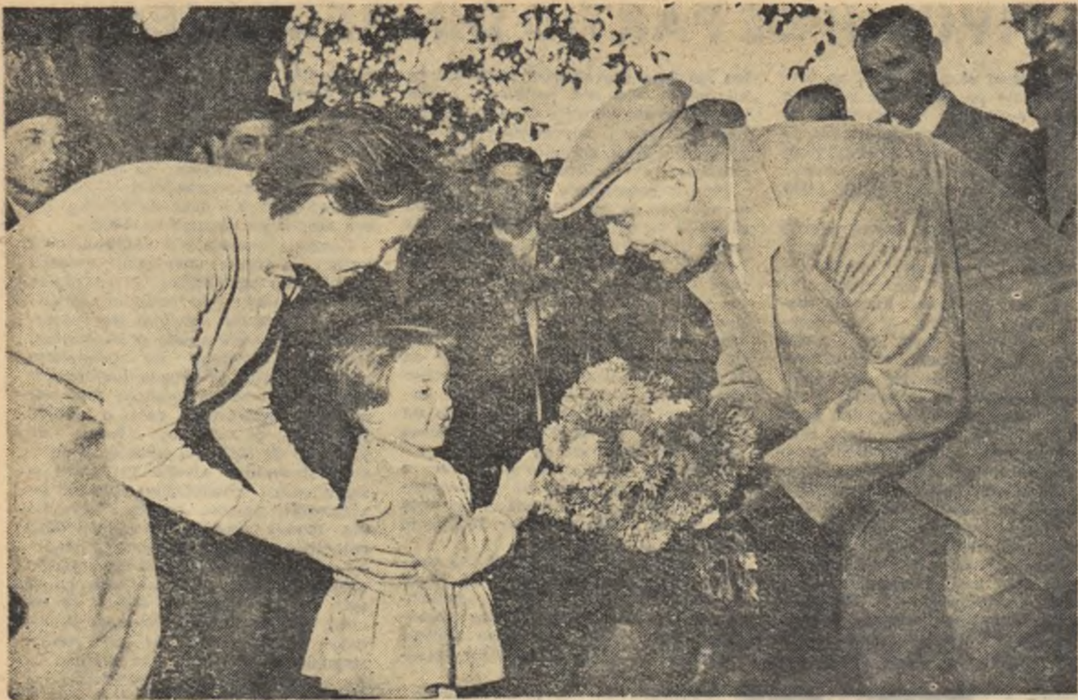
Și cei mici se bucură de vizita conducătorilor noștri de partid și de stat.