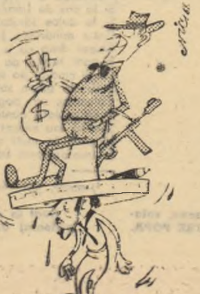
„Alianța” pentru progres în acțiune!

„Ajutorul” S.U.A. dat țărilor Americii Latine poate numai să înrăutățească situația acestor țări.