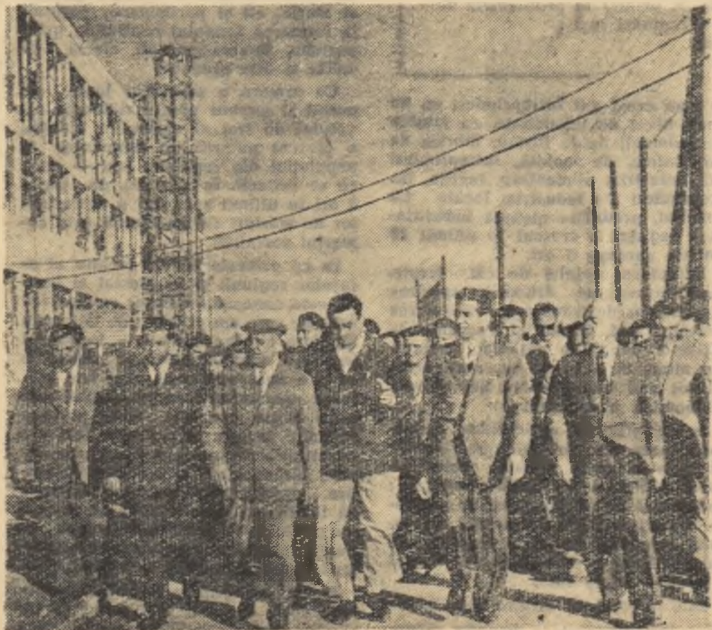
În vizită pe șantierul fabricii de ulei din Iași.

Lucrările de îmbunătățiri funciare prevăzute vor permite scoaterea de sub inundații pînă în 1965 a unei su-