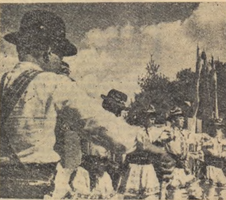
Formația de călușari a căminului cultural din Frumoasa, Iași, la sărbătorit cu această ocazie un veac de existență.

Dacă în trecut, apicultorul era practicant de