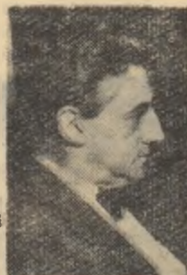
Dirijorul englez Sir John Barbirolli