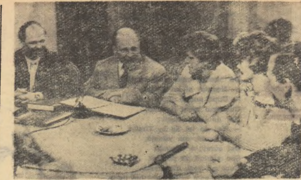
Numeroși țărani colectivizști din R.D.G trimis scri-sori conducători lor de partid și de stat în care își manifestă dorința fermă de a întări alianța cu clasa muncitoare și de a lupta consecvent pentru construirea socialismului și pentru pace. În fotografie: O delegație de țărani colectivizști din Bad Selzungen împreună cu Walter Ulbricht.