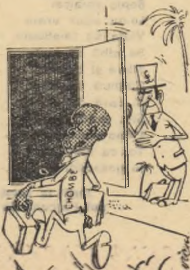
Landsdown: — Poștiți, întrați domnule președinte!

Misiunea lui Landsdown, secretar parlamentar al Ministerului Afacerilor Externe al Angliei a avut drept scop să salveze regimul separatistului Chombe din Katanga. (Ziarele)