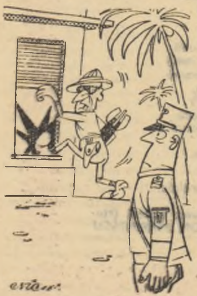
Ultracoloniștii: — Ai grijă, să nu mă deranjeze nimeni!!!

Profitând de îngăduința autorităților franceze, ultracoloniștii se dedau zilnic la noi provocări.