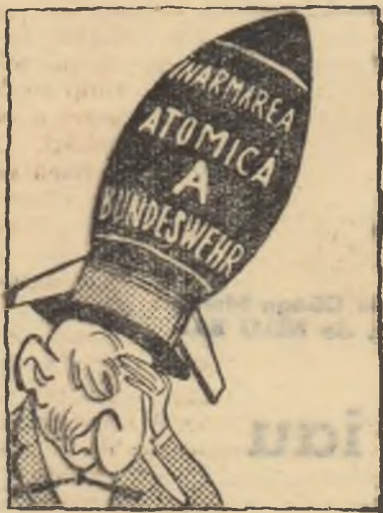
Adenauer: — Ce de griji are pe cap un cancelar!

Delegația S.U.A. se face luntre și punte pentru a menține și în acest an pe ciankașist la O.N.U.