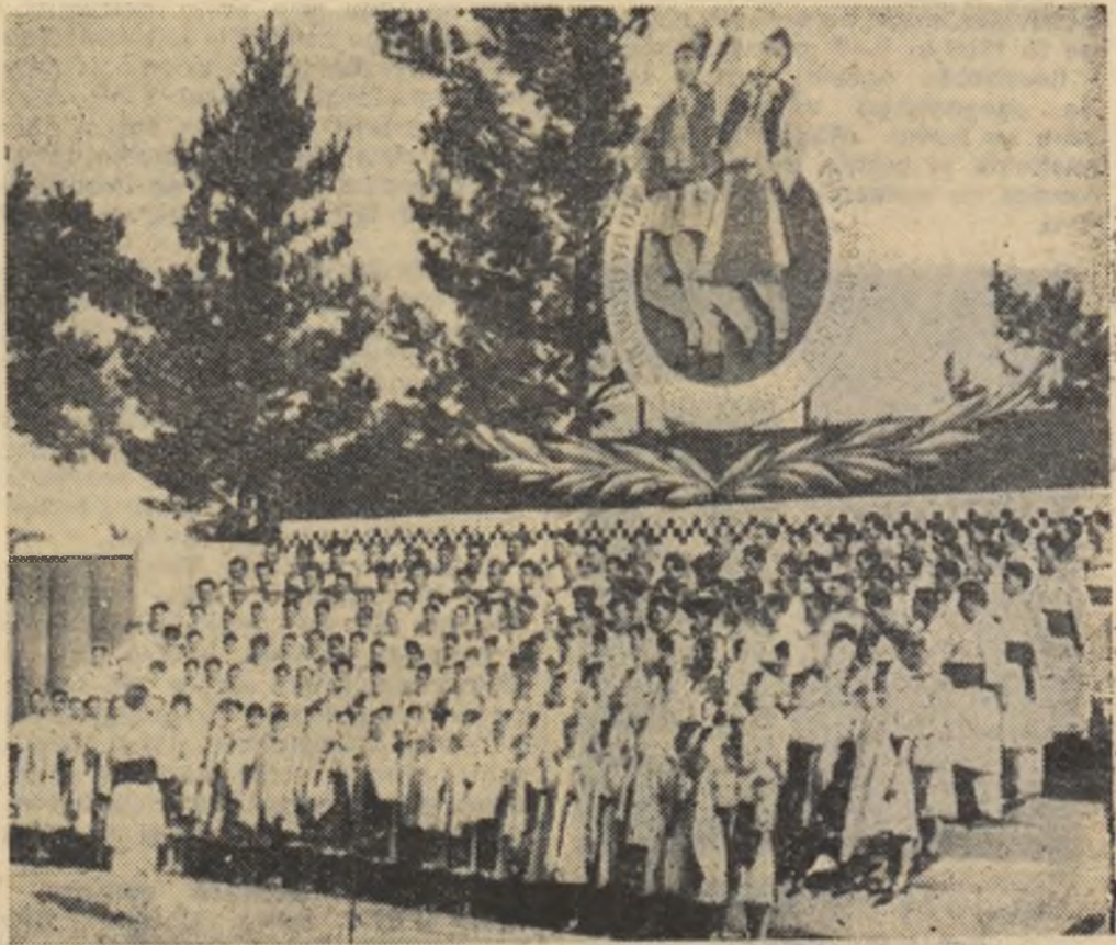
Finala celui de al doilea Festival al cîntecului, jocului și portului din regiunea București a fost deschisă de corul căminului cultural din Fur- culești, raionul Alexandria.