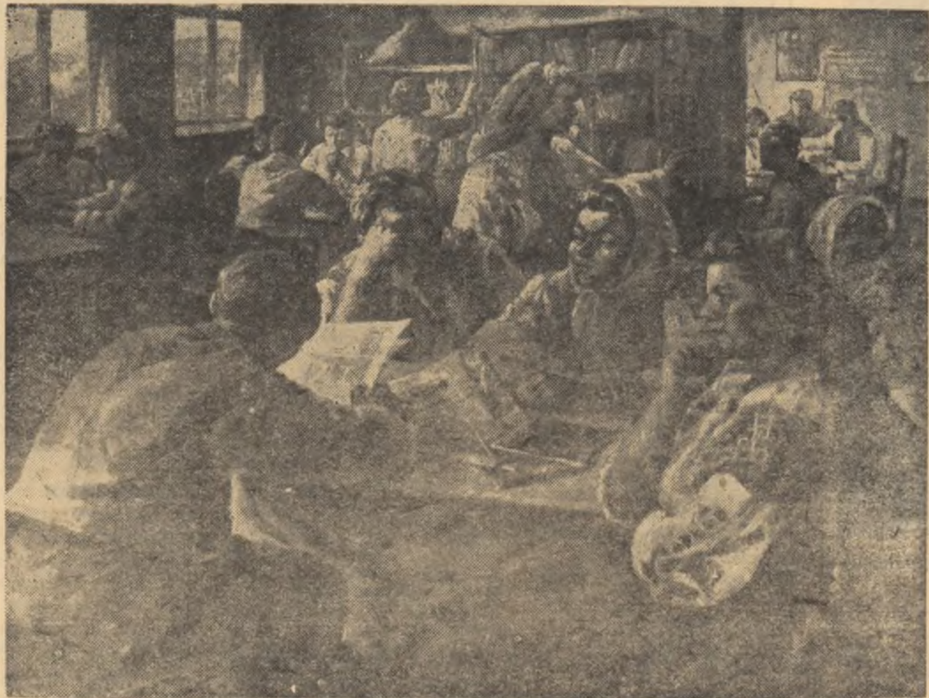
La căminul cultural.