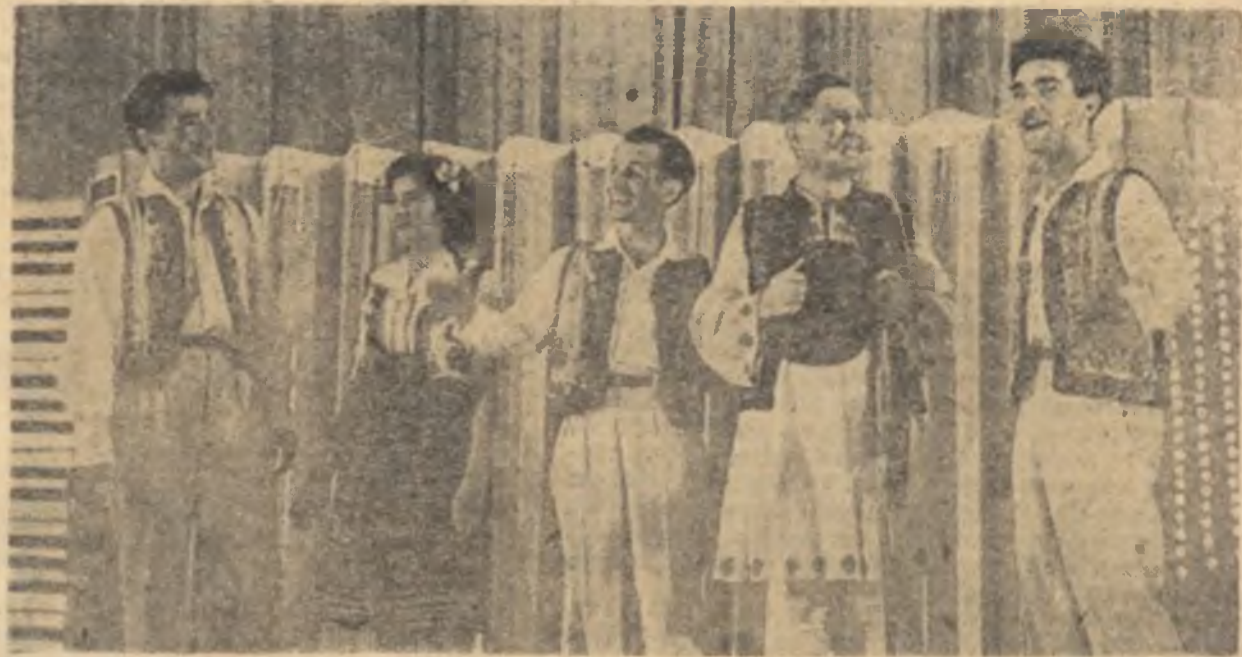
Brigada artistică de agitație a casei raionale de cultură din Negrești, laureată a celui de-al VI-lea concurs al formațiilor artistice de amatori.