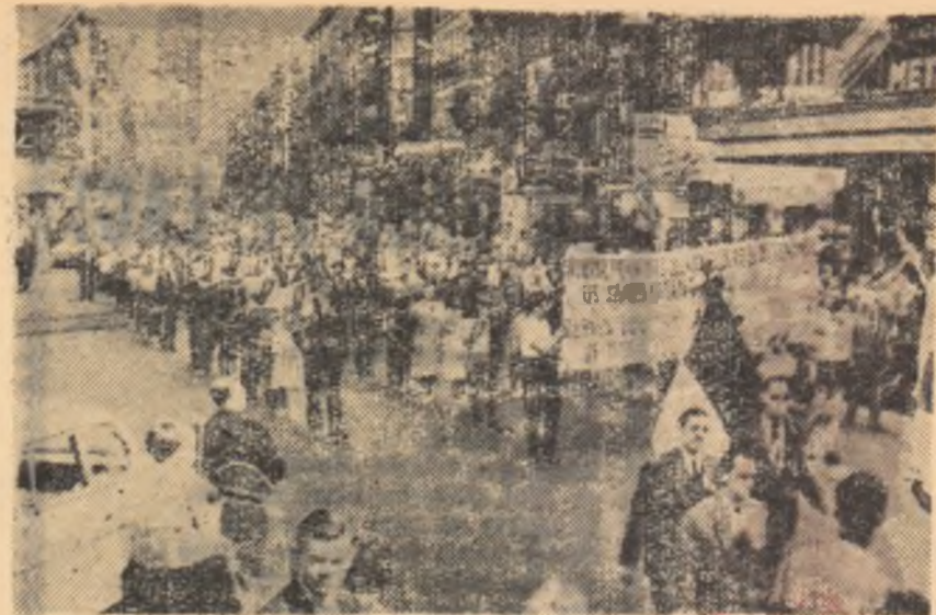
Manifestație de protest în Bruxelles împotriva bazelor militare vest-germane din Belgia.

Popoarele lumii așteaptă și cer ca actualele tratative dintre puterile atomice să dea rezultate concrete și pozitive. Dacă și puterile occidentale vor da dovadă de înțelegere, atunci speranțele popoarelor vor fi realizate, se va ajunge la încheierea unui acord pentru încetarea experiențelor nucleare și se va face astfel un pas însemnat spre înlăturarea pericolului unui nou război mondial.