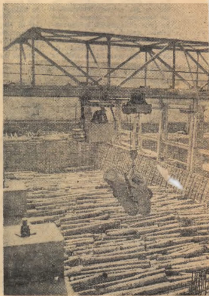
Bazinele de depozitare a buștenilor

La început sala de șed varășul Luc întreprinder bun sosit u tori de la S tru a urma de șase luni placaj ai co au fost prin jurați de c inginerilor derii din G torului în m