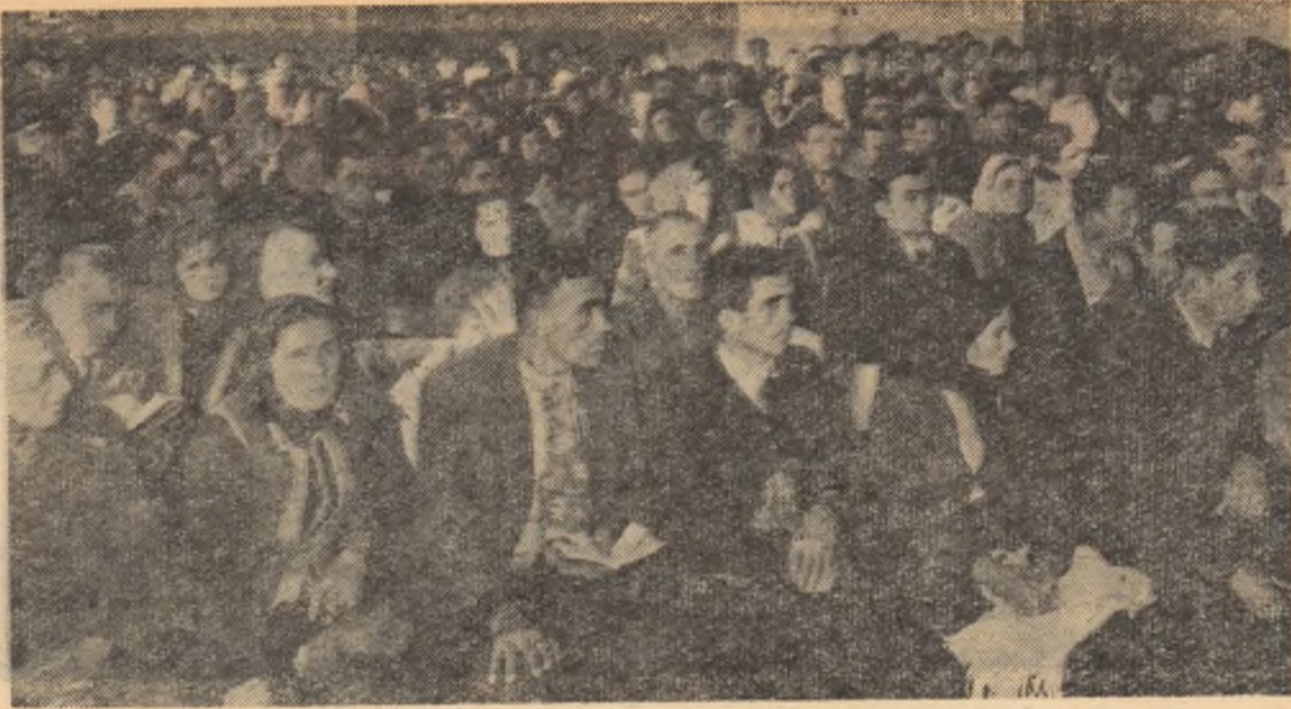
Aspect de la consfătuirea raională a colectivităților fruntași din raionul Alexandria, regiunea București.