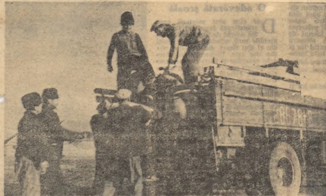
Colectivității din Voivoda au obținut în acest an supraproducție la porumb. Din sporul de producție ei au suplimentat contractările cu statul cu încă 6,5 vagoane porumb boabe. Iată-i încărcînd un ultim transport.

Adunarea a ales pentru Consfătuirea pe țară a țărănilor colectivități 23 de delegați: președinți de g.a.c., brigadieri, șefi de echipe, colectivități fruntași.