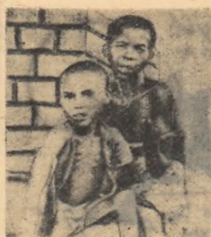
Iată ce-au lăsat în urma lor colonialiștii în Africa.

● Analfabetismul a atins în Africa proporții uriașe. În Somalia, în țările Africii ecuatoriale și ale celei occidentale 95-99 la sută din populația adultă e neștiutoare de carte. În celelalte țări ale continentului, analfabeții reprezintă 60-96 la sută din totalul populației adulte.