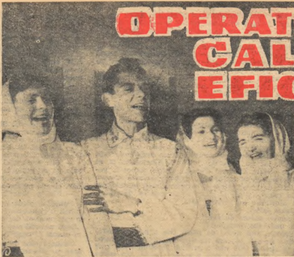
Veselia, veselia, umple azi gospodăria... (Moment din programul brigăzii artistice de agitație din Voivoda)

refrenul Satul e milionar . Pe el se brodează, de altfel întreg progra- mul.