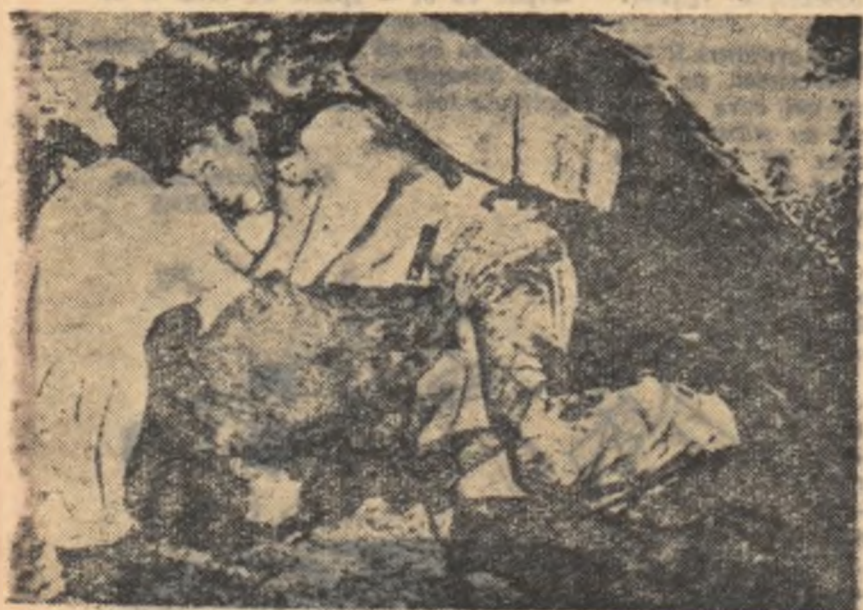
Acești muncitori portoricanii din New York au trebuit să-și caute adăpost pentru o noapte, sub o scară. E normal cînd n-ai de lucru luni și luni în șir, să n-ai cu ce plăti chiria sau o cameră la hotel.