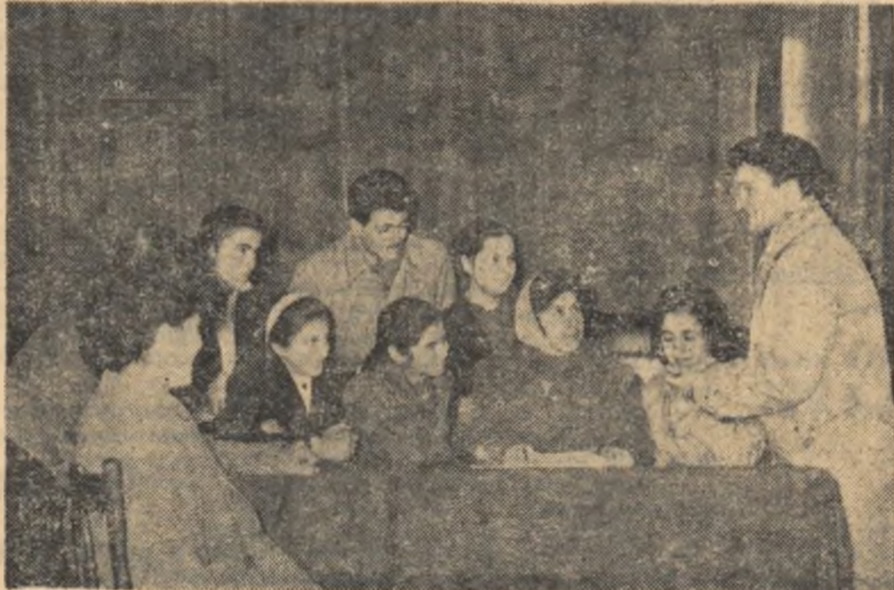
Se impart rolurile. In curînd la Naipu, brigada artistică de agitație va prezenta noul său program.

Brigada din Voivoda, raionul A- lexandria, repetă în mod frecvent