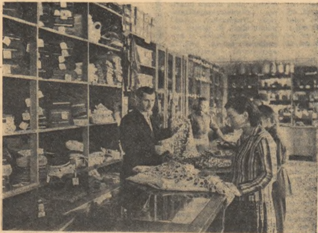
Interiorul noului magazin universal din comuna Mihai Viteaz, regiunea Cluj