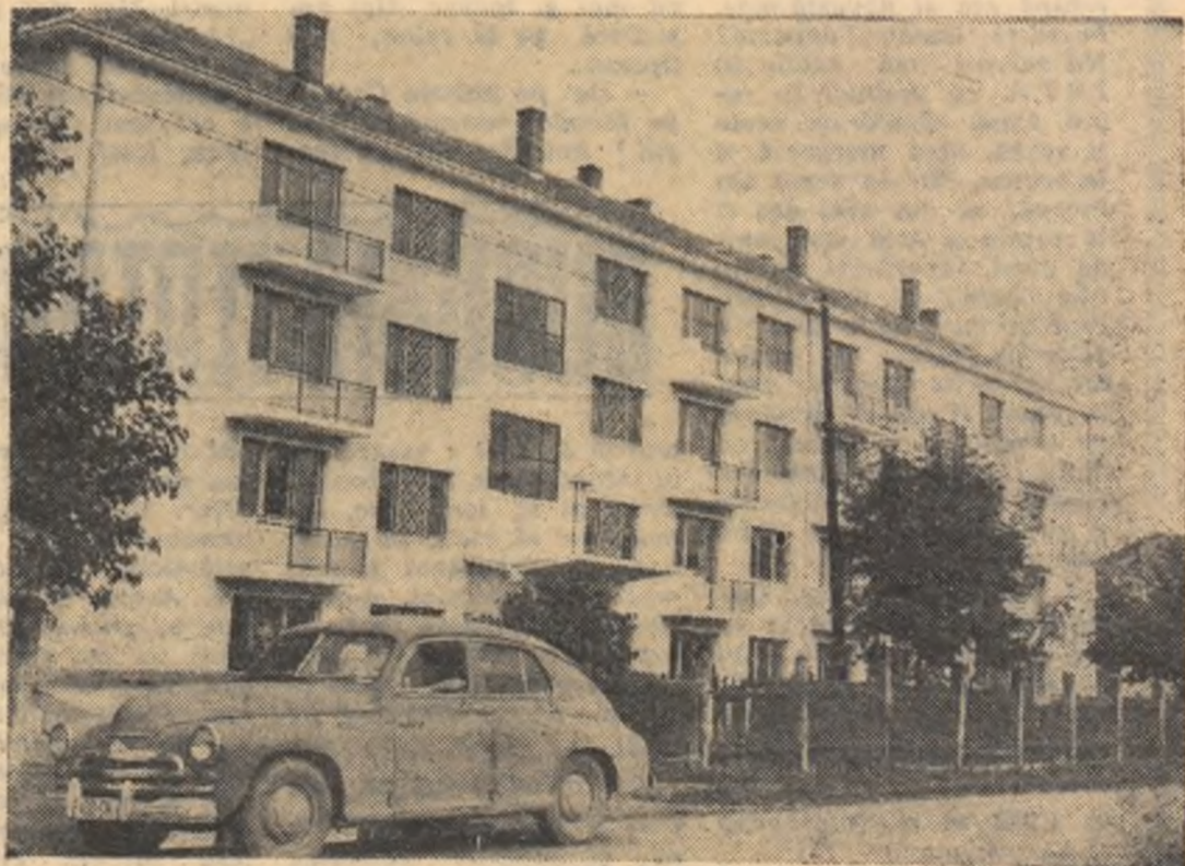
Un nou bloc de locuințe din Gîmpia Turză, regiunea Cluj