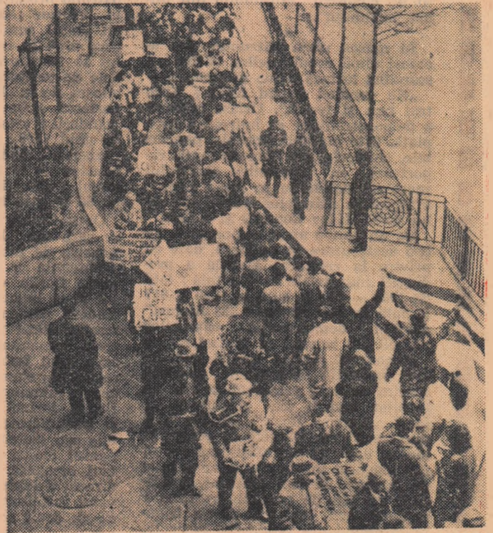
Un marș al păcii la New York

● În întreaga lume continuă campania de primăvară pentru pace și dezarmare. Poporul francez se pregătește în vederea desfășurării statelor generale pentru dezarmare, convocate la Paris pentru ziua de 19 mai. În mitinguri și mari adunări sînt aleși reprezentanții care vor participa la această grandioasă manifestare a voinței poporului francez de a se pune stavilă războiului rece, de a se înfăptui dezarmarea generală. În portul Aarhus din Danemarca, cu prilejul vizitei unui grup de nave de război vest-germane, a avut loc o demonstrație de protest împotriva colaborării militare a Danemarcei cu Germania occidentală. Participanții la demonstrație purtau pancarte cu inscripțiile: „Nu — comandamentului militar danezo-vest-german“, „Să fie asigurată pacea prin dezarmarea generală“.