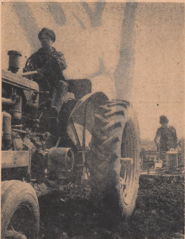
Pe ogoarele gospodăriei colective Brincoveni, raionul Slatina, semănatul porumbului se apropie de sfîrșit. În fotografie: tractoristul Emîl Tănase, de la S.M.T. Recea, execută semănatul porumbului