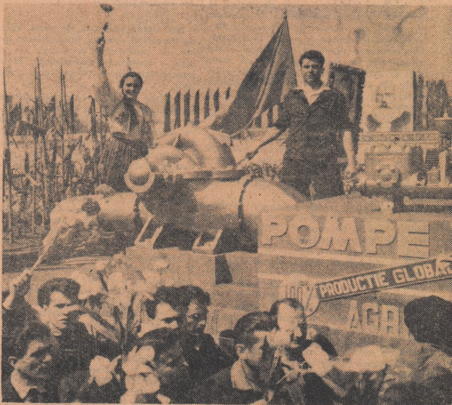
Trece carul alegoric al Uzinelor de pompe și mașini agricole din Capitală.