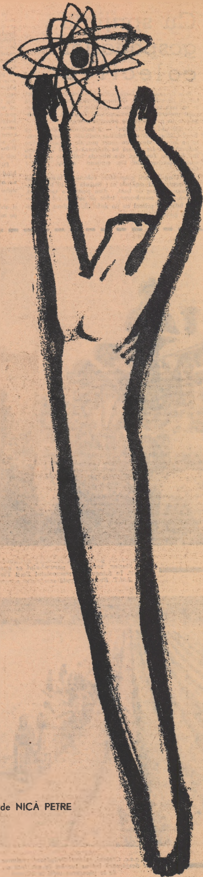
Desene de NICĂ PETRE

Îi voi privi-nălțimea cu apele-mi albastre Și nu furiș prin spații mă voi roti în mers, Nu rug nestîns voi fi în drumul printre astre, Cî poate capitala acestui univers.