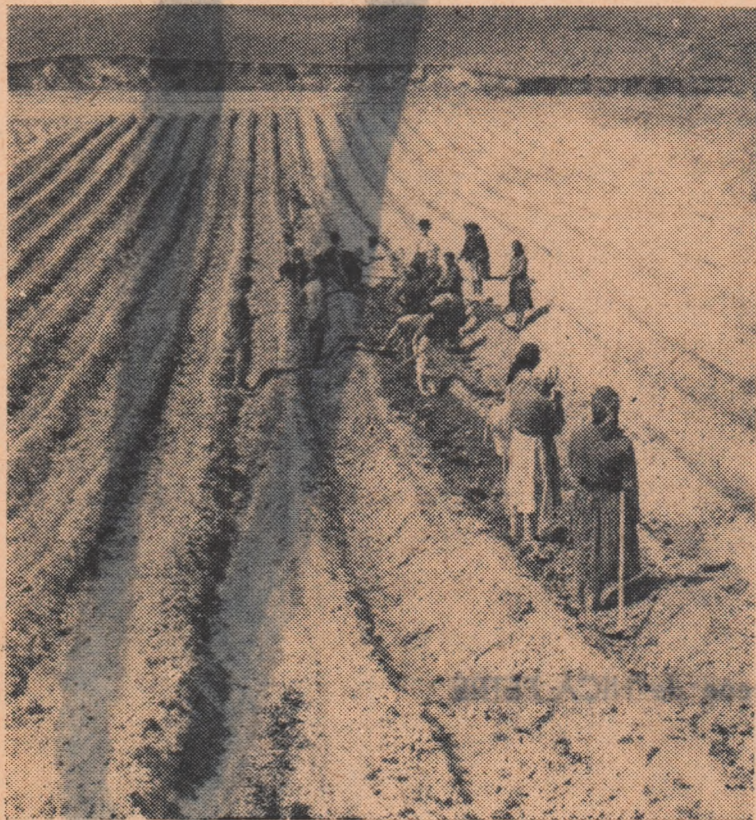
La g.a.c. Crețeni, raionul Drăgășani, regiunea Argeș, se desfășoară intens lucrări în vii. Iată un aspect de la plantarea viței la biloane