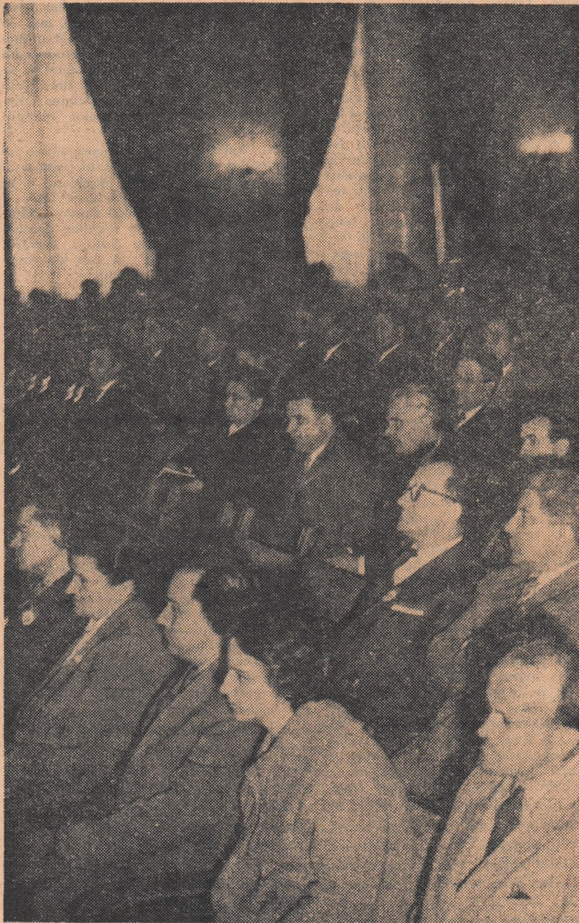
Aspecte din timpul ședinței

Hotărîrea prevede, de asemenea, o serie de măsuri menite să asigure îndrumarea eficientă a așezămintelor culturale de la sate de către Comitetul de Stat pentru Cultură și Artă și organele locale, precum și în vederea îmbunătățirii continue a bazei materiale a activității cultural-educative de masă.