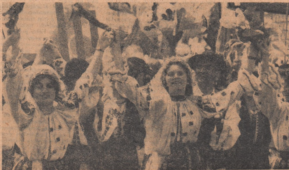
Entuziasm și voie bună.