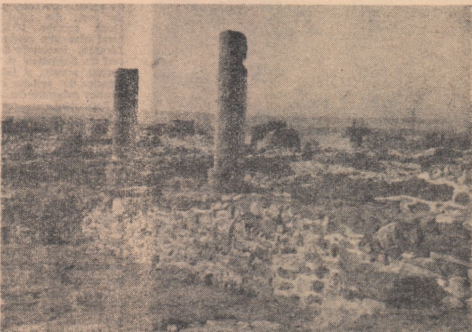
Vedere parțială a centrului castrului roman Drubeta

...Dunărea varsă anual în Marea Neagră între 228—340 milioane metri cubi de apă?