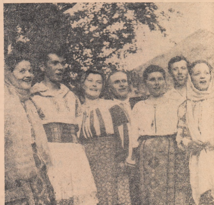
Cu ocazia duminicii cultural-sportive brigada artistică de agitație din Ciadulești-Suceava a prezentat un frumos program