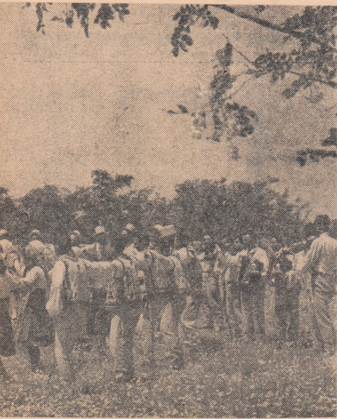
generații de dansatori a căminului leni, regiunea Ottenia.