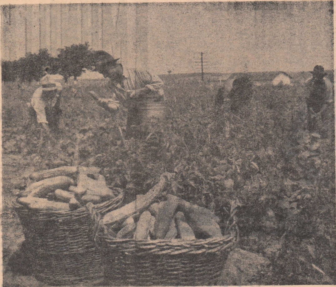
Recoltarea legumelor la G.A.G. Drăganesti, regiunea Bucuresti.