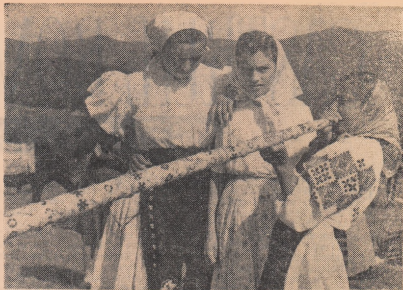
Fete cu tulnic