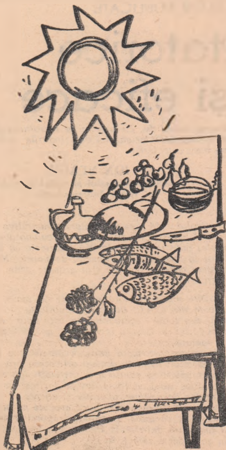
Desene de NICA PETRE

Sălcii suspinau în vînturi, era riul abătut. Dincolo, alle pămînturi, dincolo, un alî avut.