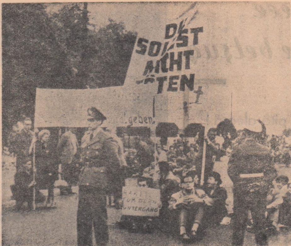
Miting de protest în fața unei baze militare americane din R.F.G. „Rachetele aduc nimicire”, „Vrem să supraviețuim” au scris demonstranții pe pancarte.