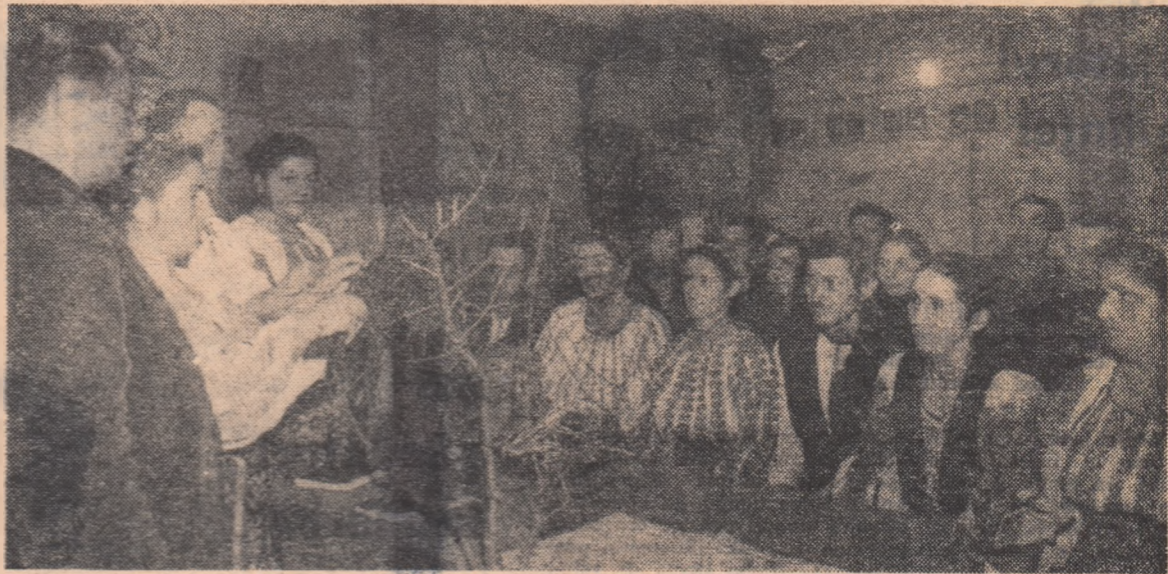
În comuna Domnești, raionul Curtea de Argeș, funcționează trei cercuri agrotehnice cuprinzând peste 150 cursanți. În fotografie: aspect de la cercul de pomicultură.

Și bine să știm ce va însemna și cum va arăta anul care vine. Cei mai virșnici știu cu cită grijă că cîte întrebări începeau anii cei grei ai trecutului. E bine să știm că în 1964 industria noastră se va dezvolta și mai mult de nivelul tehnicii mondiale, intra în funcțiune alte mari uzine și instalații de energie, că mii de blocuri se vor înălța, că milioane de cărți se vor tipări, că vor lua ființă școli noi și cinematografe, și teatre, că zeci de mii de tineri vor ieși din băncile universităților și vor porni spre toate zările țării. Că peste un an vom face țarași socoteala și vom vedea că am urcat și mai sus, că sîntem și mai aproape de piscul spre care