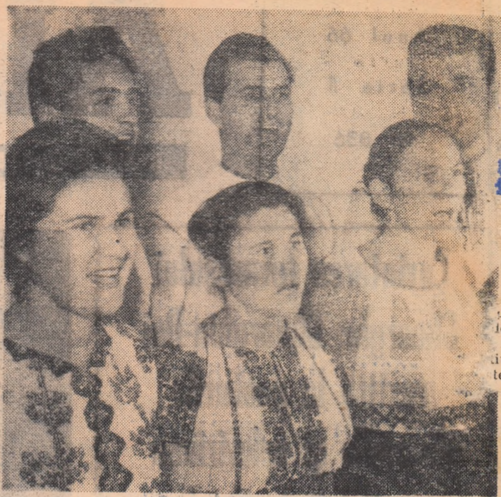
Moment din programul brigăzii artistice de agitate a căminului cultural din Voicesti, regiunea Argeș