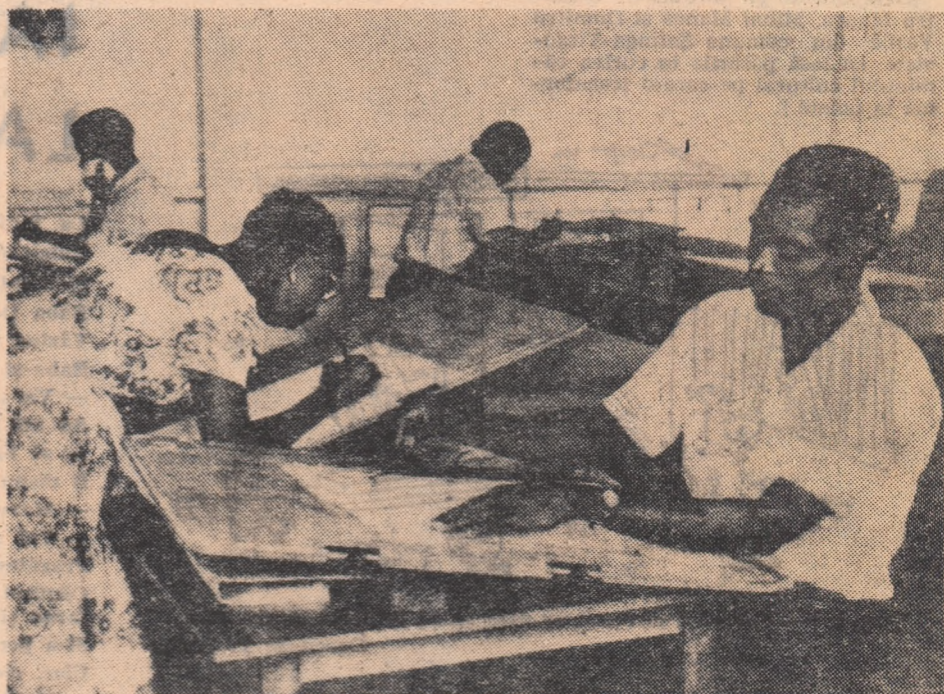
În republica Ghana se acordă o mare atenție dezvoltării învățămîntului. De la proclamarea independenței s-au înființat 2000 școli elementare, peste 300 secundare și câteva școli superioare. În clișeu: studenți de la școala normală a Republicii Ghana