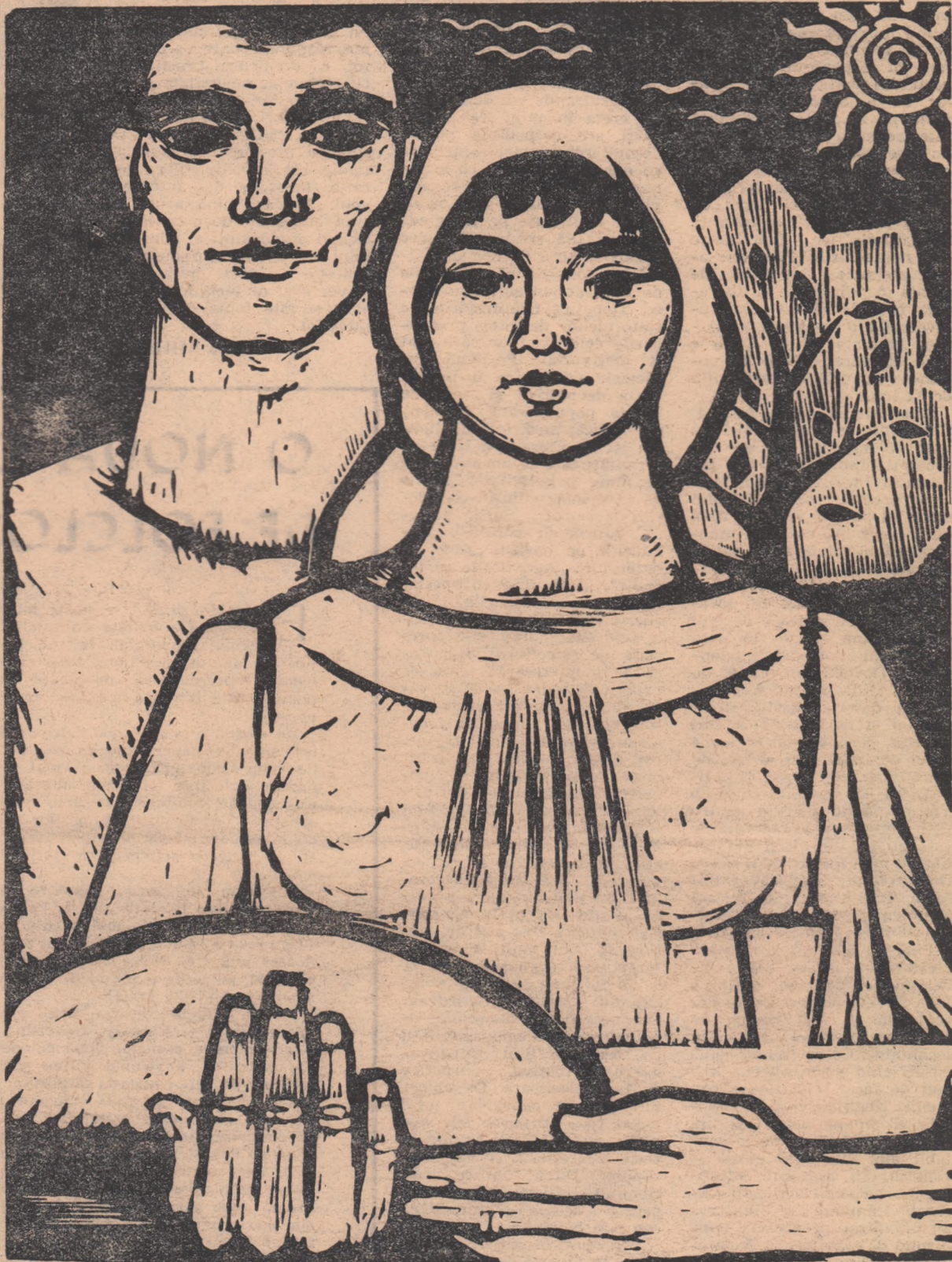
EUGENIA DUMITRAȘCU LUCA — Pîine și sare (gravură)

Iubiți tovarăși și prieteni, la mulți ani!