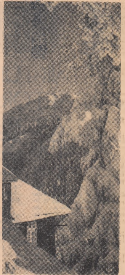
Cabana Cristianul Mare din masivul Postăvarul

Unele proiecte pe care mi le-am făcut pentru anul acesta sînt legate și de activitatea cercului de legumicultori anul II din satul Rubla, comuna Bălțați, pe care îl conduc. Am predat pînă acum 10 lecții. La fiecare lecție am indicat și ce anume cărți ar trebui să citească cursanții. O remarcă: uneori cărțile acestea nu sînt lecturate. De aceea, împreună cu tovarășa bibliotecară am hotărît să ținem cîteva consfătuiri cu cursanții pe marginea celor mai importante broșuri și cărți despre legumicultură. Un alt proiect: la încheierea cursurilor să organizăm și un concurs: „Cine știe legumicultură, cîștigă“.