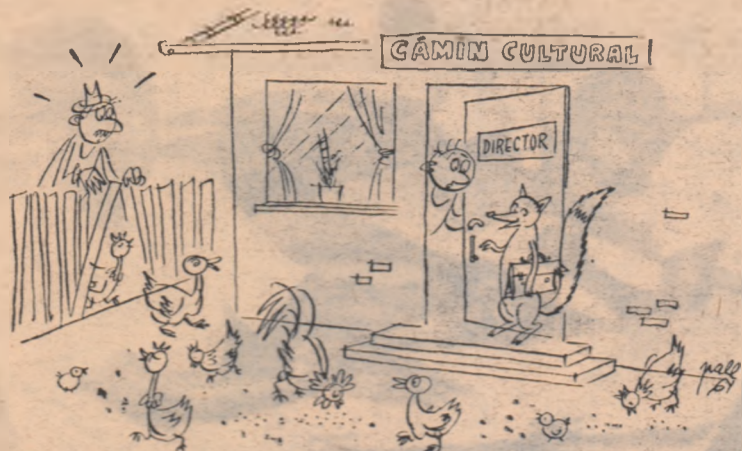
Vulpea: — Tovarășe director, aș vrea să vă țin locul câteva zile...