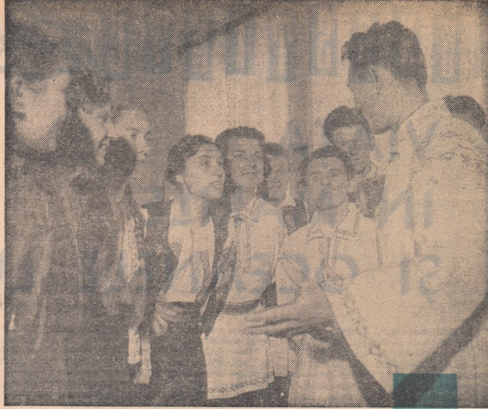
O repetiție a brigăzii artistice de agitație a căminului cultural din Cițcău, raionul Dej.

Între cele două spectacole trecuseră doar cîteva săptămîni, poate ceva mai mult de o lună. Dar cită muncă au cerut aceste săptămîni. Cită pasiune și dăruire din par- tea colectivului de creație, a instructorului și a celor doisprezece interpreți! Căci la Ceica de pe meleagurile Crișului munca brigăzii e privită cu multă seriozitate și simț de răspundere de către toți, de la au- torii textelor pină la cel mai tînăr artist care conlucrează la activitatea acestei for-