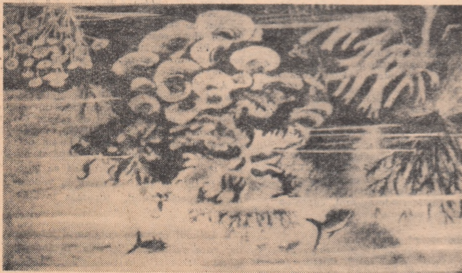
Din fauna și flora mărilor și oceanelor