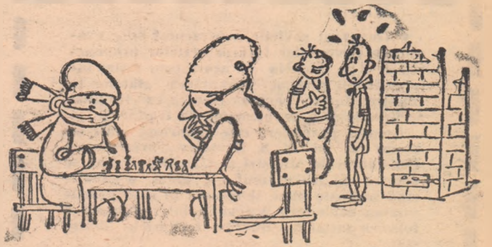
De ce stau așa infolosiți?! Doar e cald aici! Cică partida asta o dispută în cadrul Spartachiadei de iarnă!