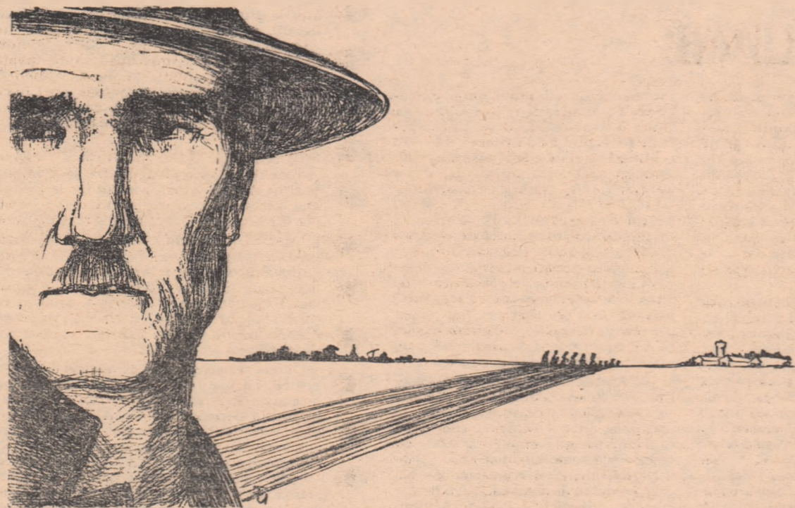
(Desen de T. IOANEȘ)

— Of! — făcu Brabeț, despovărat de teamă, ca imediat să ia un aer de căință. — Și... mai știi ceva, tovarășe președinte? Eu zic să rupi naibi cererea asta.