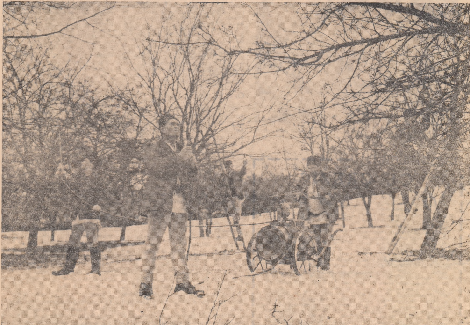
Pomicultorii din gospodăria colectivă Boșorod, regiunea Hunedoara, lucrează la curățatul și stropitul pomilor fructiferi din livada gospodăriei.