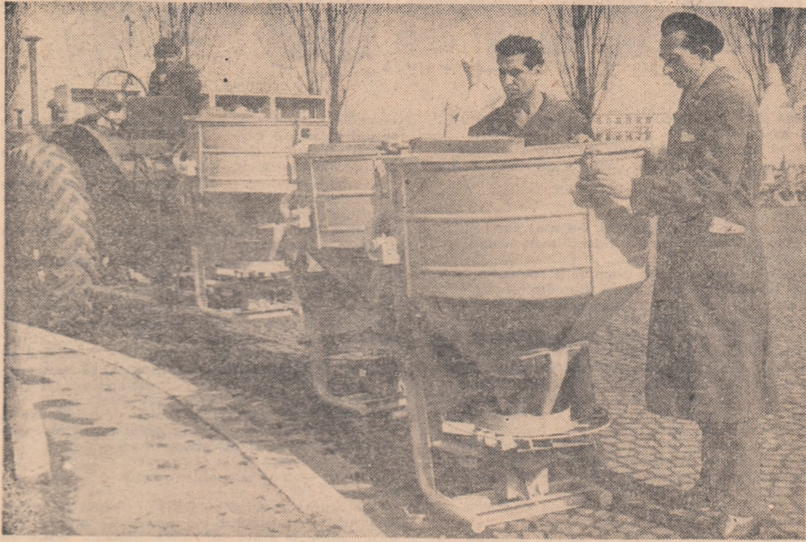
Uzinele „Semănătoarea” din Capitală. Ultima revizie a unui lot de mașini pentru împrăștierea îngrășămintelor chimice.