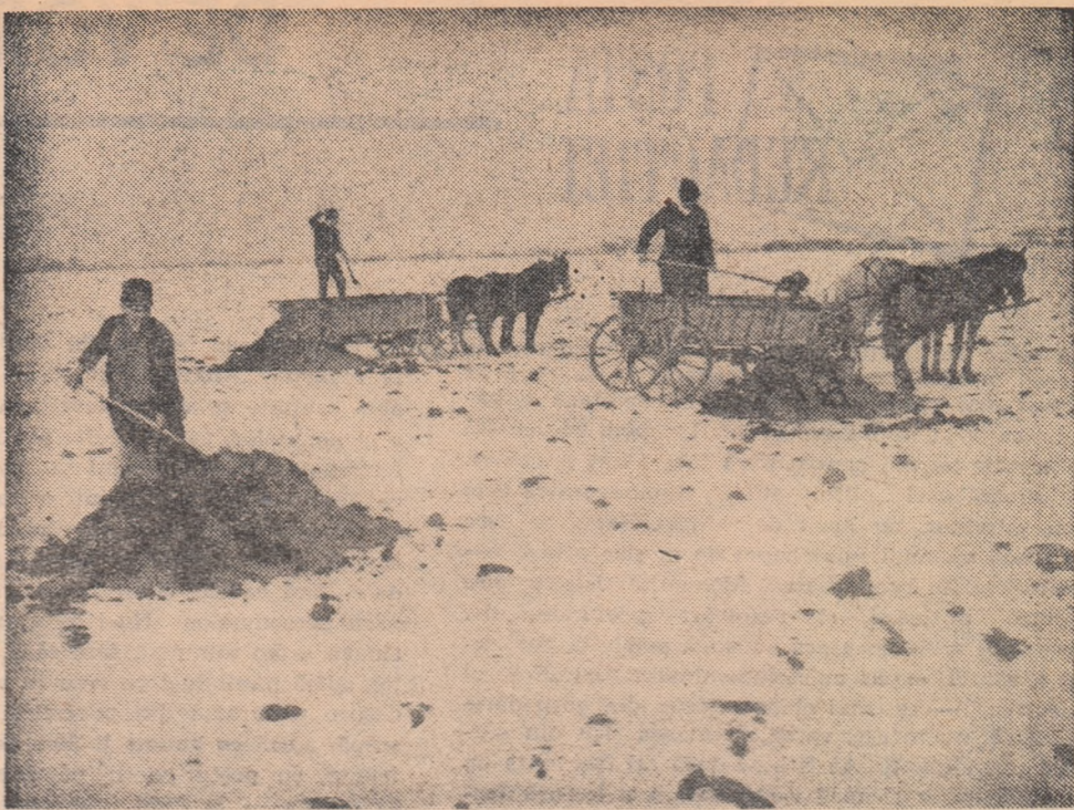
La G.A.C. Romoș, raionul Oraștie, lucrările de transportare și împrăștiere a îngrășămintelor naturale pe cîmp sînt în toi.

Auzit în comuna Bărăști de Vede, regiunea Argeș, de ION SOCOL.