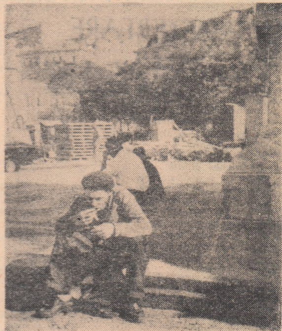
În centrul orașului Lisabona (Portugalia), șomerii așteaptă ivirea vreunei ocazii de lucru.