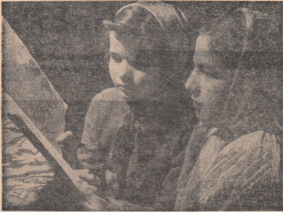
Prietenă noastră, cartea

ca la niște lucruri ascunzind o lume de taine pentru ei vorbeau cu pricepere despre broșurile de specialitate pe care le-au studiat, despre eroii unor romane și povestiri pe care le-au îndrăgit.