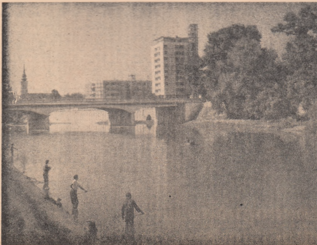
Vedere din Oradea

Viața poetului genial este urmărită, pas cu pas, de la naștere pînă la sfîrșitul tragic. În primele capitole sint înfățișate moșii, părinții, frații și surorile lui Mihai Eminescu, evocîndu-se locurile copilăriei și studiilor, despre activitatea de bibliotecar și ziarist a marelui poet, raporturile lui cu societatea Junimea, lămurirea capitolului evocă iubirile eminesciene din care s-au născut creații nemuritoare devenite cîntece știute pe dinăuntru de milioane de tineri („Pe lângă plopii făcuți Adesea am trecut...” sau „Vezi, rînduindu-se...”), alte ridicare prin simboluri mari generalizări filozofice, ca de exemplu Luceafărul. Biografia se încheie cu un