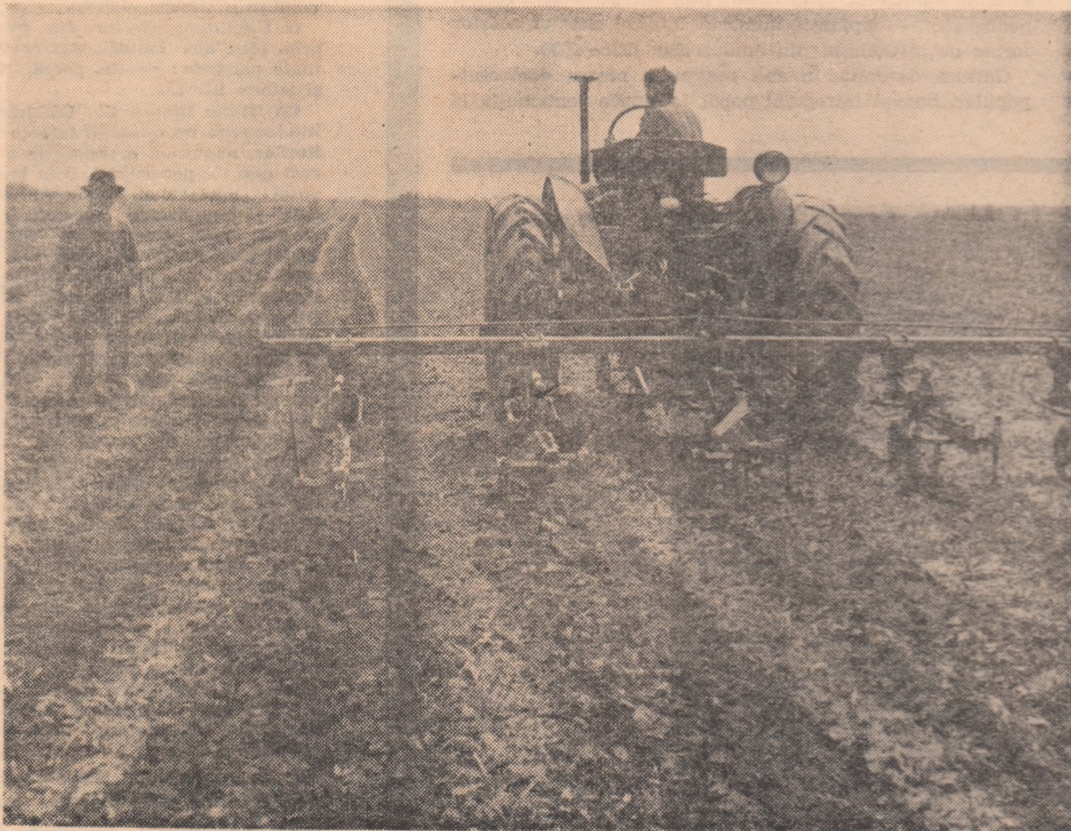
Prășitul mecanic al porumbului, pe ultimele tarlale ale gospodăriei colective din Dragadira, regiunea București