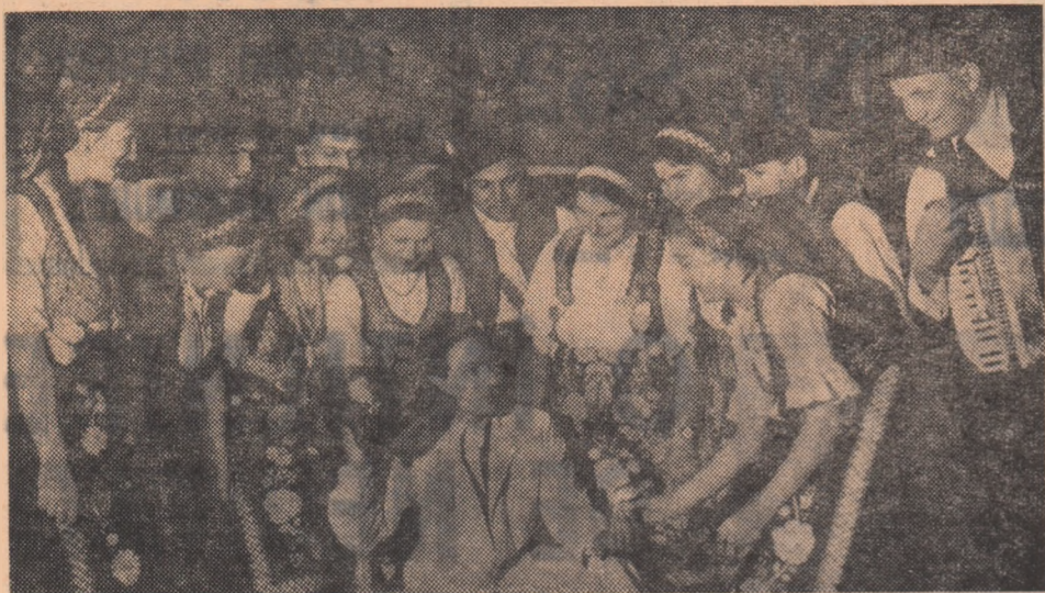
Moment din spectacolul „Muncă bună, voce bună” pregătit de brigada artistică de agitație a Căminului cultural din Cuvin, raionul Lipova.