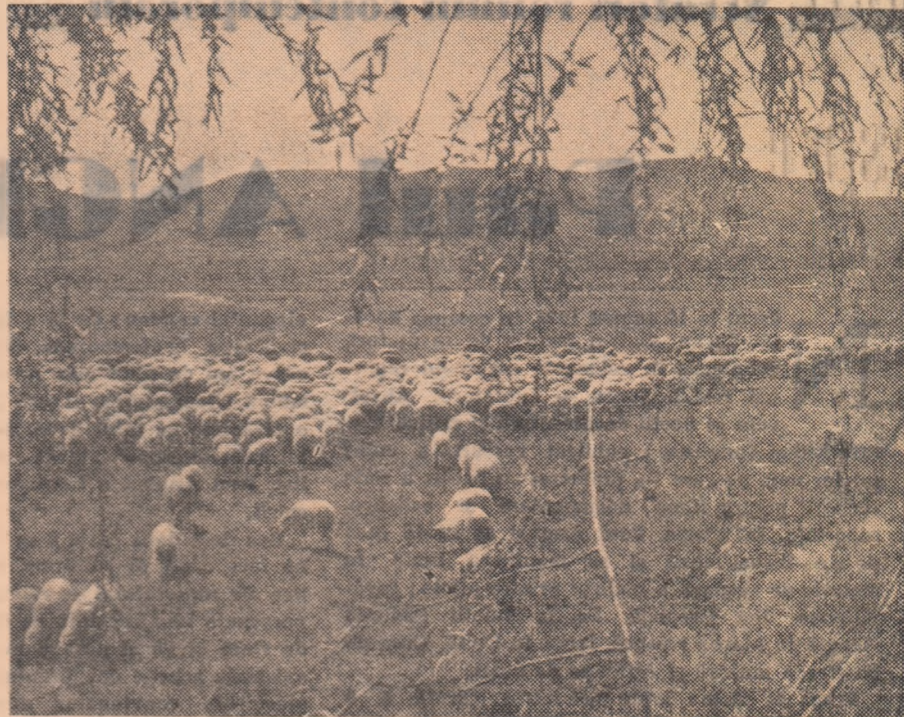
Pășunatul oilor la G.A.C. Radovan, regiunea București.