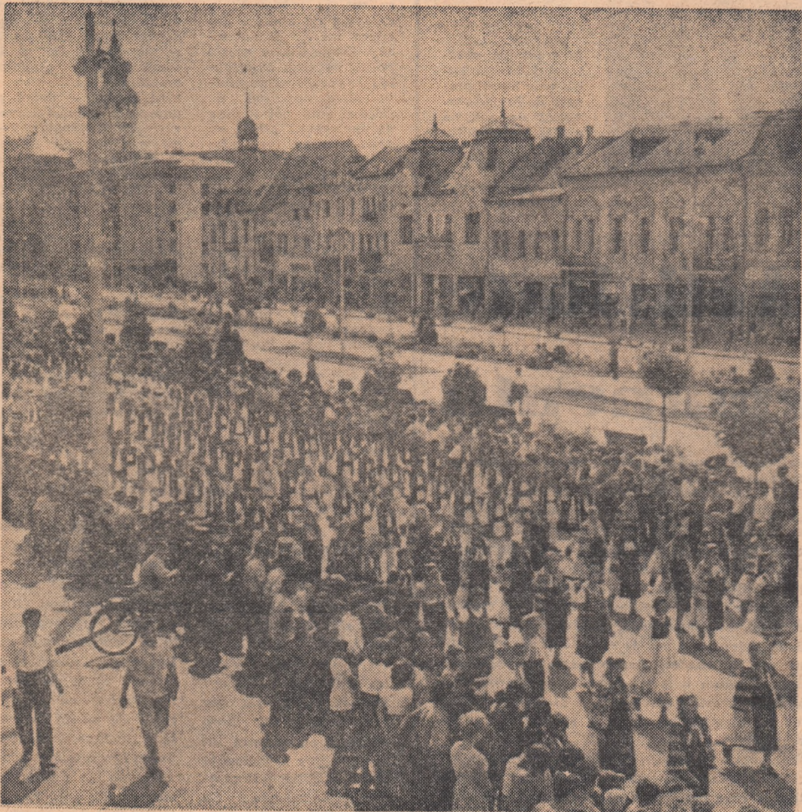
Trec formațiile artistice de amatori ai regiunii Cluj.