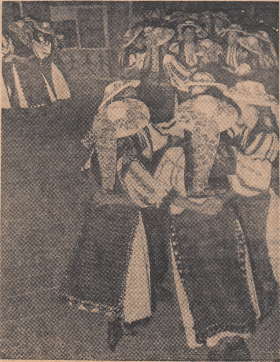
Purtata fetelor din Căpîlna de jos.