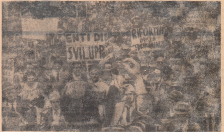
O demonstrație a țaranilor din Toscana (Italia) pentru reforma agrară