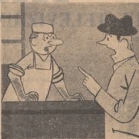
— Ce doriți? — Să vă spălați pe mîini!