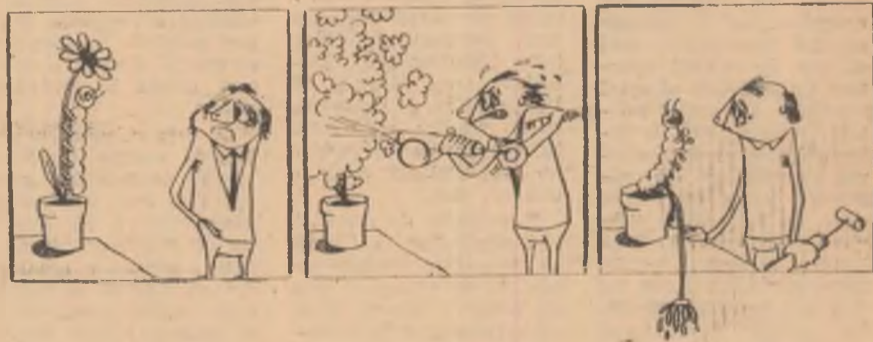
Insecticid „garantat” (Din revista „Eulenspiegel”—R.D.G.)

(de la Expoziția „Desenul satiric în sprijinul educației sanitare”)