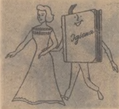
„...Ce bine ne-nțelegem noi doi!”