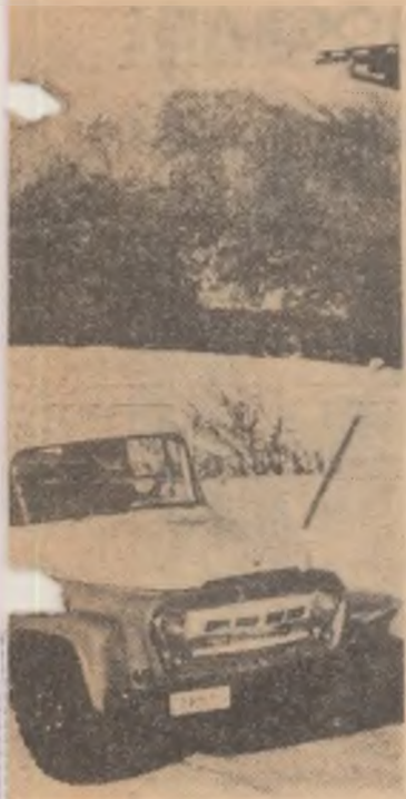
„Fabricat în R.P.R.“