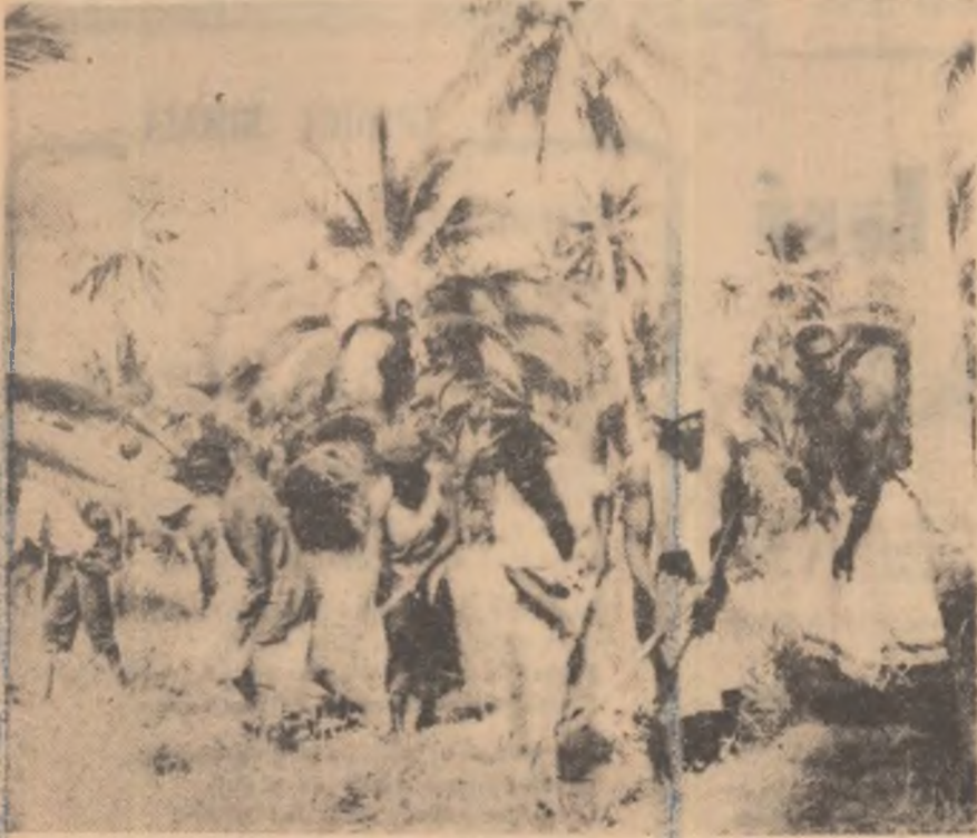
La 30 km spre nord de orașul Zan zibar a fost întemeiată prima cooperativă agricolă din Republica Unită Tanzania. În clișeu, o parte din locuitorii satului Kiduka Nya, în ziua întemeierii cooperativei au pornit la deșelțenirea terenului