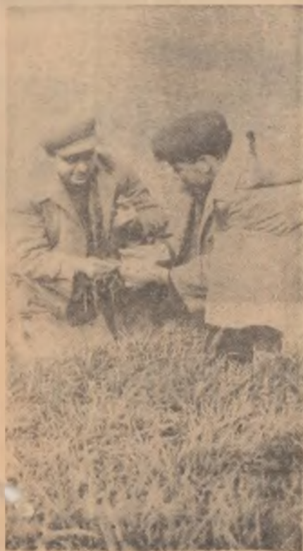
Controlul culturilor de toamnă pe ogoarele cooperativei agricole de producție din Cuza Vodă

— Eu una nu mai am răbdare. Mă duc acolo să văd ce au de gând. Am încurajat-o în ideea asta și într-o zi s-a suit în tren și s-a dus la întreprinderea furnizoare. Cum le-o fi vorbit nu știu, dar a venit o dată cu azbocimentul.