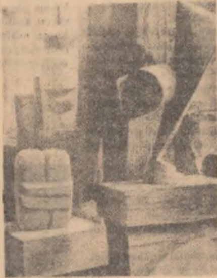
Colț din atelierul de la Paris

Constantin Brăncuși pleca de lângă vatra strămoșească să-și caute de lucru în tîrgul mare, cel mai mare din Oltenia lui — la Craiova. A fost băiat de prăvălie la o circumă de lingă gară. Mai curînd o tavernă. Cu un jupîn hapsîn, cu mîsterii zgomotoși, bătărași. Spiritul de poet al lui Brăncuși, nu-l rătăcea. Se duce să învețe la Școala de Arte și Meserii din Craiova. După absolvire vine la București și se înscrie la Școala de Arte Frumusețe. Școlăritatea academistă și de un tradiționalism pe măsura unei clase care se depărta tot mai mult de popor, nu-l mulțumește. Și se așterne la drum. Spre Paris, unde revoluția burgheză înstăpînise o artă mai revoluționară de