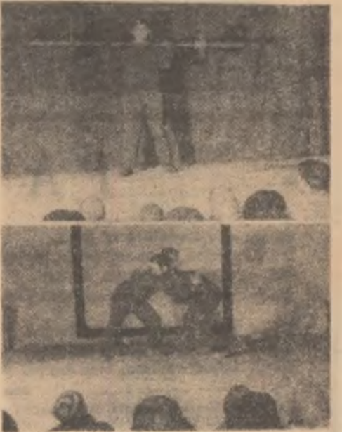
Sport pe scena căminului cultural din comuna Verești raionul Olt. nița