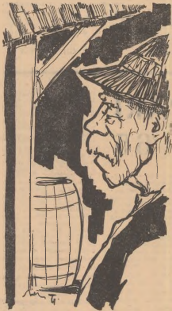
Desen de T. IOANEȘ

A murit bătrînul și au venit feciorii lui să-l îngroape, s-au adunat de prin toate părțile, pentru ultima dată toți acasă, că nu mai aveau la ce să vină. Viața îi răzlețise care pe unde și te mirai că erau chipeși, îmbrăcați frumos în straje negre, femeile și copiii lor la fel, încît îți ziceai că nu greutăți i-au întâmpinat de cînd s-au împrăștiat, numa-n bine și-n dedulce s-au potrivit. Și-ți mai ziceai că mare minune se întîmplase că din ființa aceea strîjită și puțină, culcată într-un coșciug de scindură geluită frumos și vopsită de meșterul satului, răsărise atîta putere de viață cită se strînsese în căsuța bătrînească, îmbîcsită de stăra luminărilor și de mirosul florilor ofilite. Nu încăpeau toți, se perindau pe lingă sicriu, care-cum, după firea fiecăruia, să-l sărute pentru ultima dată pe bătrîn și să-i privească fața imboțită, zbîrcită, încremenită pe veci, pe care puteai citi toate