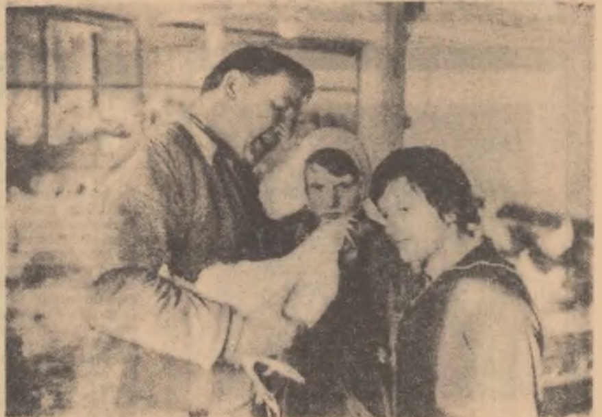
Două tinere din R.D.G., viitoare crescătoare de păsări, în practică la ferma unei cooperative agricole