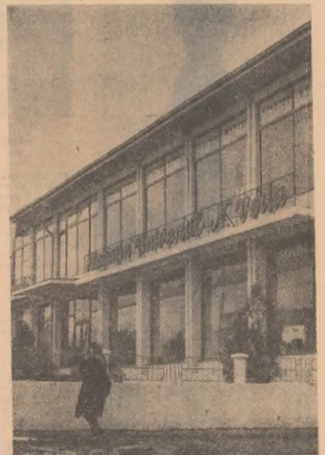
Magazinul universal din Negru Vodă, regiunea Dobrogea