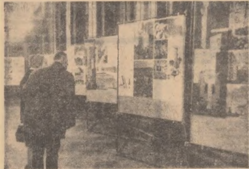
La Paris, în marea sală a Sorbonei, a avut loc expoziția „Imagini din România”