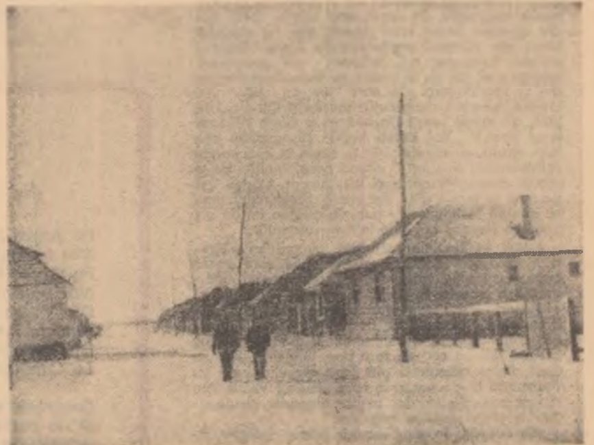
Mărginită numai de case noi, această uliță este una din cele mai tinere din Ghimbav, regiunea Brașov