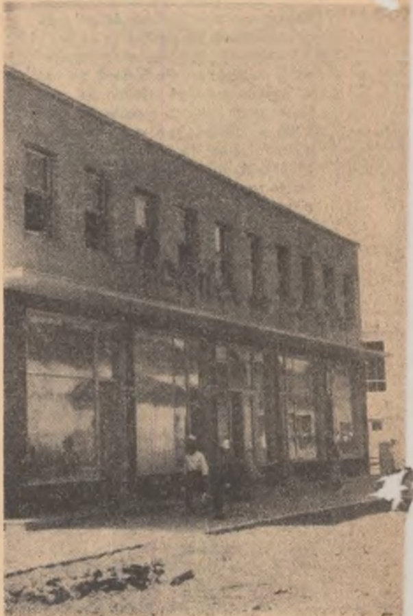
Complexul de deservire populației din Sebiș este un din frumoasele realizări a cooperației de consum din raionul Gurahonț.