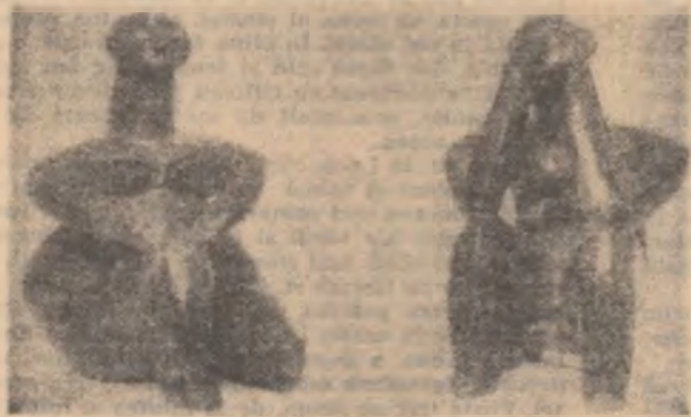
„Perechea de la Cernavoda”

Săpăturile arheologice, efectuate în ultimii ani în țara noastră, au adus date noi nu numai în domeniul modului de producție al comunei primitive, ci și în al vieții spirituale, al artei acelor vremuri. Astfel de descoperiri au fost făcute pe șantierele de la Boian, Cumețnița, Căscioarele, Alba Iulia, Cucuteni, pe șantierele din raionul Rîmnicu Vilcea și altele.