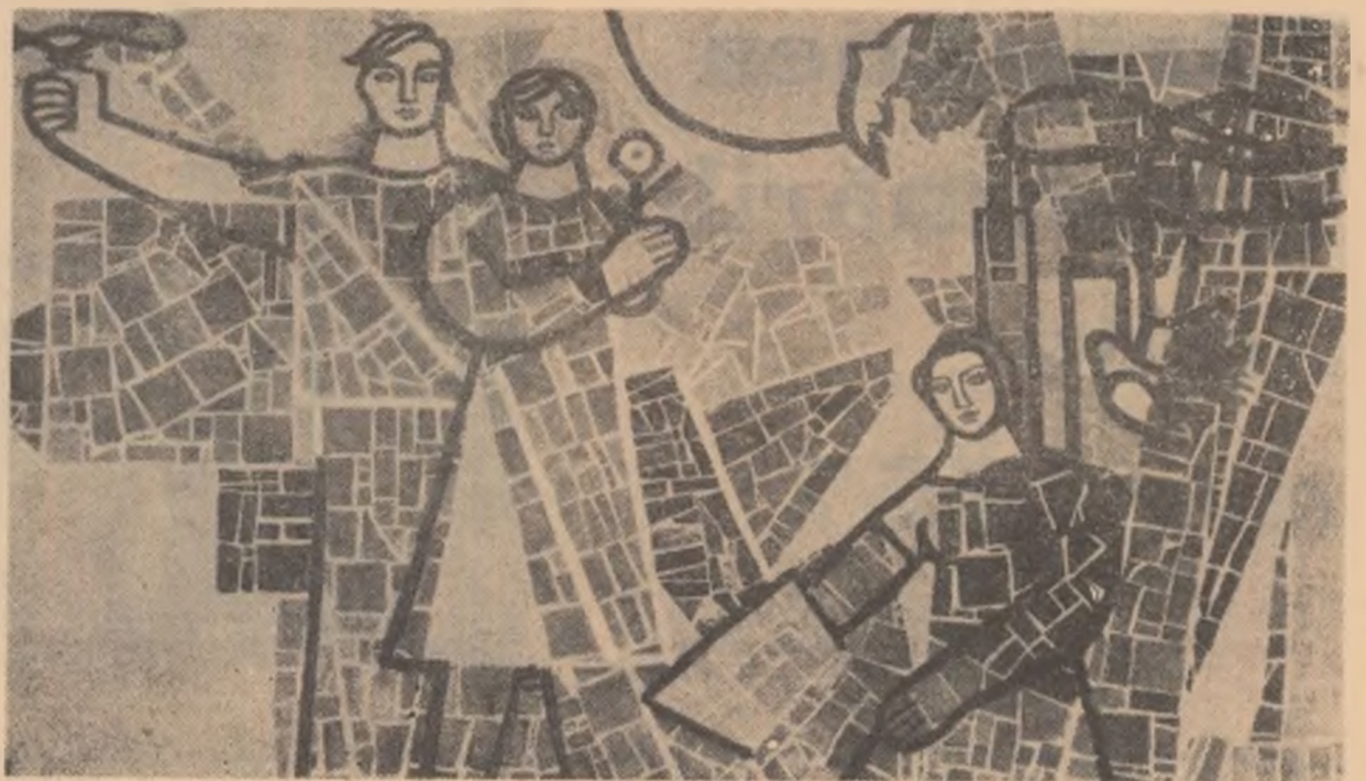
MARIA PLĂCÎNTA: Cultura (plăci de ceramică — restaurantul „Tomis”-Mamaia).