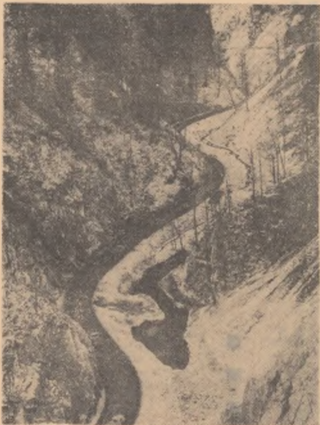
Șoseaua lungă de 5 kilometri, săpată în întregime în stîncă

— E adevărat, viața e aici mai dură, dar încheștarec