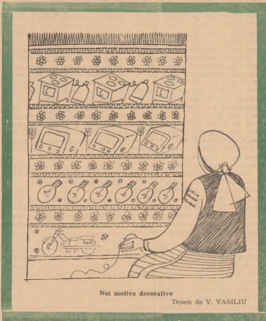
Noi motive decorative

— Săracu, are să-l reformeze!... El crede că e serios... Hei! N-a fost țără toți la război, dom'le!