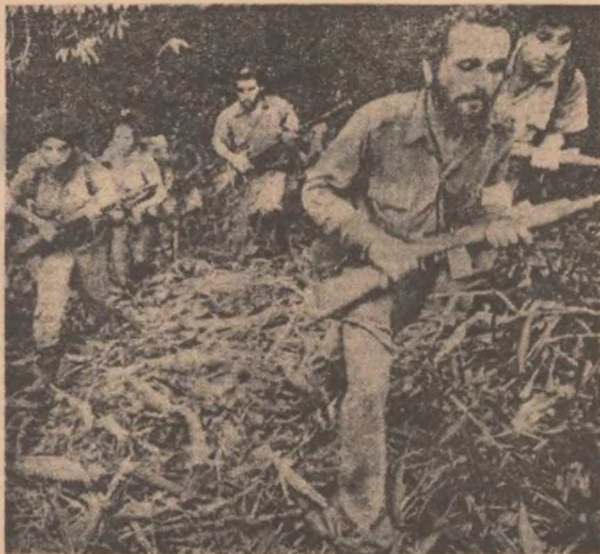
Un detașament de partizani în munții Venezuela