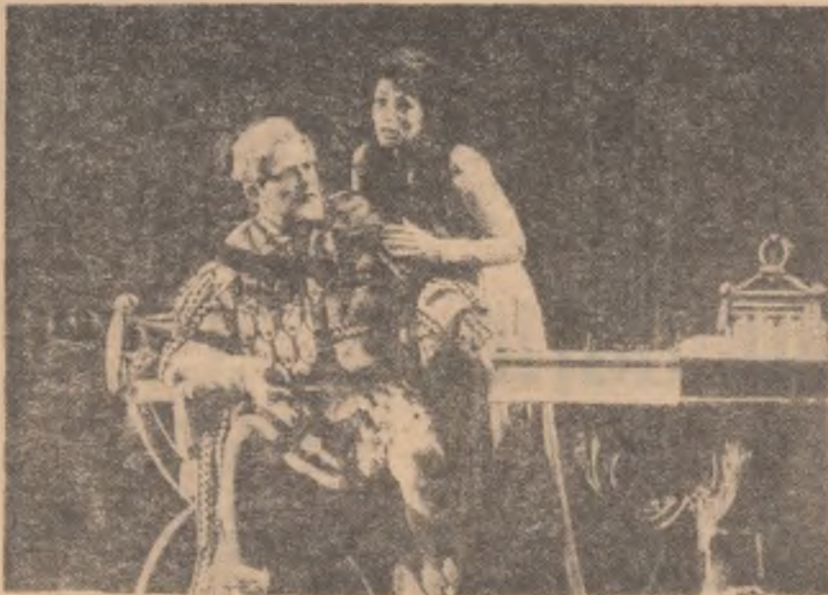
Baritonul Nicolae Herlea pe scena Metropolitan Opera din New-York