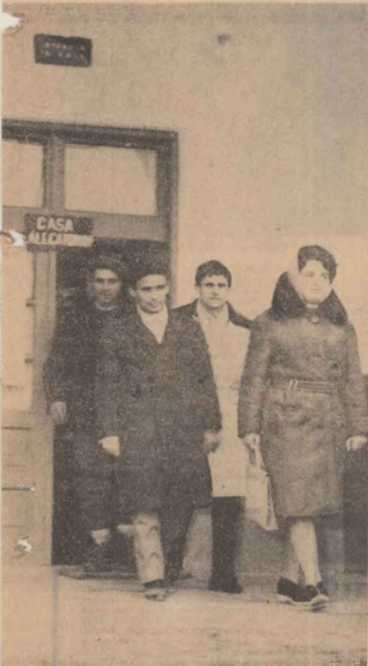
Zilnic Casa alegătorului din Comana, regiunea Dobrogea, este vizitată de numeroși cetățeni atrași aici de o activitate bogată și variată