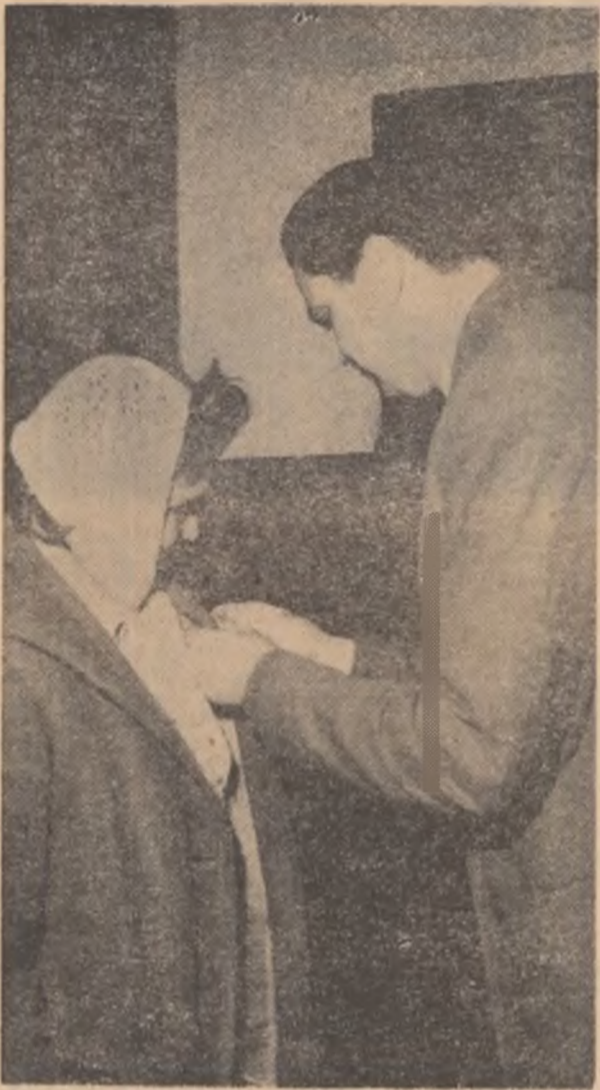
Un moment emoționant: decernarea insignei de „fruntaș în gospodărirea comunei”.

Cînd satelor noastre li se cinstesc pe lingă recoltele bogate și hărnicia muncii lor depuse pe un an întreg, dar și rezultatele unor inițiative care aparțin îndeaproape sufletului omului și frumuseții locului unde trăiesc, evenimentul capătă înțelesuri mai mari. În regiunea București, la o chemare de întrecere pentru înfrumusețarea satelor și comunelor, un an întreg toți gospodarii de pe întinsul regiunii au pornit acțiunea comună ale cărei roade au fost cîntărite și apreciate de curînd.