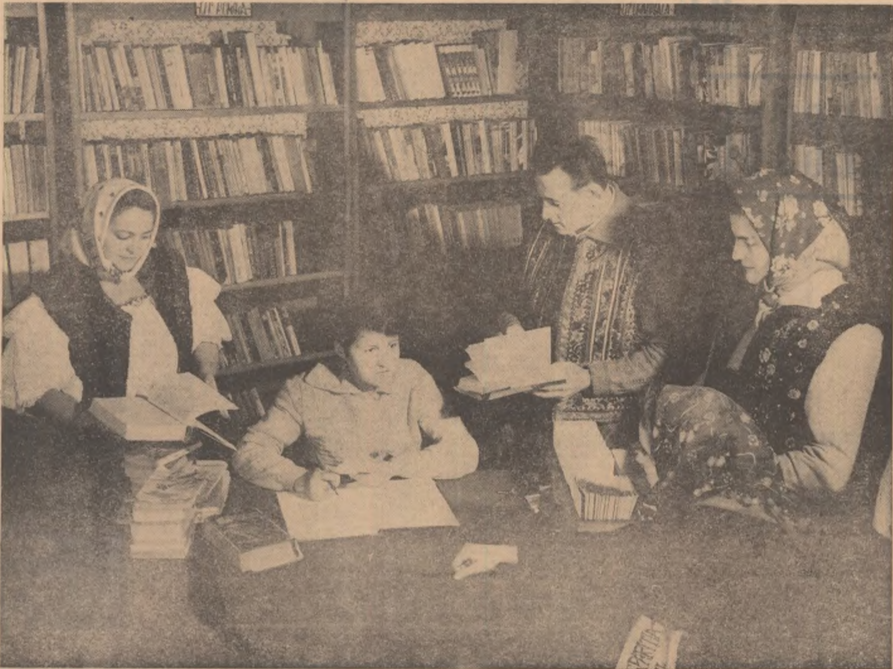
Sala de împrumut a bibliotecii comunale din Vișeu de Jos

Revistă săptăminală a Așezămintelor culturale