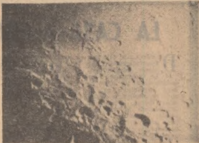
Relieful lunar prezintă un mare număr de munți circulari, mulți dintre ei fiind vulcani vechi și stinși