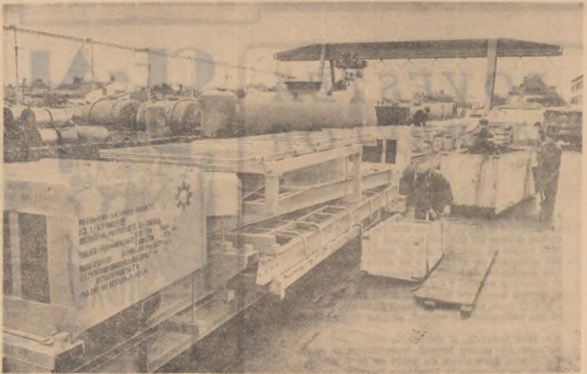
La Uzinele „Vulcan” : utilaje destinate exportului

Relațiile comerciale pe care le avem cu peste 100 de țări, creșterea complexității economiei noastre naționale și diversificarea producției, ridicarea nivelului tehnic și calitativ al acesteia, creează posibilități sporite pentru lărgirea comerțului exterior. Dacă adăugăm la aceasta faptul că din exportul țării produsele industriale reprezintă azi circa patru cincimi ne dăm seama de avântul în industria noastră socialistă.