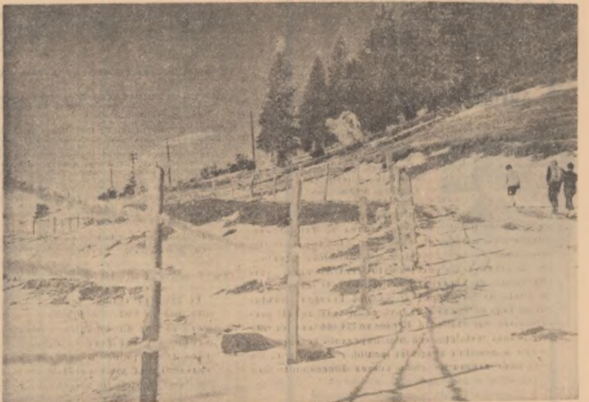
Spre Cabana Vinătorilor din munții Bucegi.