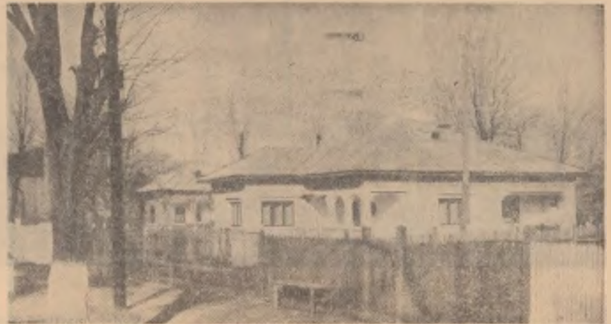
Cartier de case noi ale cooperativelor agricole din comuna Rominești-Ploiești.