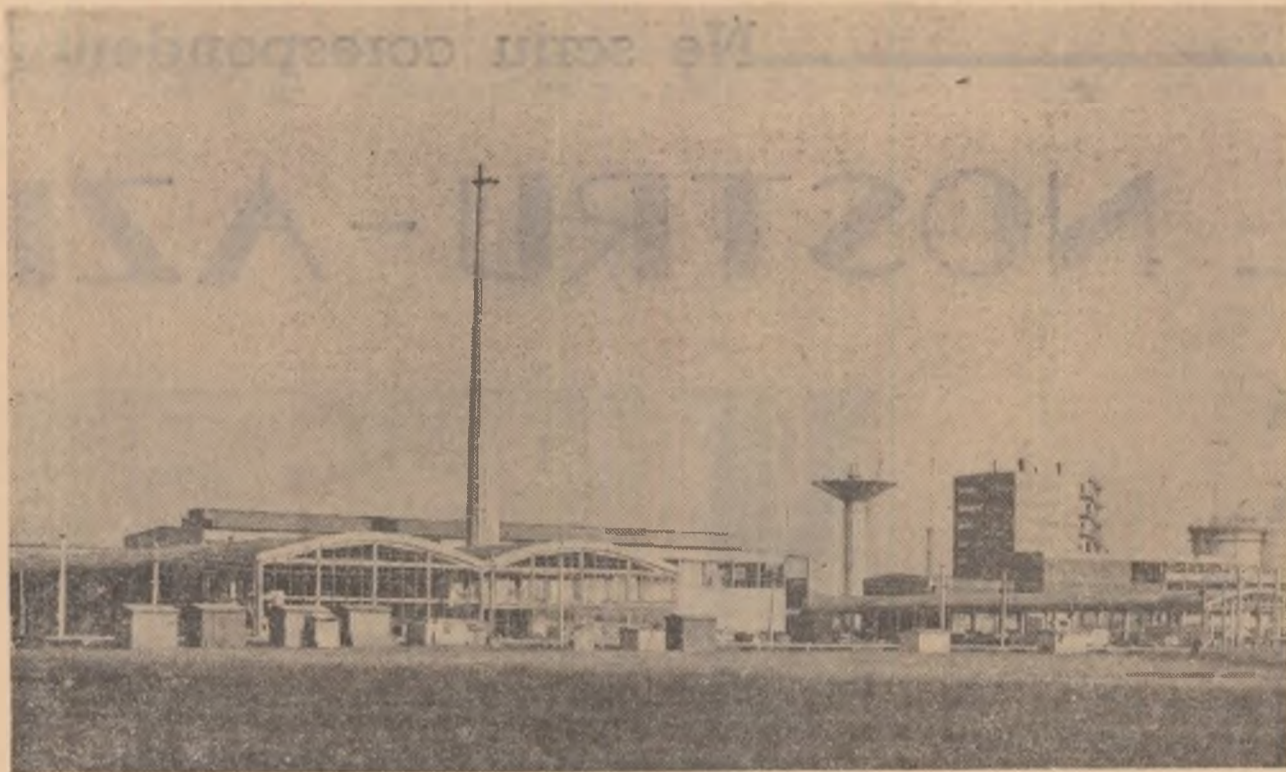
Vedere parțială a uzinei de aluminiu din Slatina-Argeș.