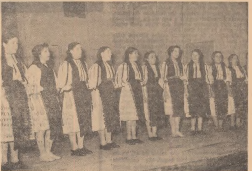
Moment dintr-unul din programele brigăzii artistice de agitație a căminului cultural din Daia Romînă, raionul Sebeș

Ar fi deosebit de util ca textierii și instructorii de brigăzi să aibă posibilitatea de a viziona cele mai bune spectacole prezentate de brigăzile fruntașe pe țară. Oare nu ar putea studioul de filme documentare să realizeze niște scurt-metraje cu programul integral al unor brigăzi artistice valoroase? Aceste filme ar prilejui prețioase schimburi de experiență, căpătînd o largă circulație prin proiectarea lor atât cu prilejul seminariilor raionale cît și la căminele culturale. Ar fi pentru noi un real ajutor în îmbogățirea culturii de specialitate și ne-ar da posibilitatea ca — fără a copia — să îmbunătățim nivelul calitativ al programelor de brigadă.