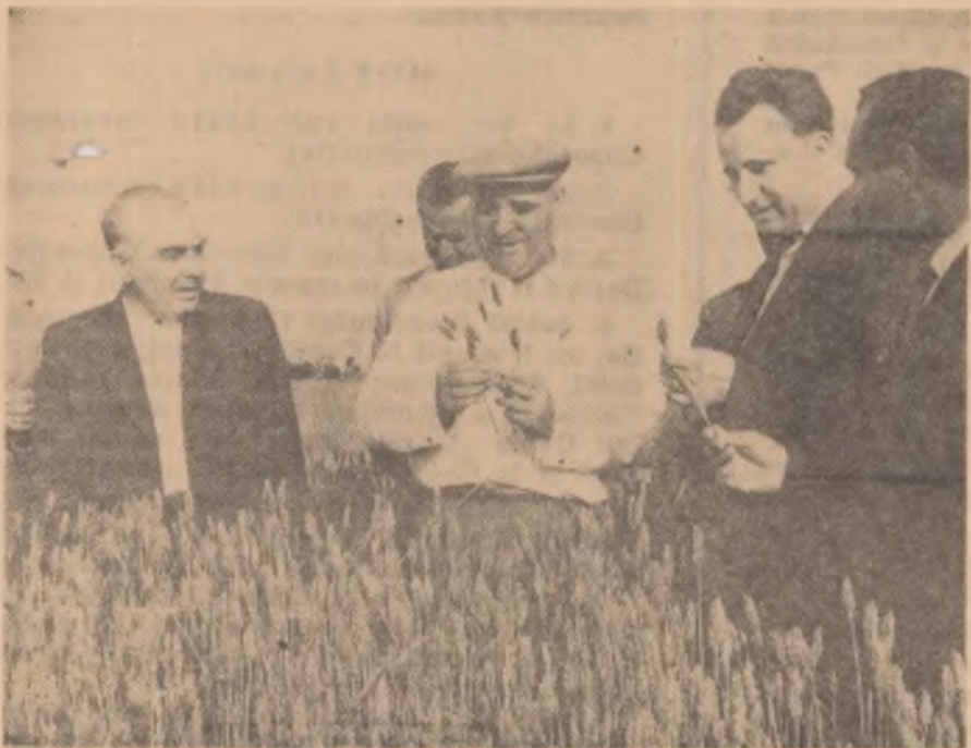
În vizită la G.A.S. Grabăț-Banat