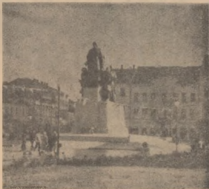
Monumentul «Ostașului Romîn» din Arad, de sculptorul Gavril Covalschi.