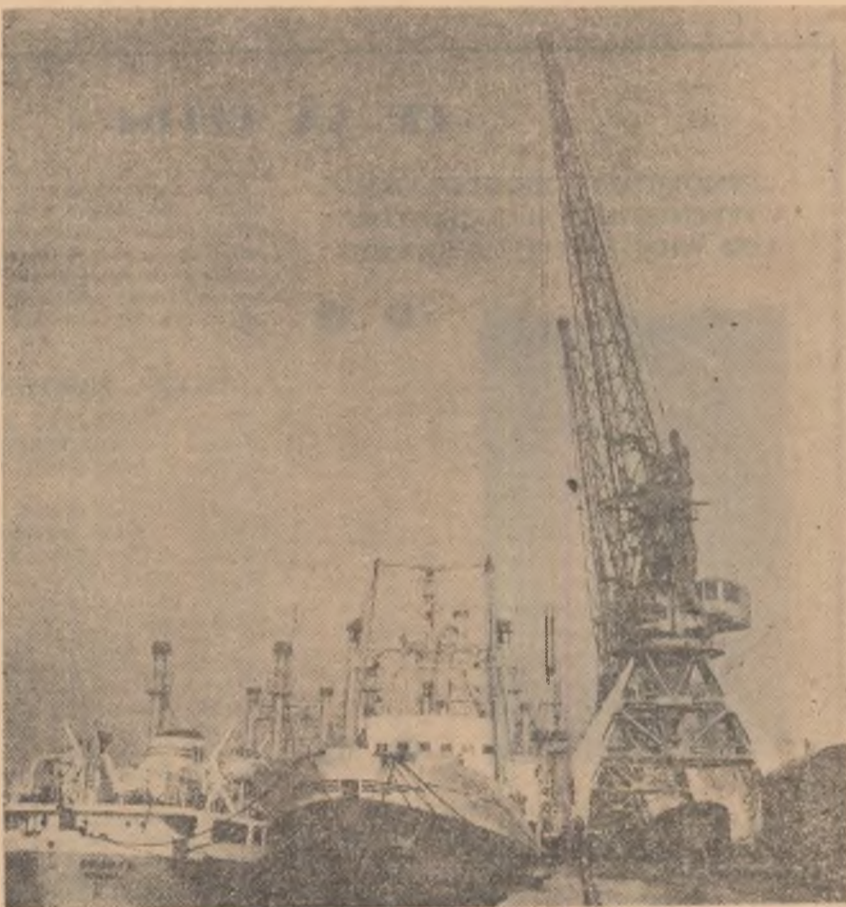
Vedere din portul Constanța