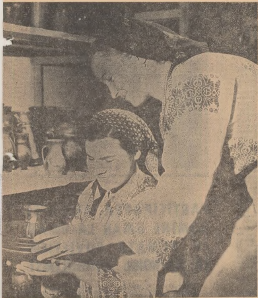
Produsele de ceramică neagră ale cooperativei meșteșugărești „Libertatea” din Marginea-Rădăuți se bucură de apreciere în toată țara. Iată un nou lot la ultimul control înainte de expediție.