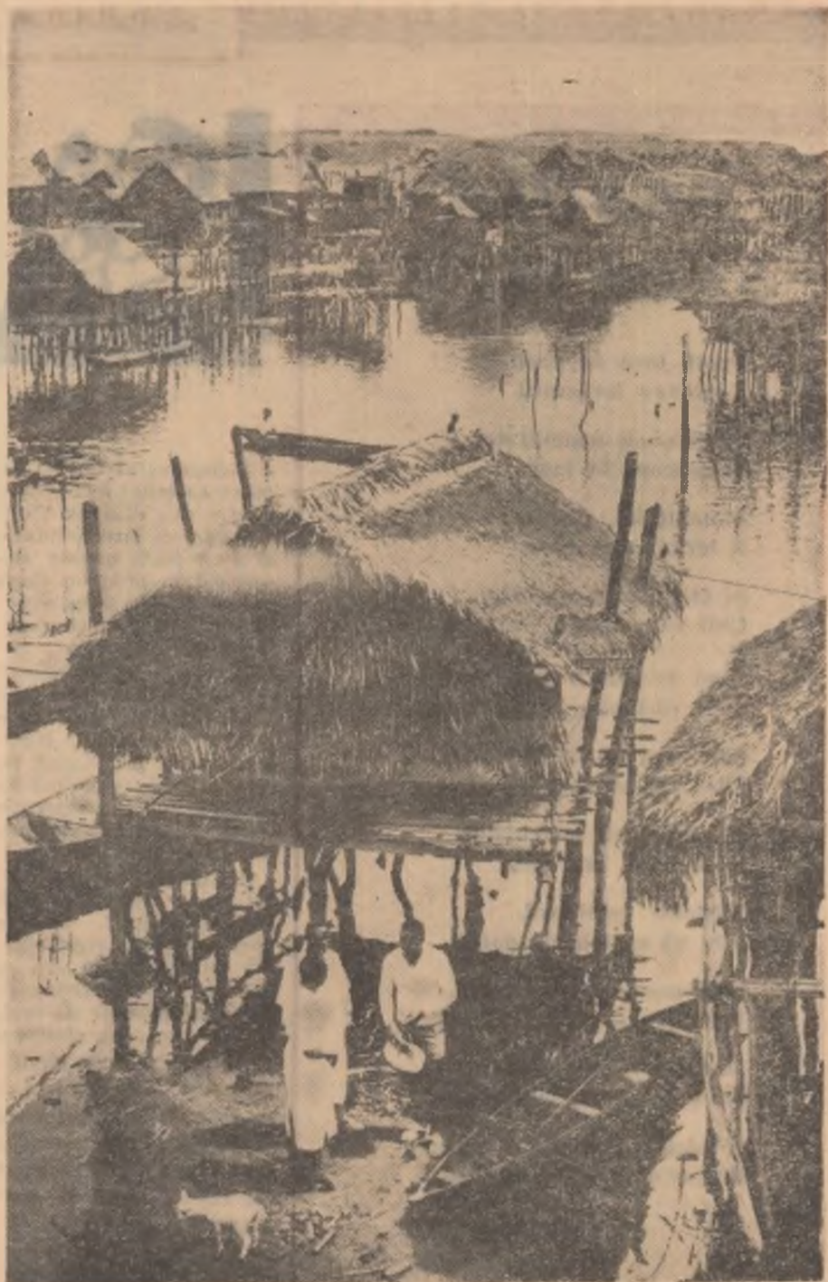
Personal medical din Porto-Novo în vizită la pescarii din Ganve.