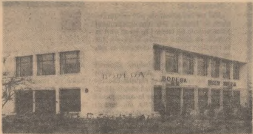
Așa arată noul complex comercial.

tatea membrilor săi sînt rezultate ale muncii unite ale cooperativistilor. Aceasta explică desigur și exigența pe care au arătat-o față de referatul expus de președinte, care a scăpat din vedere unele aspecte formulate apoi de către vorbitori cu o ascuțime critică demnă de relevat.