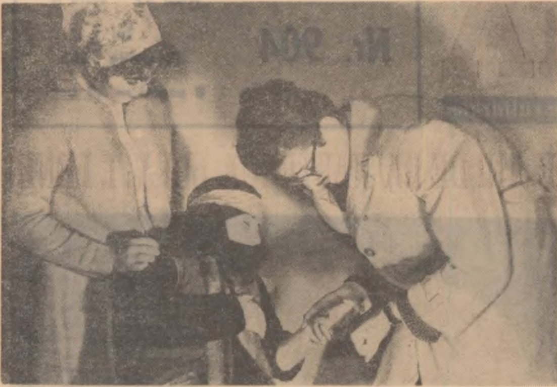
Artiștii amatori ai căminului cultural din Căteasca-Argeș se pregătesc pentru cel de-al IV-lea Festival bienal de teatru „I. L. Caragiale”. Pe scenă, un grup de interpreți la repetiție.