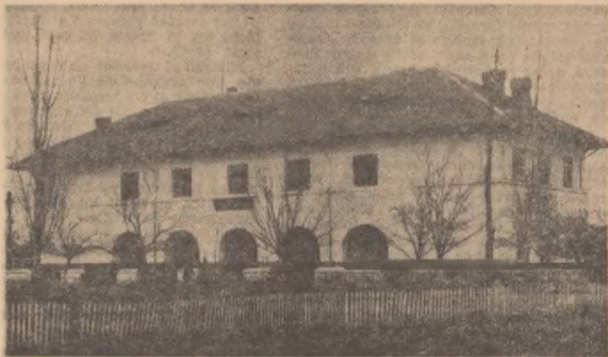
Clădirea administrativă din comuna Dragalina.