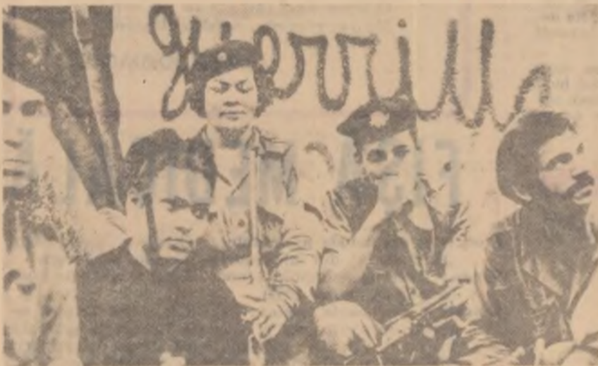
Mișcarea de partizani împotriva regimurilor dictatoriale, pentru largi reforme democratice a luat un avînt deosebit în întreaga Americă Latină. Unitățile de partizani din Venezuela de pildă, acționează intens în statul Falcon, în regiunea munților Sierra de Carro și alte regiuni. Țărăni, deși sînt în permanență hărțuiți, percheziționați și jefuiți de produsele lor, deși mulți dintre ei au fost arestați și schingiuți, sprijină din toată inima lupta partizanilor. În clișeu: partizani în munții Venezuelei.

21.00 Festivalul filmului românesc — Mamafa 1965. 22.00 Retrospectivă umoristică. Emisiunea a VII-a cu... Alexandru Lulescu și Nicu Constantin.