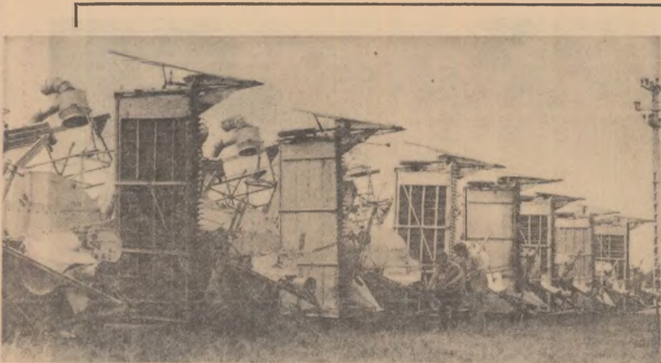
La sedlul brigăzii a 9-a a S.M.T. Lehliu, combinele sînt gata de recoltare.