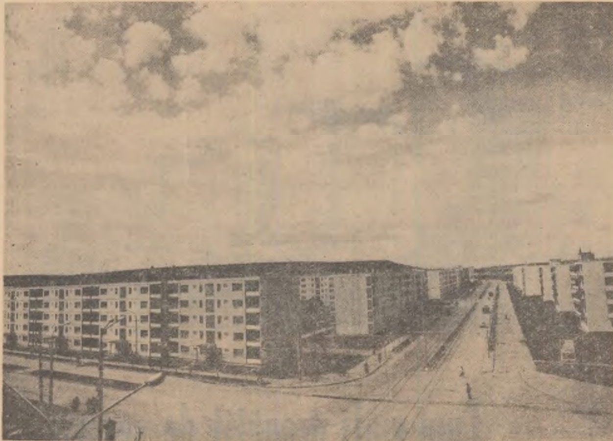
Fața nouă a bătrînului Iași.