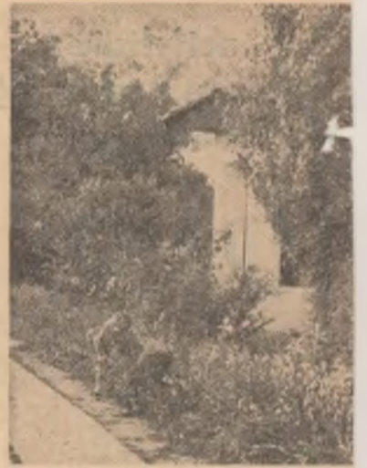
Deși în vacanță, copiii torului Vasile Stă-

supra cărții la căderea nopții. Ne vin în minte cuvintele lui Mihail Sadoveanu care, evocîndu-și anii de tinerețe ieșană, nota, la scara realităților de atunci, imaginea plină de farmec a „învățăcelilor”, imagine care astăzi e mult amplificată, cu vaste reverberații în viața acestui oraș cu strălucite tradiții. „Epoca intrării mele la Academia Mihăileană — toamna anului 1897 — o pot socoti ca una dintre cele mai ferice ale tinereții mele. Veneam de la un mic gimnaziu, dintr-un orașel provincial de la iazuri și hugeacuri... și intram dintr-o dată într-o fierbere pe care nu preget nici o clipă s-o numesc intelectuală... Convorbirile animate, la care am participat din primul moment, erau în legătură cu literatura și cu problemele sociale. O însuflețire generoasă aduna neconștient acele inimi tinere la discuțiile interminabile... Din prima clipă am găsit ce să citesc și am și început a citi cu ardore... N-am citit niciodată așa de mult, așa de încordat ca în acei ani ai liceului. Cea mai mare parte dintre elevi citea cu aceeași pasiune... La ieșirea de după-amiază a claselor superioare, cred că orice străin ar fi fost impre-