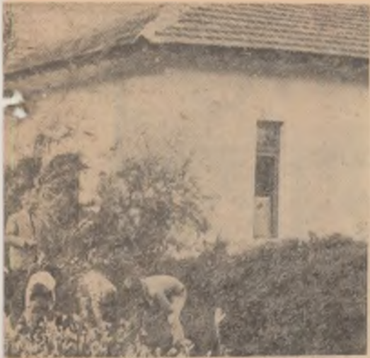
ti-Giurgiu sub supravegherea atentă a învățăgrijese rondurile cu flori din curtea școlii.