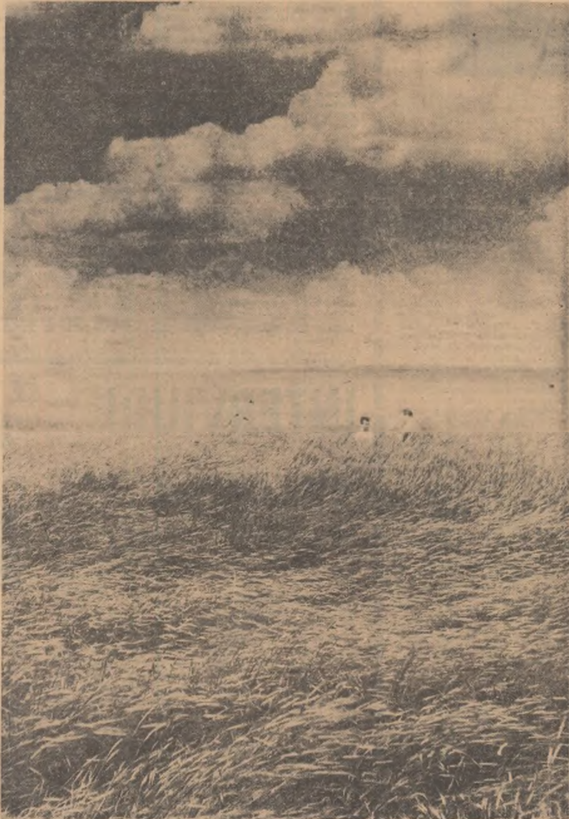
Marea de griu a Bărăganului unduiește în bătaia vîntului.