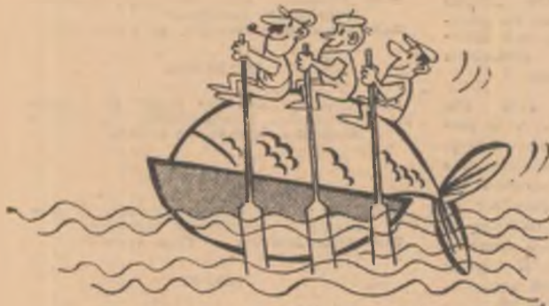
Intoarcerea de la pescuit... Desen de Nic. NICOLAESCU

Brigada piscicolă a C.A.P. Năvodari, reg. Dobrogea, își depășește în fiecare lună planul de pescuit.