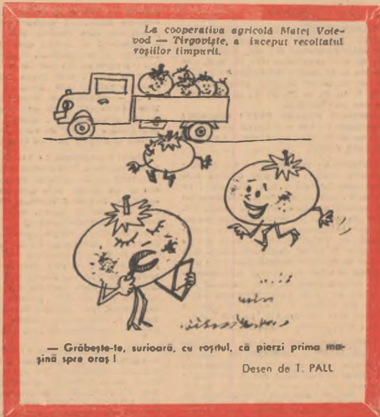
La cooperativa agricolă Matei Vodă — Tîrgoviște, a început recoltatul roșiilor timpuri.