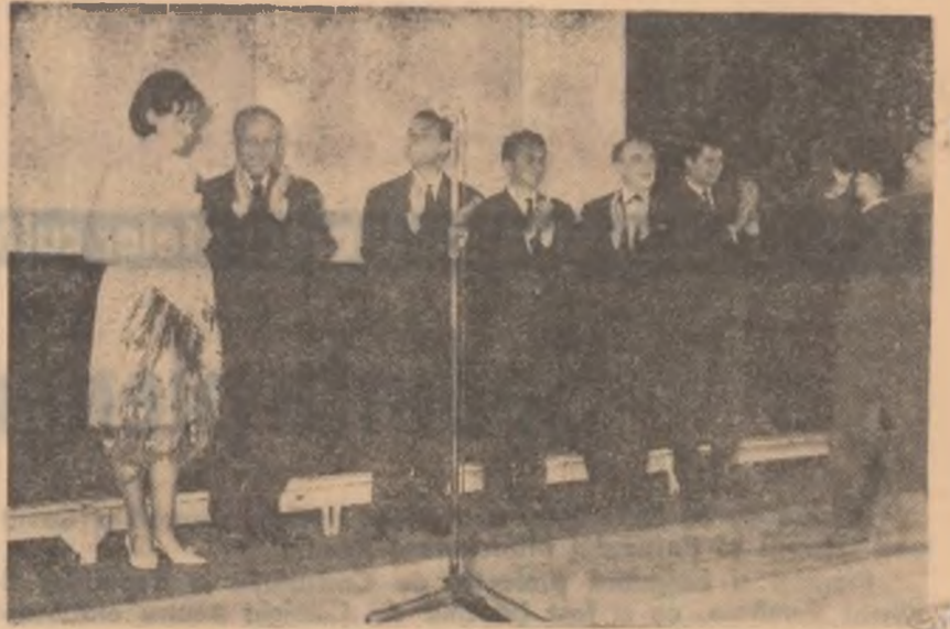
Realizatorii filmului Gaudeamus igitur pe scena teatrului din Mamaia