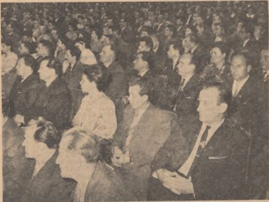
În timpul lucrărilor celui de-al IX-lea Congres al P.C.R.

(Din Raportul C.C. al P.C.R. prezentat de tovarășul Nicolae Ceaușescu cu privire la activitatea partidului în perioada dintre Congresul al VIII-lea și Congresul al IX-lea al P.C.R.).