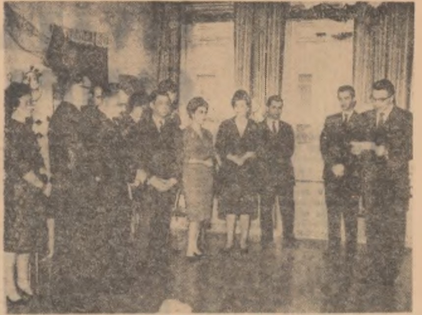
În orașul finlandez Jyväskylä, important centru industrial și universitar, au avut loc, nu de mult, numeroase manifestări românești, printre care se numără și expoziția „România în plin progres”. În fotografie: primarul orașului Jyväskylä (primul din dreapta) rostind discursul de deschidere în prezența ambasadorului român la Helsinki.

„Noi cumpărăm din România numeroase produse alimentare — compoturi, siropuri de fructe, gemuri, conserve și alte măruri. Țin să subliniez că aceste produse sînt foarte apreciate în comerțul japonez... Produsele industriei dumneavoastră alimentară sînt de calitate excelentă. După părerea mea, nivelul tehnic al industriei românești de conserve este foarte ridicat, România punînd judicios în valoare bogățiile sale naturale atît sub raport tehnic cît și calitativ. Țin să subliniez că industria românească în general și industria chimică în particular au înregistrat succese remarcabile de unde posibilitatea pentru România de a face un comerț larg cu toate țările lumii“.