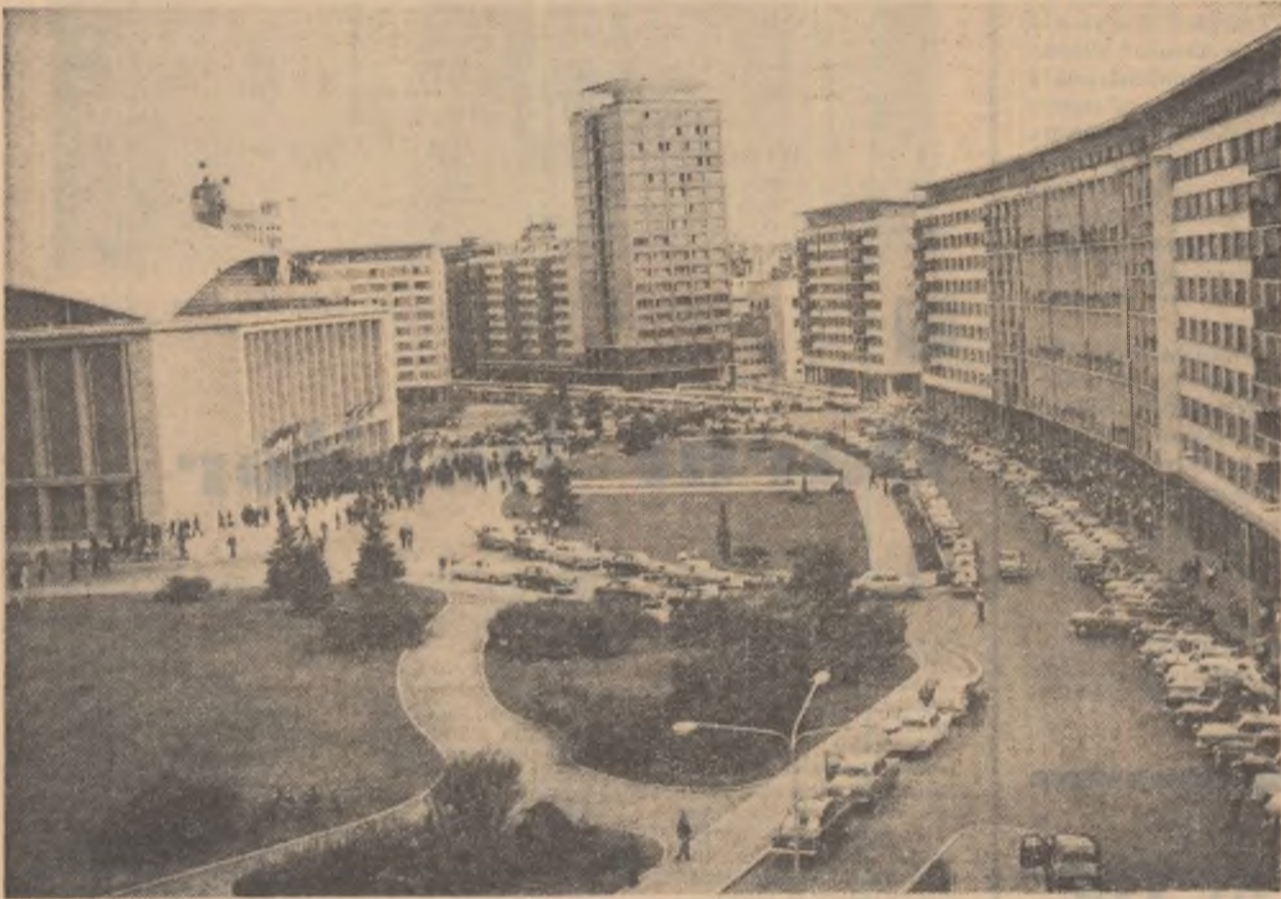
Atmosferă sărbătorească în fața sălii Congresului în aceste zile.

și industria. Cel mai mic lucru, care s-ar fi putut face foarte ușor în țară, trebuia să-l aducem din străinătate, plătindu-l cu bani grei. De ce? Pentru că o industrie larg dezvoltată cerea un proletariat numeros, conștient de drepturile lui și deci, primejdios pentru regimul oligarhic de atunci. Muncitorimea și țărâna trebuiau ținute în cea mai cruntă mizerie și prigoană. Partidul Comunist era scos în afara legii. La o populație de 18 milioane de locuitori, aveam 4 milioane de analfabeți, într-o țară în care — sinistruă ironie — învățămîntul primar era, pe hirtie, „obligatoriu și gratuit”.