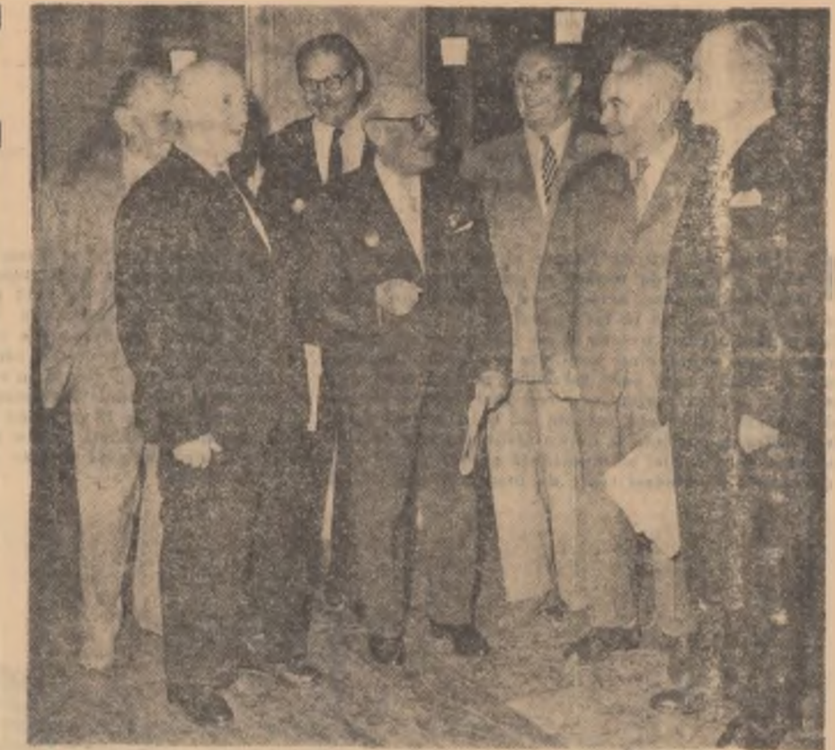
Un grup de delegați, participanți și la primul Congres al P.C.R. din 1921.

Oțelarii din ultimul schimb realizaseră, cu 24 de ore înainte începerii lucrărilor Congresului, planul pe primele 7 luni ale anului, dînd în plus și 35 de tone de oțel lichid. O zi mai tîrziu, schimbul întâi luase, încă de dimineață, hotărîrea să dea peste plan cu două tone piese de oțel mai mult. La terminarea programului angajamentul era îndeplinit. Raportau cu emoție această îndeplinire