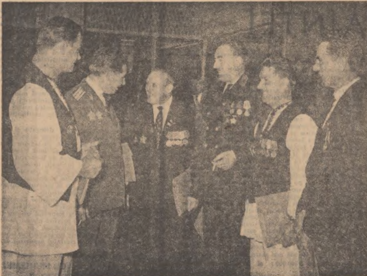
Delegați la Congres într-una din pauze.

Sinteză și totodată analiză de o mare profunzime, Raportul de activitate al Comitetului Central prezentat de tovarășul Nicolae Ceaușescu impresionează puternic prin justețea aprecierilor și însemnătatea problemelor supuse dezbaterii.