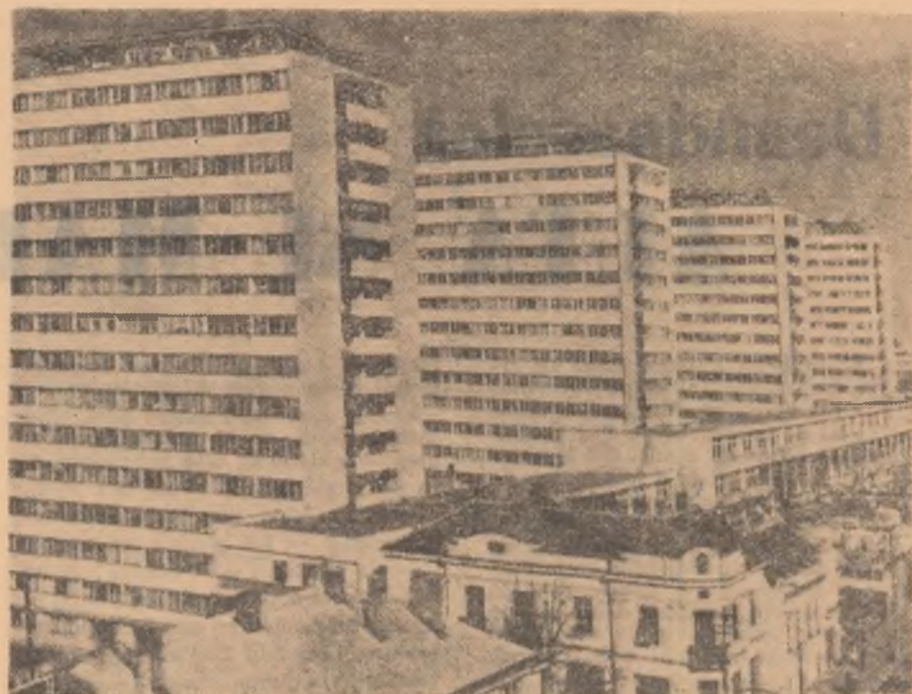
Blocuri noi de locuințe recent construite la Belgrad.

Și presa americană a relatat în aceste zile despre încheierea lucrărilor Congresului al IX-lea al P.C.R. și alegerea organelor conducătoare ale partidului. Sub semnătura corresponsului său special la București, ziarul New York Times publică o trimisundă în care anunță componența Comitetului Executiv și a Prezidiului Permanent al Comitetului Central. Sînt redată pasaje din cuvîntarea de încheiere a Congresului rostită de tovarășul Nicolae Ceaușescu.