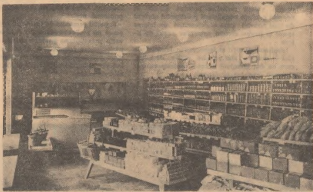
Magazinul alimentar cu autoservire din Smeeni. Interior.

Aci în cîmpia mănoasă a Dunării ca și pe meleagurile legendarei Moldove, în patria Anei Lugojana și pînă departe unde Carpații își arată fruntea de piatră, inima țării vibrează puternic. Ea trăiește cu adevărat momentele emoționante ale evenimentului istoric. În marea sală a Palatului Republicii a răsunat în aceste zile însuși glasul partidului nostru drag care a fost ascultat cu nețărmurită încredere și dragoste de întregul popor.