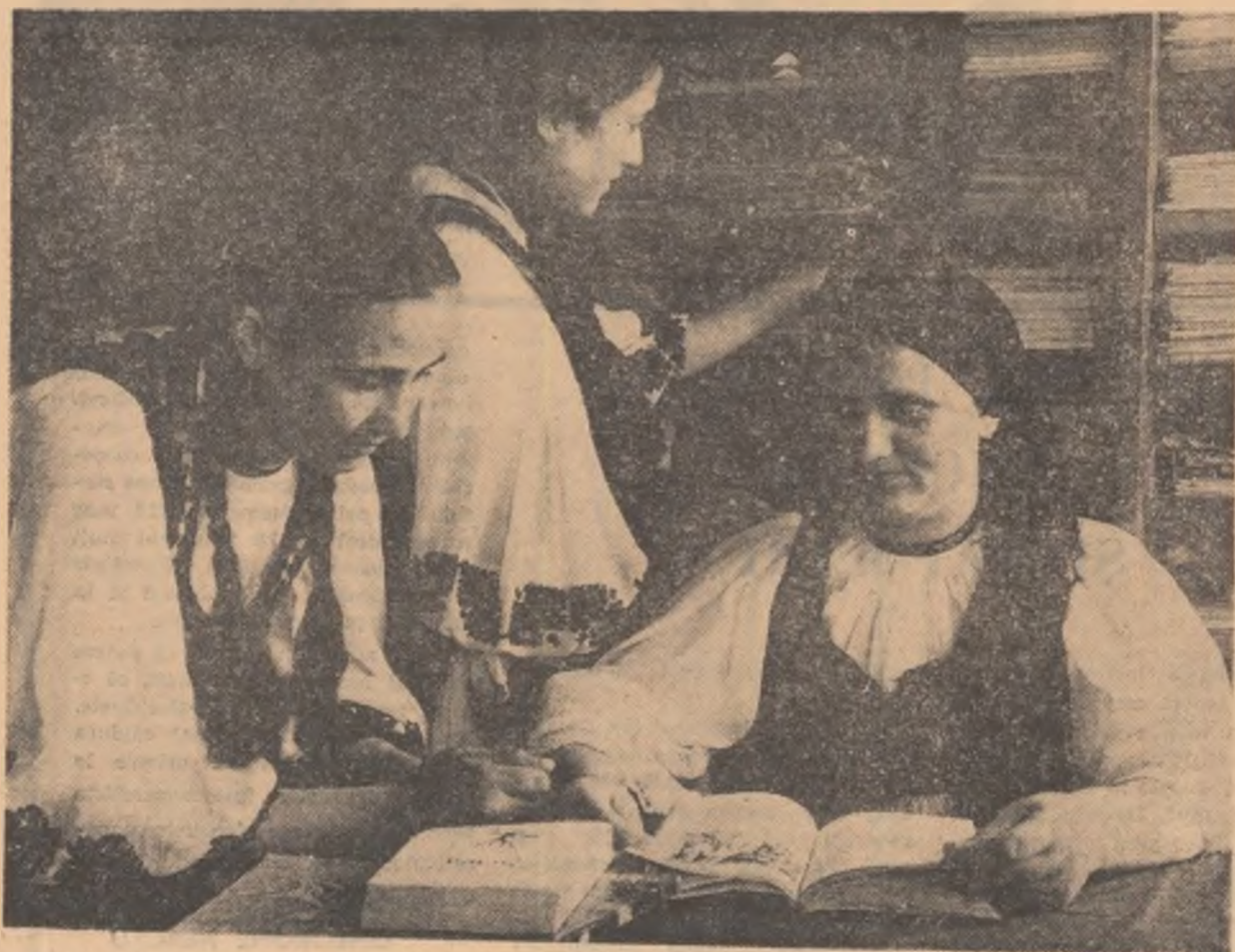
În sala de lectură a bibliotecii comunale din Lupșa, regiunea Cluj, un grup de tinere cititoare consultă ultimele volume recent sosit în bibliotecă