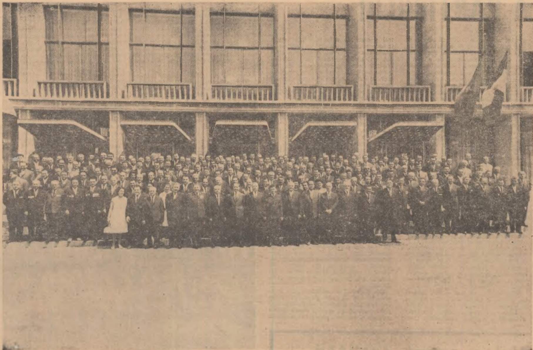
Comitetul Central al Partidului Comunist Român