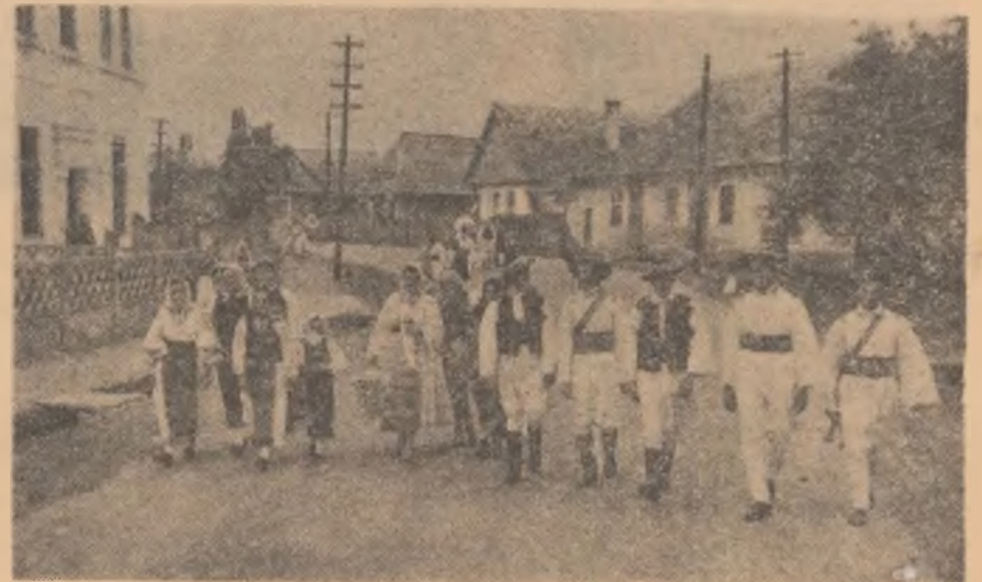
Zi de duminică în comuna Salva-Năsăud