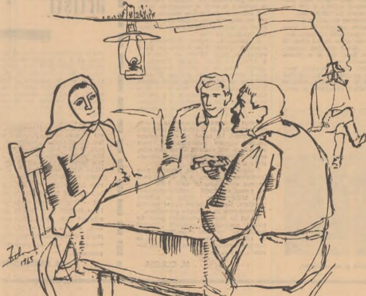
Desen de GH. ADOC

— Ia vorbește, mă băiete, cu Jâni Andraș ăla, să ne facă rost de nițel combustibil.