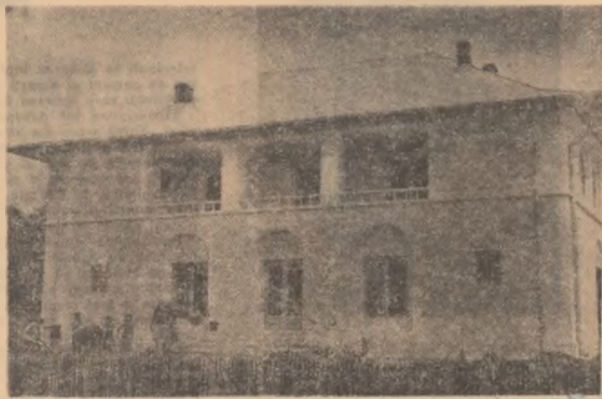
Noul cămin cultural din Gageșari, raionul Giargia, dat de curînd în folosință

Publicăm în pagina de față cîteva din scrisorile sosite în ultima vreme la redacție.