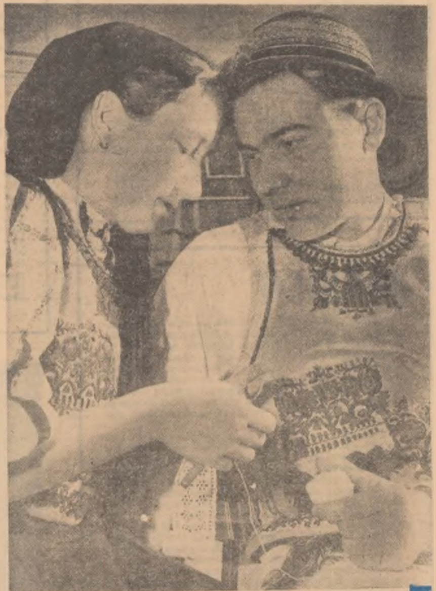
Dragostea... bat-o vina!