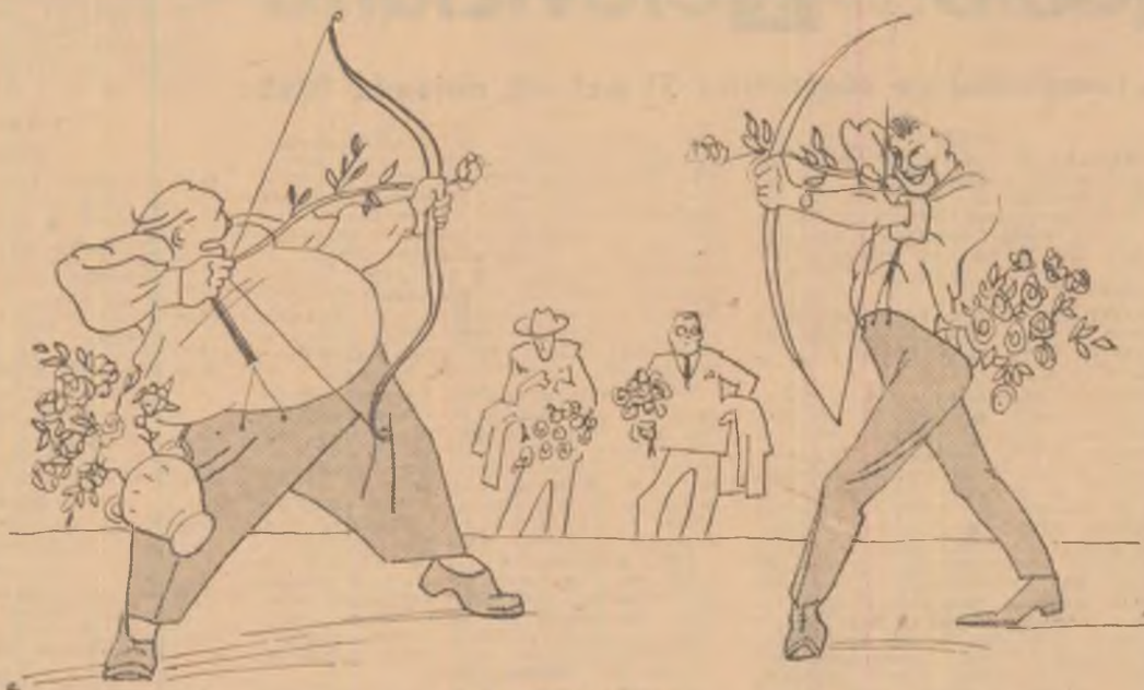
Duelul criticilor (Desen de A. KRILOV — U.R.S.S.)