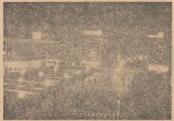
Peisaj de noapte : centrul orașului Galați