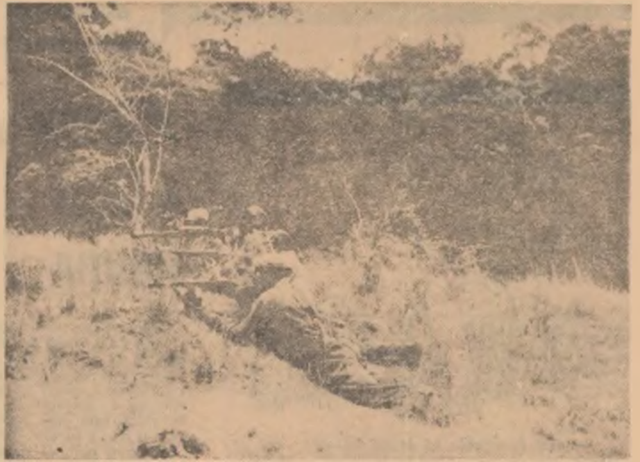
Luptători dintr-un detașament de patrioți angolezi, în timpul instrucției

economie bazată aproape exclusiv pe exportul arahidei (principalul produs național); este lipsită de industrie, nu are căi ferate, beneficiază doar de un număr insuficient de școli și spitale. Resursele economice ale Gambiei îi oferă posibilități de dezvoltare și perspective destul de limitate. În afara arahidei, se prevede o lărgire a exportului de migdale, copra, pește sărat, ceară de albine. Principalele produse de import sînt cele alimentare, precum și tutun, textile, mașini și unele produse petroliere.