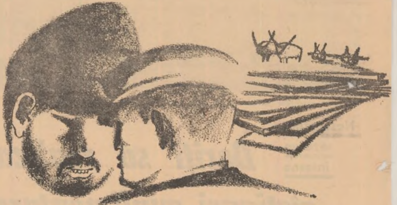
Desen de NICĂ PETR

— Mă gîndisem să-mi fac un tron din ea în care mă îngroape cînd n-o-i mai fi. Aș fi dat alte zece-n loc da din brad că se găseșc și nu sînt așa bune pent-