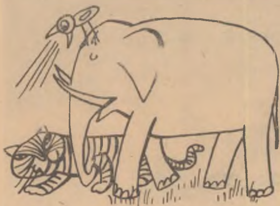
— Hei, la o parte, că de nu, te calc! (Desen din revista „LUDAS MATYI” — R.P.U.)