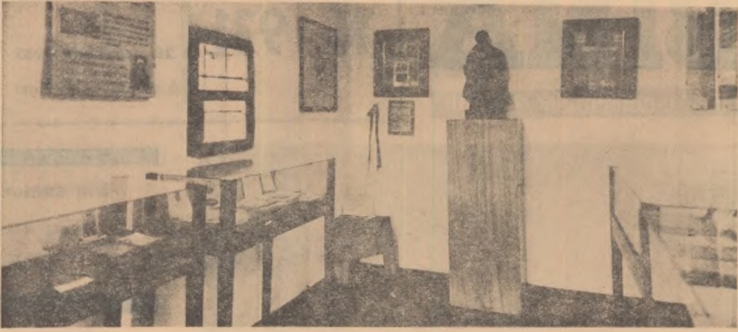
Interior din Casa memorială „Ion Creangă” din Humulești