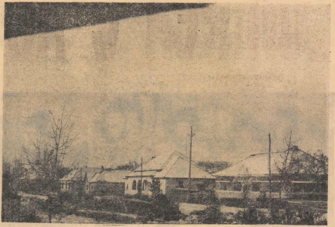
Case noi în comuna Ibănești, regiunea Maramureș