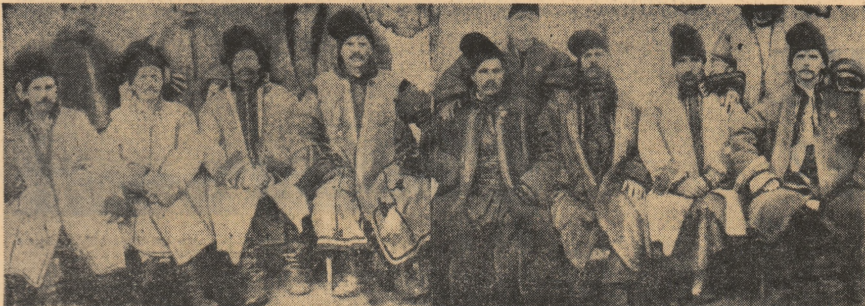
O parte a grupului de deputați pontazi din Adunarea ad-hoc a Moldovei — 1857.