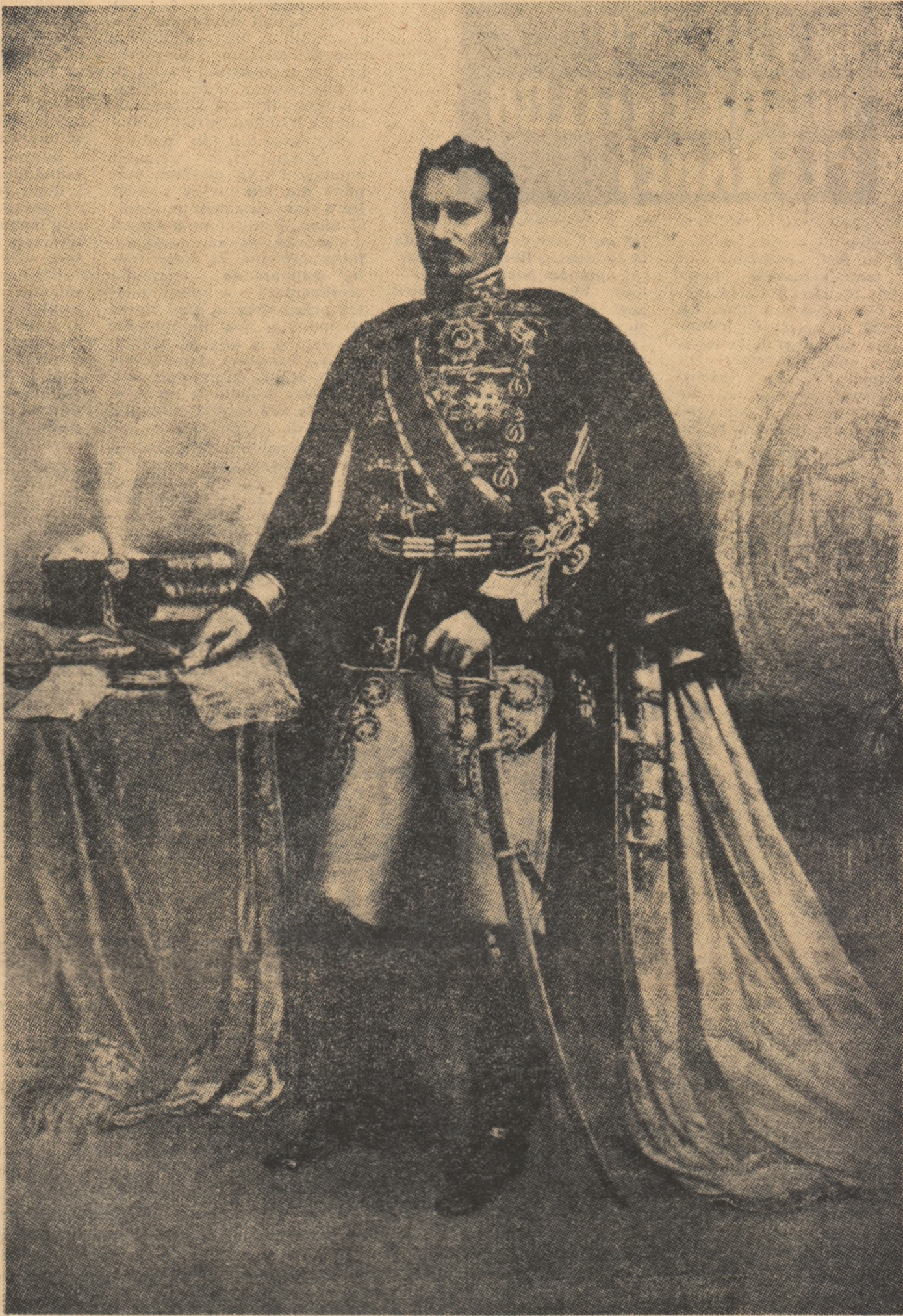
C. Popp de Szathmari ALEXANDRU IOAN I (Lifografie)