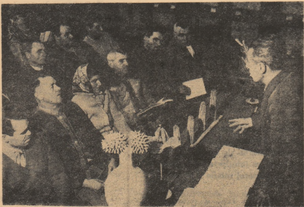
Cooperativa agricolă de producție din comuna Independența, regiunea Galați. Aspect de la cursul pentru cultura plantelor.

președinte al cooperativei agricole de producție Pietroasele, raionul Mizil