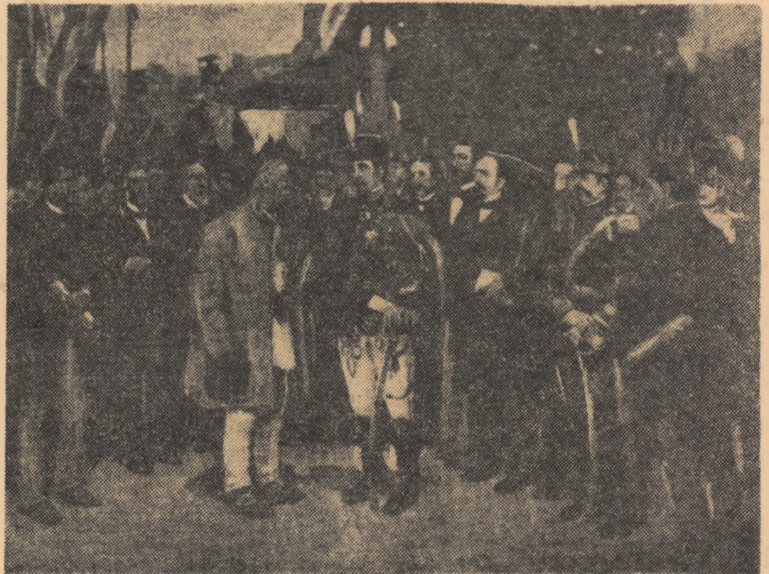
D. STOICA: Moș Ion Roată și Cuza (Muzeul Militar — București)