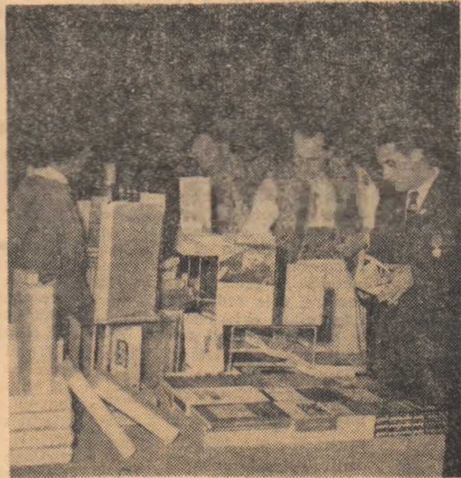
In pauză, la standul de cărți

Acum, tovarăși, sinteți oameni liberi, stăpîni pe