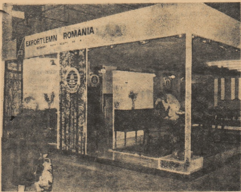
Stand românesc cuprinzînd garnituri de mobilă la expoziția anuală de la Londra a artelor menajere