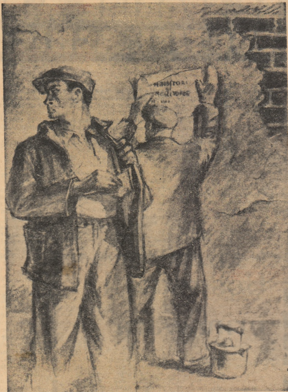
Muncitori difuzând afișe în ilegalitate

Cu toată teroarea desfășurată de agenții siguranței și opreliștile de toț felul, Partidul Comunist Român a mobilizat masele de oameni ai muncii de la orașe și sate împotriva cotropitorilor și a informat poporul asupra acțiunilor întreprinse la orașe și sate