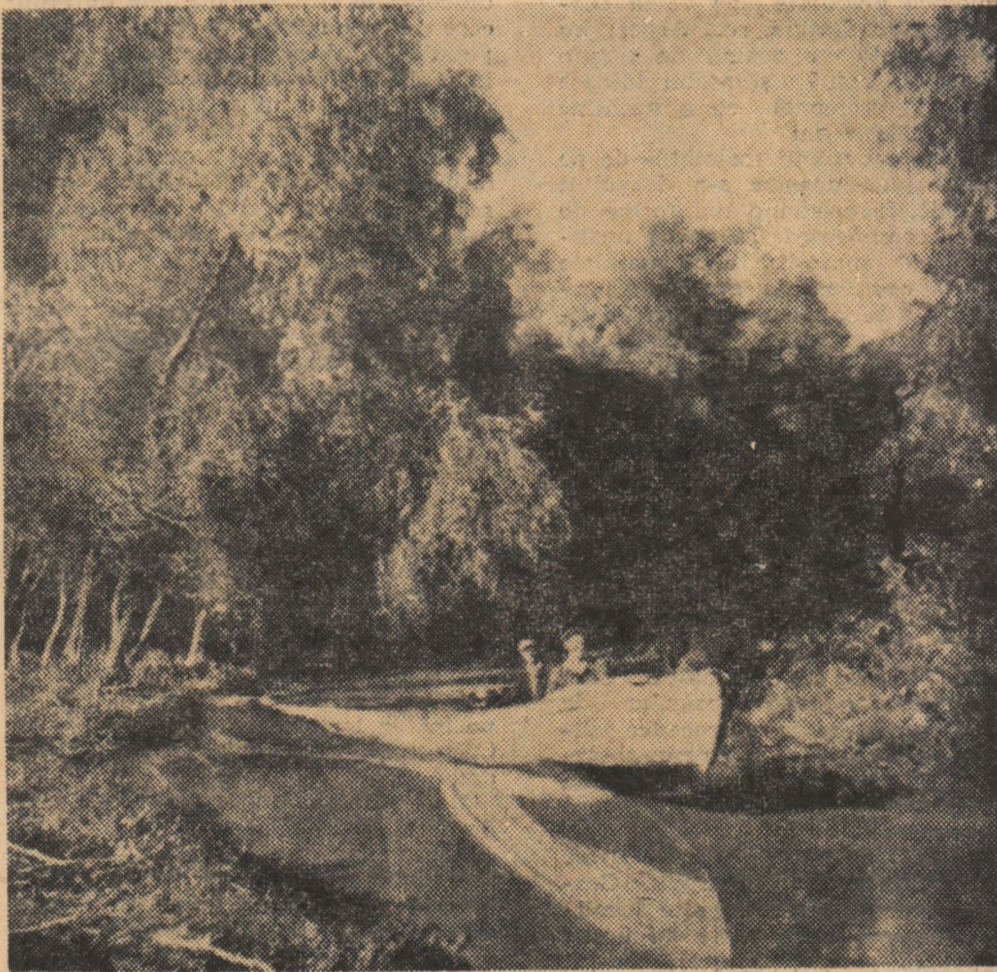
Cu șalupa pe canalele Deltei