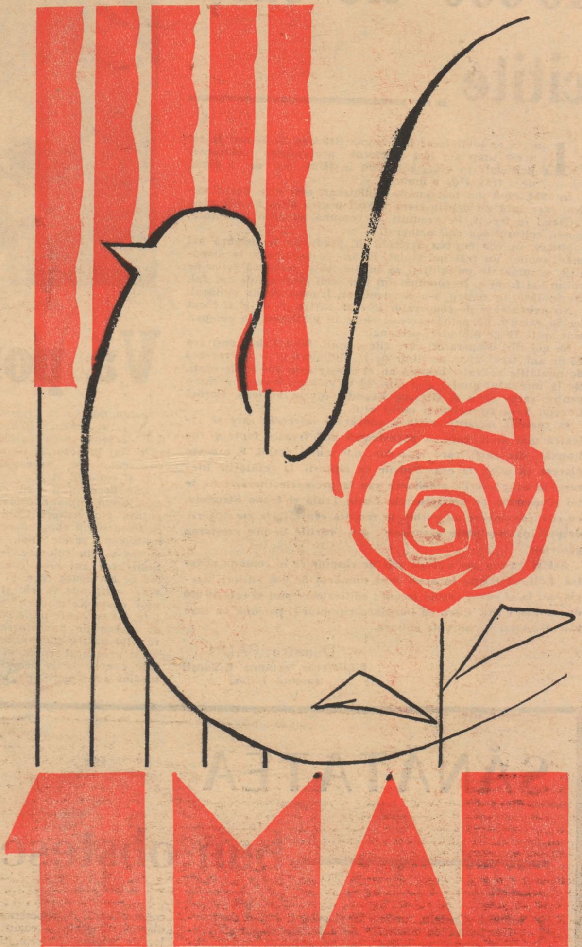
Desen de T. IOANEȘ