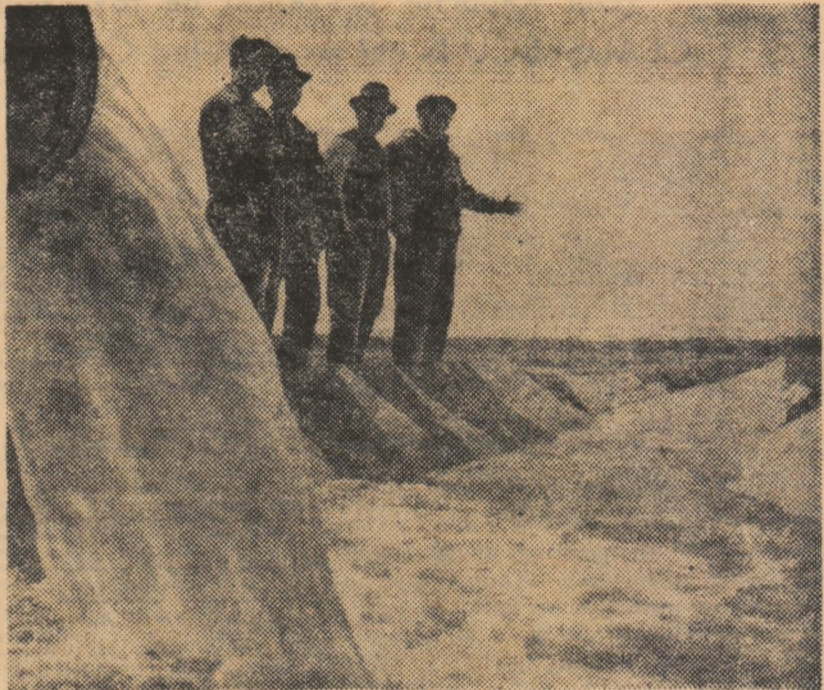
La cooperativa agricolă din Putineiu, raionul Giurgiu, în aceste zile se fac probele de funcționare la instalațiile pentru irigat

Ne aflăm acum într-o perioadă în care acțiunile pentru amenajări și folosirea irigațiilor sînt în plină desfășurare. Unele cooperative agricole, cum sînt cele din raioanele Deta, Măcin și Videle au și început, cu sprijinul uniunilor raionale ale cooperativele agricole și al consiliilor agricole, să organizeze acțiuni comune de amenajări pentru irigații. Este necesar ca fiecare din noile amenajări să fie cât mai bine gîndită, iar soluțiile adoptate pentru amena-