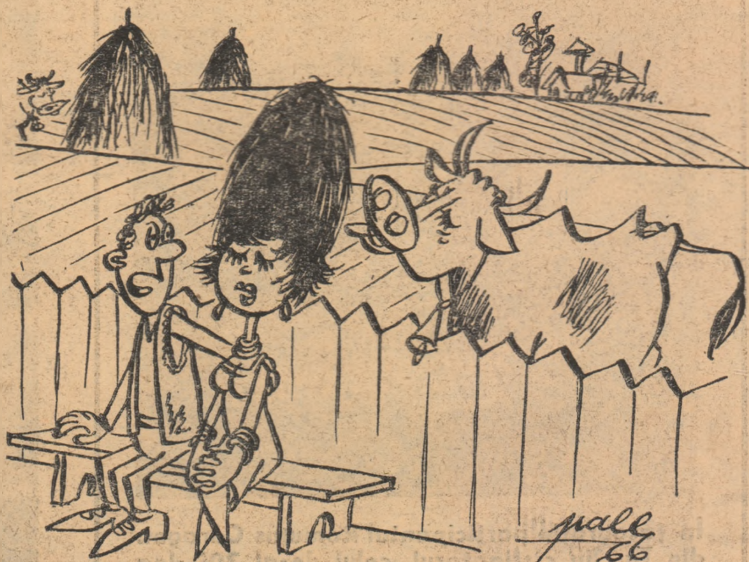
— Neaaa, Joiana !!! Nu vezi că-i Fana ?