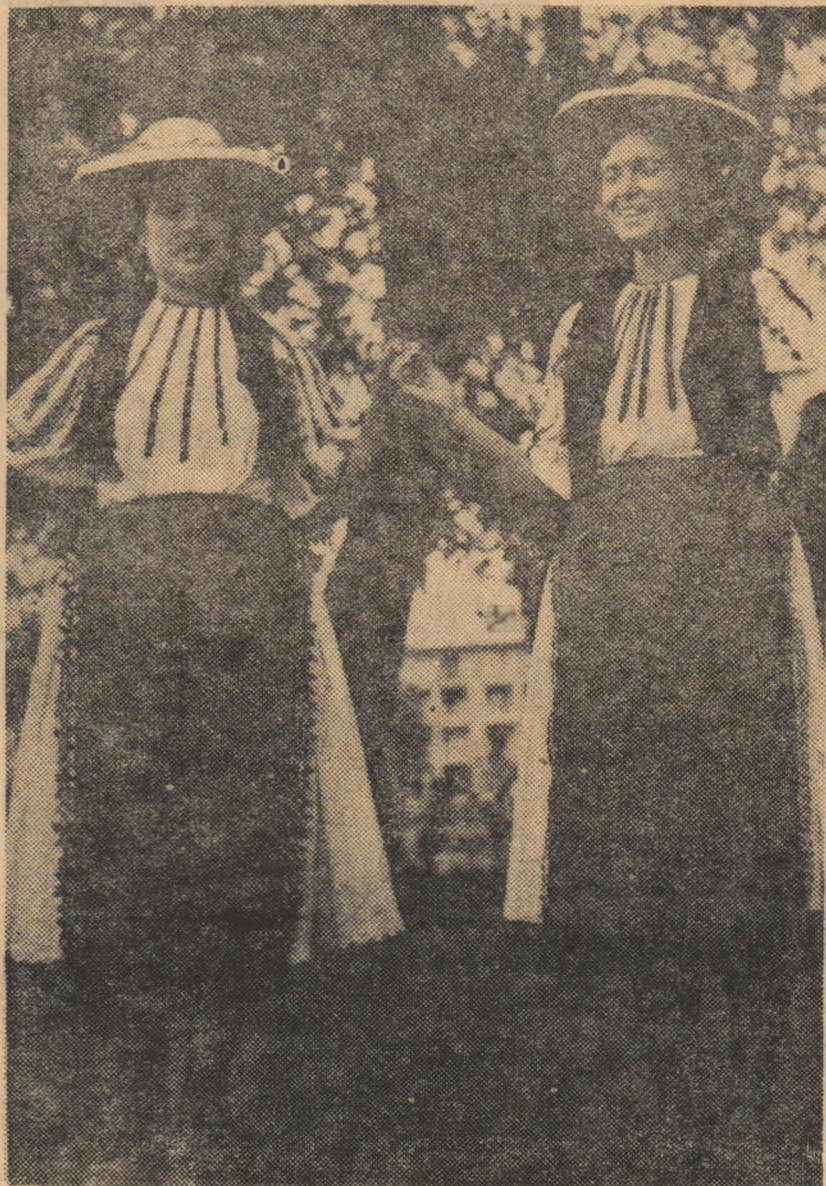
Dans din Căpîlna