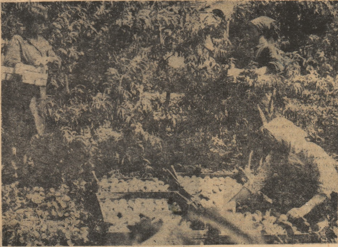
Recoltatul pierșicilor la Institutul de Cercetări Hortivite Băneasa-București