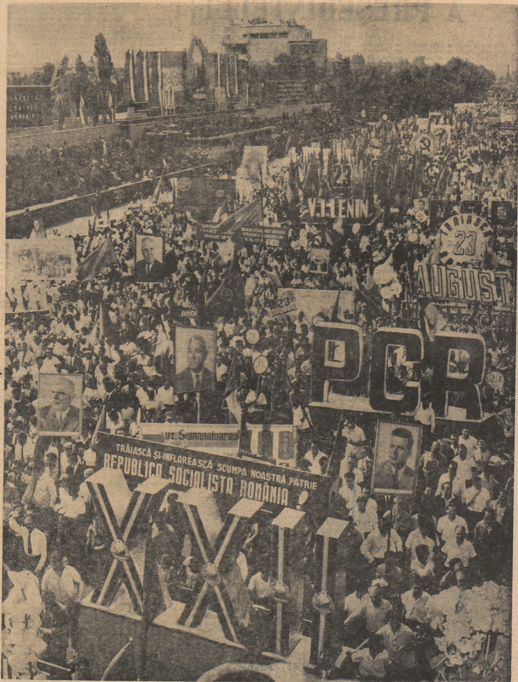
Demonstrează loialtă, muncitori, țărani, intelectuali. Din piepturile tuturor răsună dragoste și recunoștință față de partid

Revistă săptăminală a Asezămintelor culturale