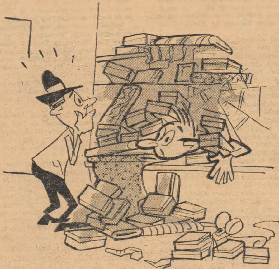
— Nu vă supărați, la dumnevoastră a fost cutremur ? Desen de F. GRONSKI

La magazinul de textile-încălțăminte din satul Valea Stinei-Oltenița, expunerea mărfurilor este necorespunzătoare.