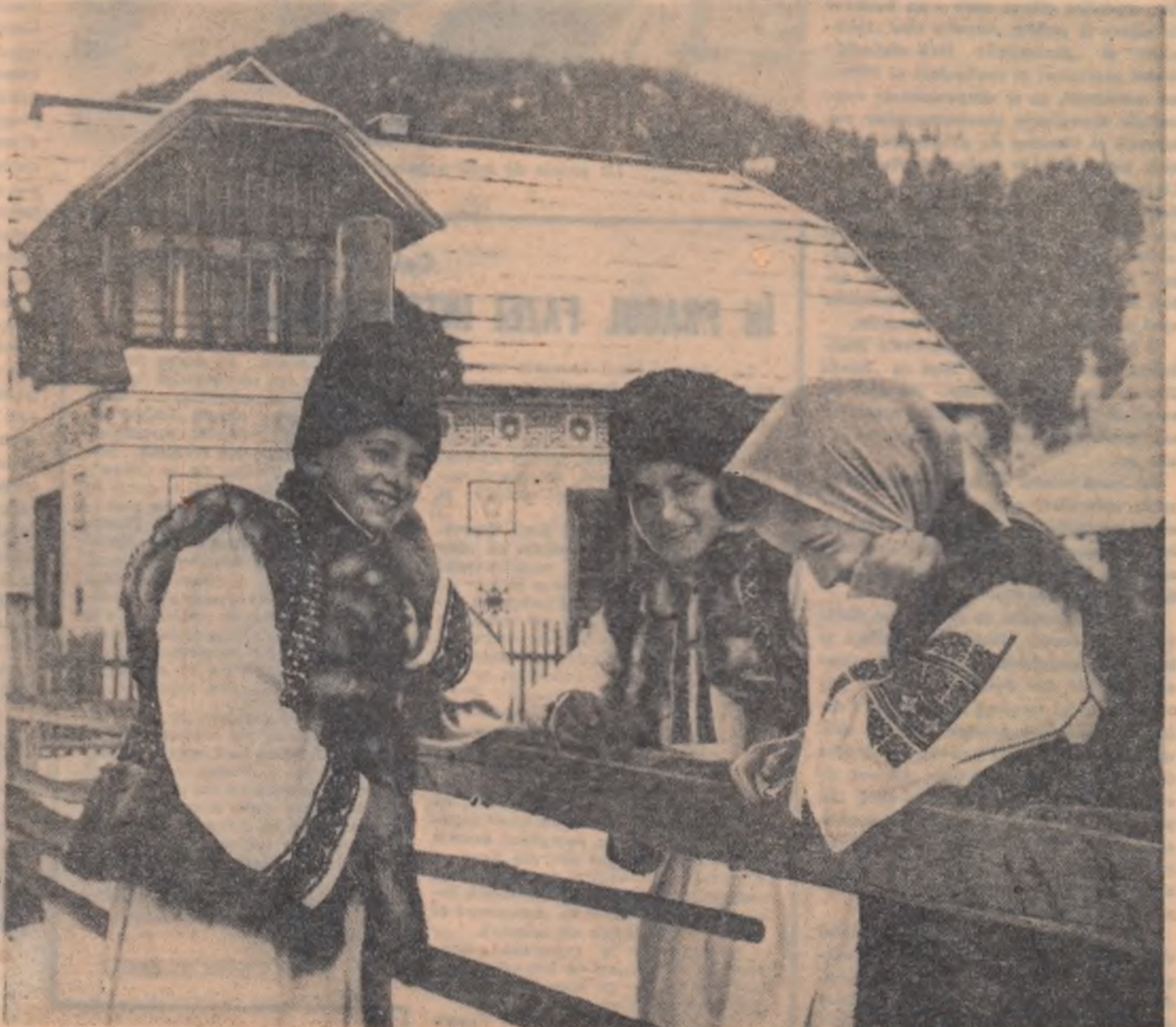
Tineri din comuna Ciorăști, regiunea Suceava.