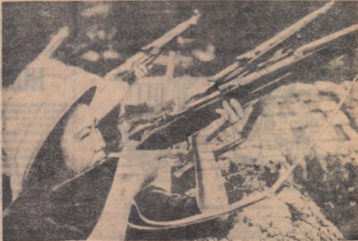
Femeile din Hanoi se irolează în unitățile de apărare antiaeriană.

După terminarea războiului, activitatea sa artistică devine tot mai bogată, publicînd alternativ nuvele („Pămîntul unde norii albi se adună”) și mai ales romane remarcabile, printre care „Primăvara se întoarce la Seukaoul” și „Curentul fluviului”. Aceste două romane sînt rodul unei activități dintr-o perioadă destul de îndelungată petrecută alături și în mijlocul țărănilor, membri ai unei cooperative agricole. Eroii acestor romane reprezintă o sinteză a celor mai bune trăsături ale țărănimii coreene contemporane. Pe bună dreptate Tcheun Sê Bong este numit „scriitorul satului”.