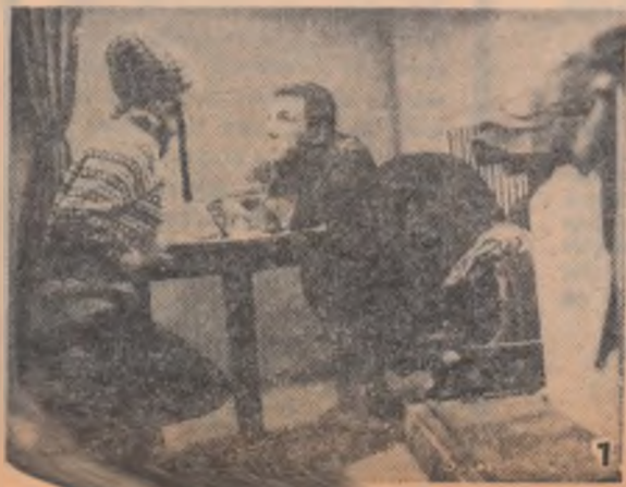
Cadrele din filmele: 1. Matorul și moartea. 2. Șeful sectorului suflăte.