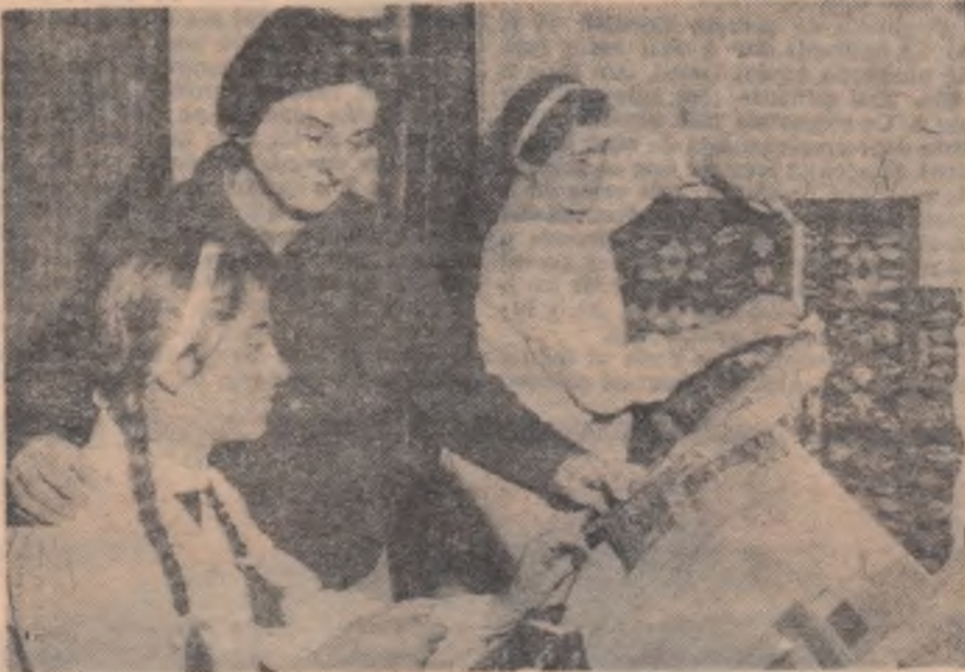
La școala de artă populară din Craiova.