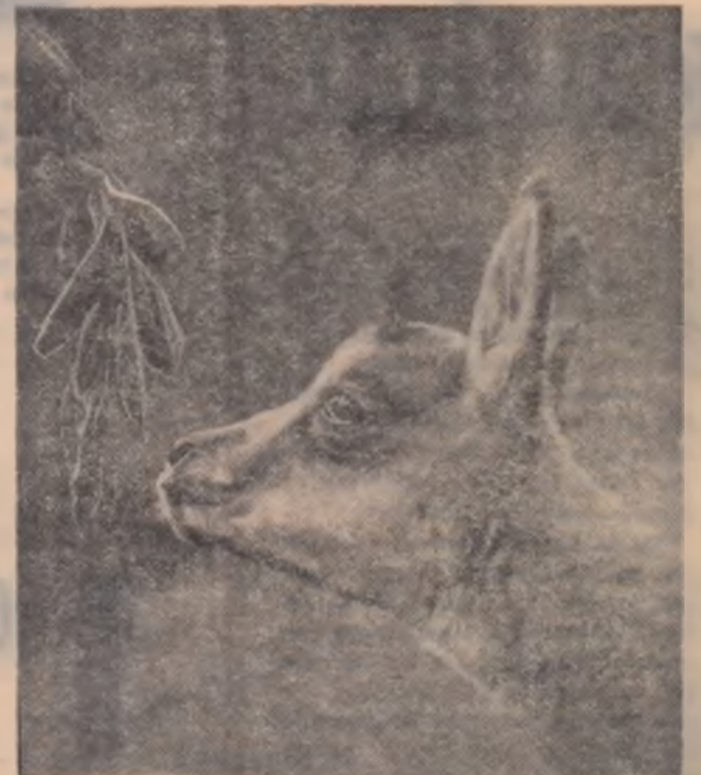
■ Pui de capră neagră

De cinci ani, Vuciko extermină fără cruțare șerpii din împrejurimile satului. El a distrus pînă acum peste 2 000 de șerpi.