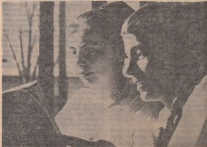
Lectură la biblioteca căminului cultural din satul Borlova, raionul Caransebeș.

Din cele arătate mai sus se pot trage unele concluzii și anume: de munca de culturalizare a maselor se face răspunzător nu numai căminul cultural ci și organele locale ale puterii de stat. Pentru acestea este necesar să se respecte obligațiile pe care acestea le au față de activitatea culturală, să se combată