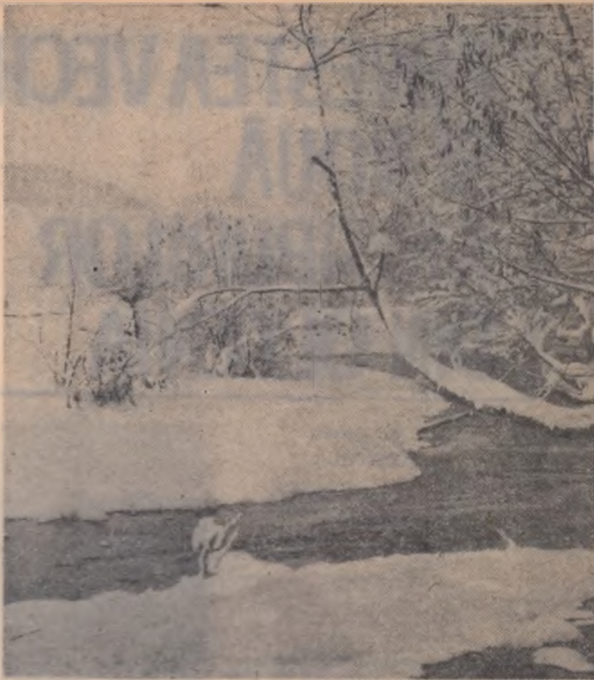
Peisaj de iarnă