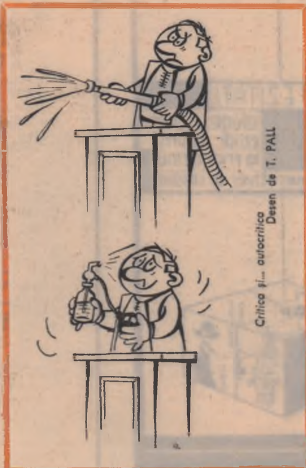
Desen de T. PALL Critica și... autocritica