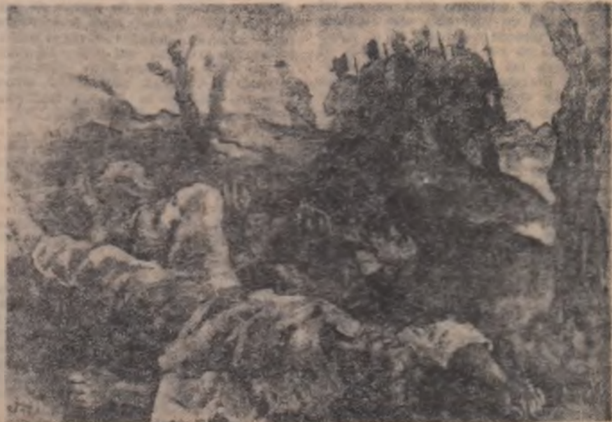
PROFETA EREMIA : Au cerut pământ