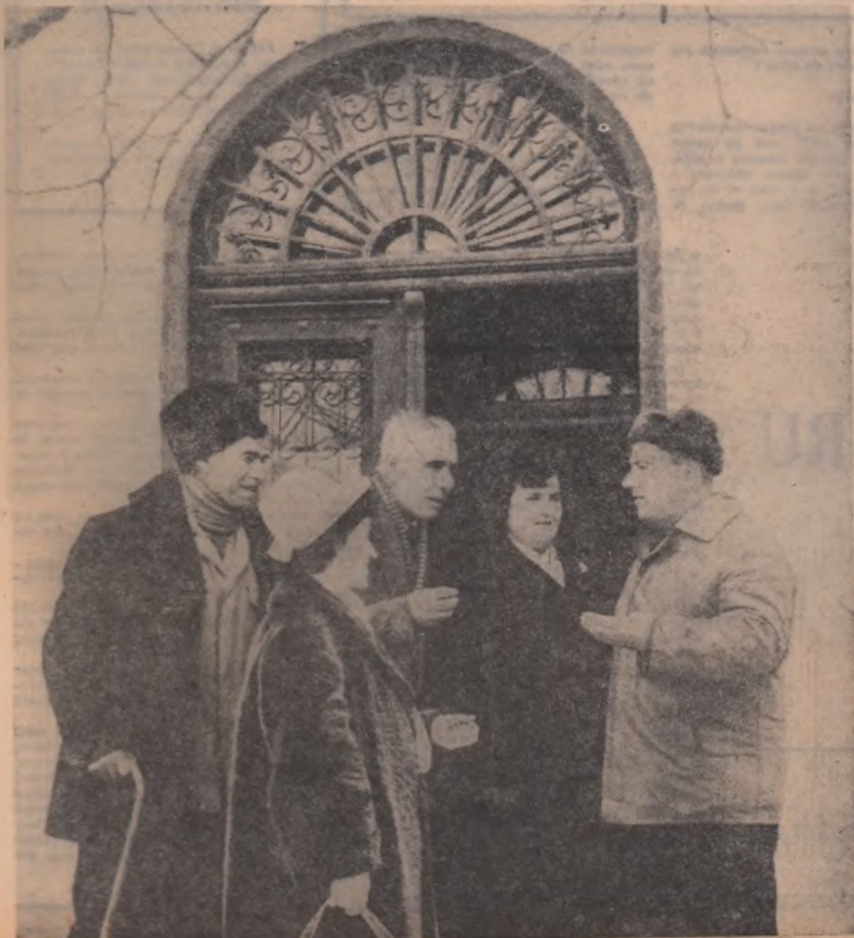
Întîlnire cu alegătorii

Socot că este cu totul firesc ca în dimineața zilei de 5 martie, milioane de țărani, bărbați, femei și tineri să-și arate adeviziunea lor pentru cei mai buni dintre gospodari, pentru cei mai harnici cetățeni. Votul tuturor, unanim, este votul pentru fericirea de a trăi liber, pentru mîndria de a munci cu osîrdie, pentru speranța de a vedea sporite belșugul, frumusețea și civilizația satului românesc contemporan.