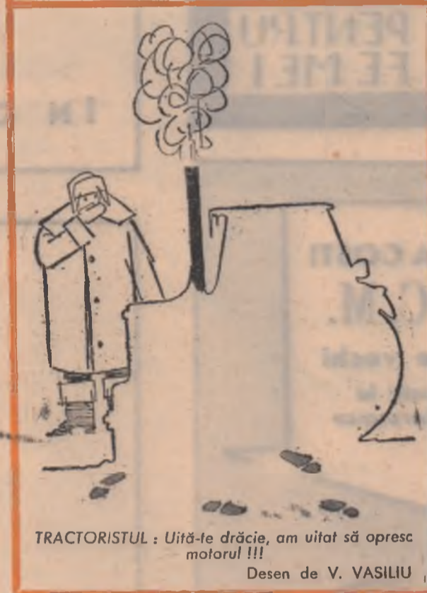
Desen de V. VASILIU