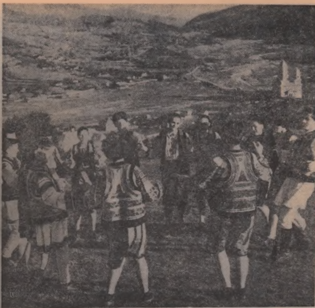
Horă în comuna Pipirig, regiunea Bacău