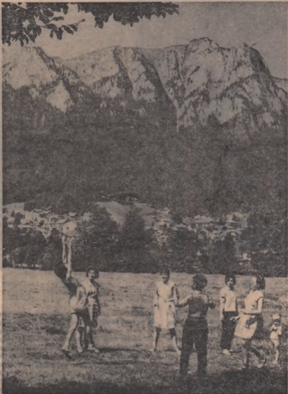
Pe valea Prahovei