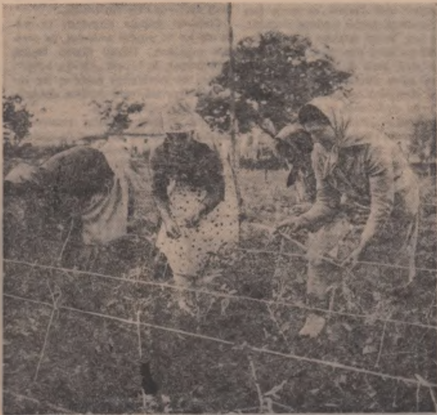
Roșii timpurii pe spațier la cooperativa agricolă din Bucov, regiunea Ploiești. Aspect din timpul lucrărilor de întreținere.