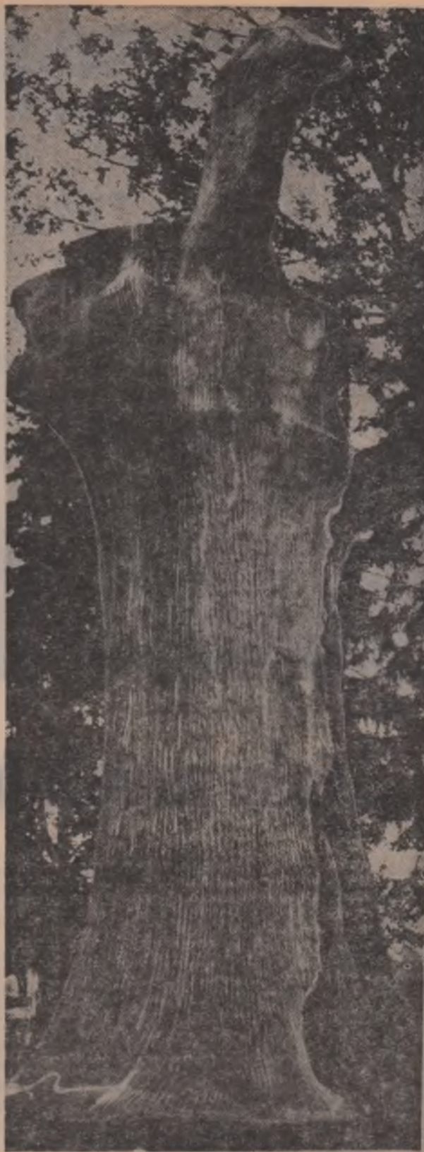
Gorunul lui Horea, de la Tebea, bătrîn de peste 800 de ani

● Într-un marți seara la New York, Consiliul de Securitate a adoptat în unanimitate o rezoluție care cheamă toate guvernele implicate în conflictul din Orientul Mijlociu, să ia de îndată toate măsurile pentru o încetare imediată a focului și pentru oprirea tuturor activităților militare. Rezoluția însărcinează pe secretarul general al O.N.U., U Thant, să țină la curent Consiliul de Securitate în legătură cu situația din regiunea Orientului Apropiat. Proiectul de rezoluție a fost elaborat după cum a anunțat președintele Consiliului de Securitate, Hans Tabor (Danemarca), în urma consultărilor ce au avut loc între diferitele delegații.