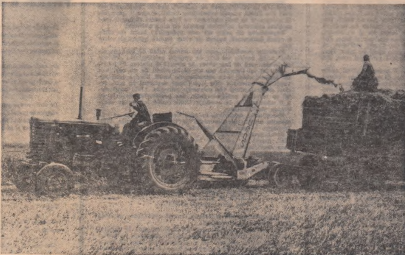
Recoltarea lucernei. — C.A.P. Bărcănești — oraș Ploiești.