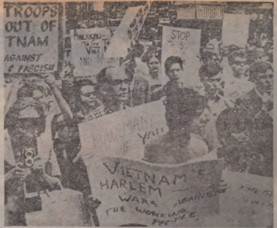
Demonstrație de protest la New York împotriva războiului din Vietnam