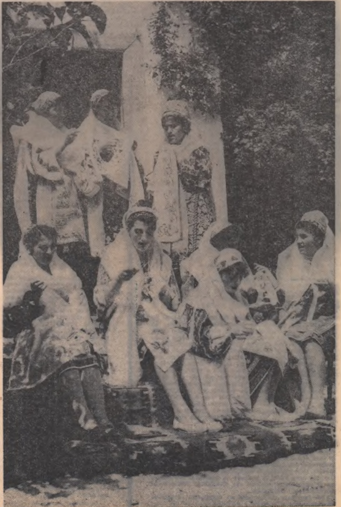
La țesătoare — fete din comuna Poenari, raionul Muscel.