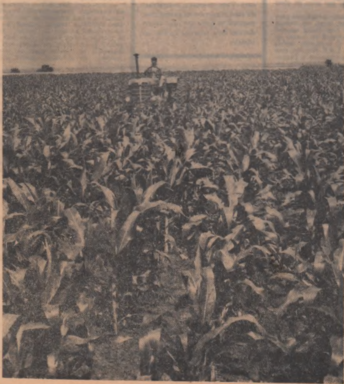
C.A.P. Fundulea. A treia prașilă la porumb

Faptul ar stîrni, desigur, emulația și ambițiile