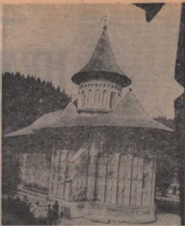
Mănăstirea Veronei, regiunea Suceava.

Interesul turistic pentru țara noastră crește pretutindeni în lume. Delta Dunării, litoralul, peisajul carpatin, mănăstirile din Bucovina atrag efective sporite de turiști străini. În hotelurile și campingurile, presărate din Oaș până la Mamașia, răsună multe limbi ale pământului. Numai în regiunea Suceava și-au anunțat sosirea, pentru anul în curs, 65.000 de turiști, de zece ori mai mulți decât în 1960.