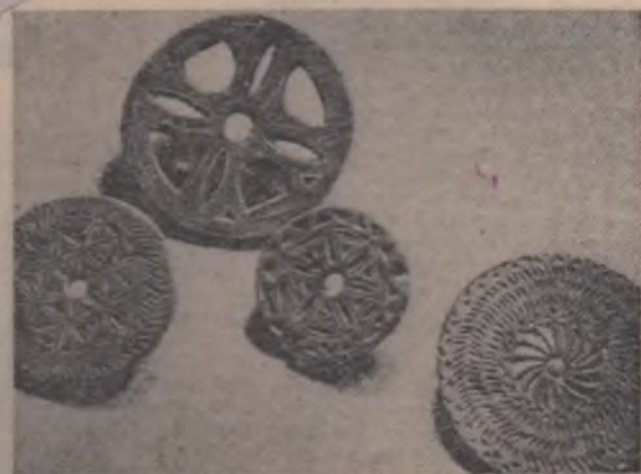
Accesorii pentru fus din regiunea Hunedoara.

Exemple de consilii de conducere, care aduc o contribuție reală, care reprezintă o verigă de legătură între cămin și masă, care coordonează la modul direct, practic, întreaga activitate culturală a comunei, am mai întilnit și în alte părți. În Socodor-Criș, Pericea-Simleu și în multe alte locuri. O situație paradoxală în Sîntea Mare-Criș, unde consiliul de conducere duce munca în pofida lipsei de preocupare a directorului de cămin.