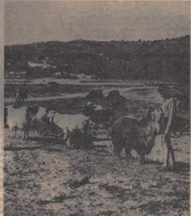
Copil cu caprele pe valea Zăbalei.