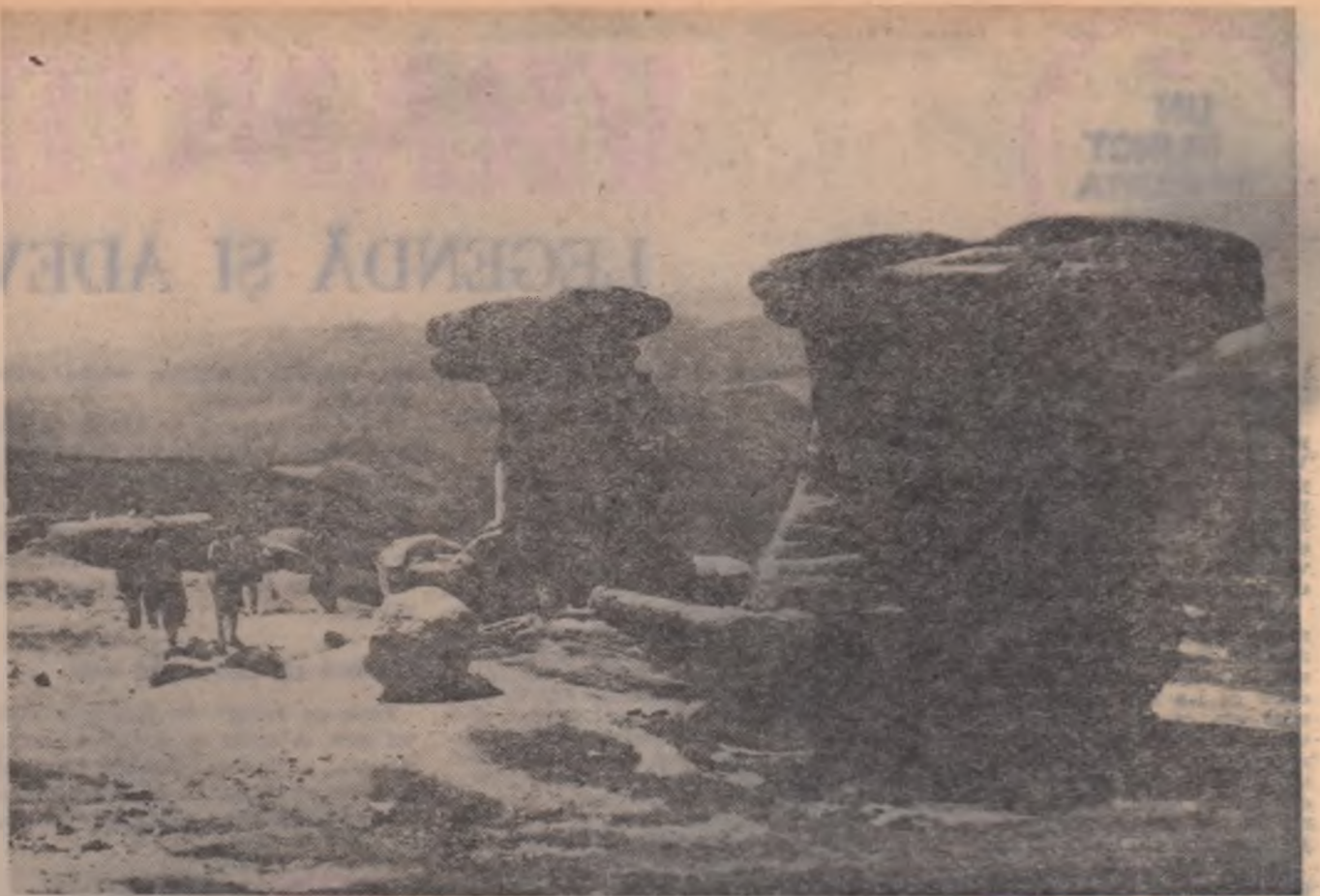
Babele din munții Bucegi