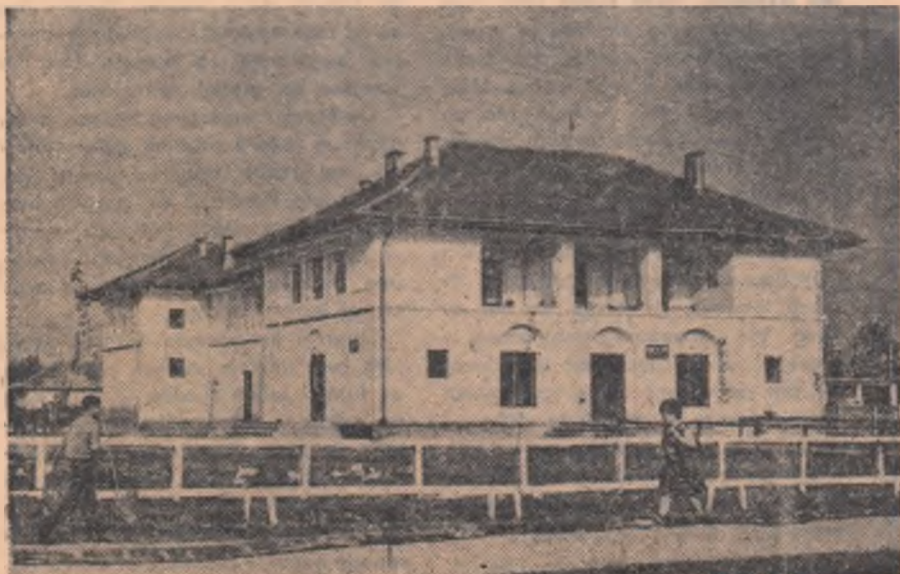
Căminul cultural din Vidra.