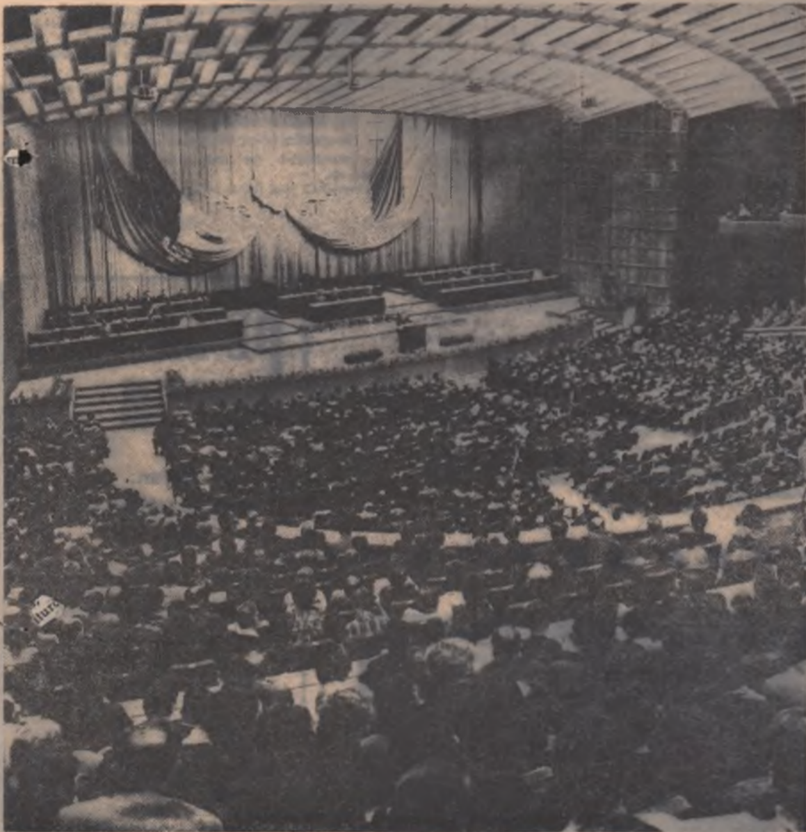
Aspect din timpul lucrărilor sesiunii Marii Adunări Naționale

Marea sală a Palatului Republicii Socialiste România a găzduit, începînd din dimineața zilei de 24 iulie, lucrările celei de a VII-a sesiuni a celei de a V-a legislaturi a Marii Adunări Naționale. În centrul dezbaterilor actualei sesiuni s-a aflat activitatea internațională a României, problemele principale ale politicii externe a țării noastre.