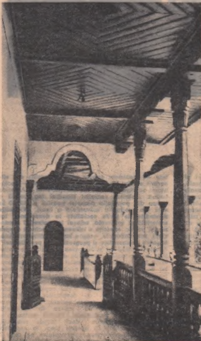
Clădirea Muzeului raional Cimpulung-Muscel datează din a doua jumătate a secolului al XVIII-lea. În fotografie: coridorul muzeului.

Cîndva, niște oameni e o carte interesantă care, oglîndind realitatea în complexitatea ei, aduce o mărturie despre măreția comunistilor.