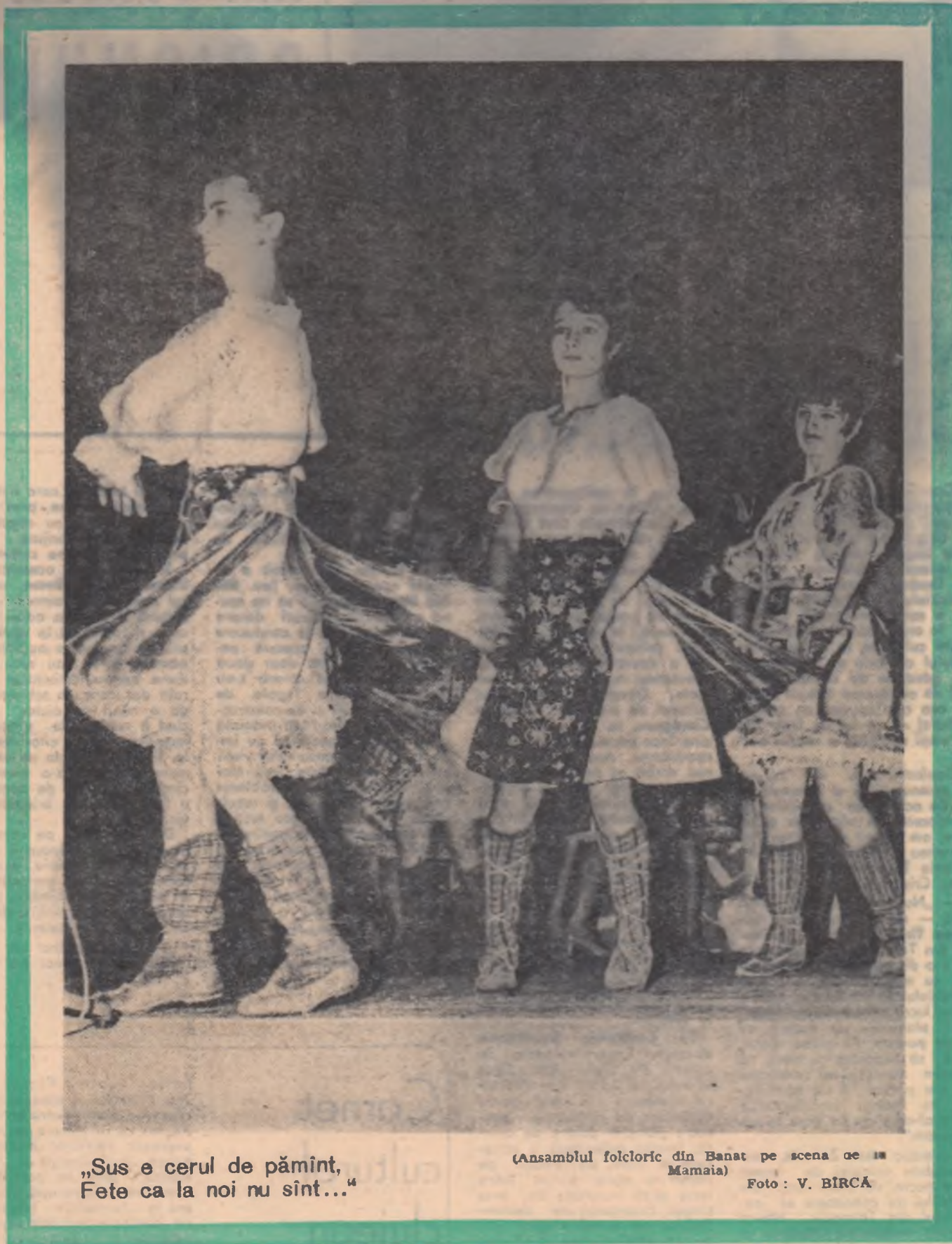
„Sus e cerul de pămînt, Fete ca la noi nu sînt...”