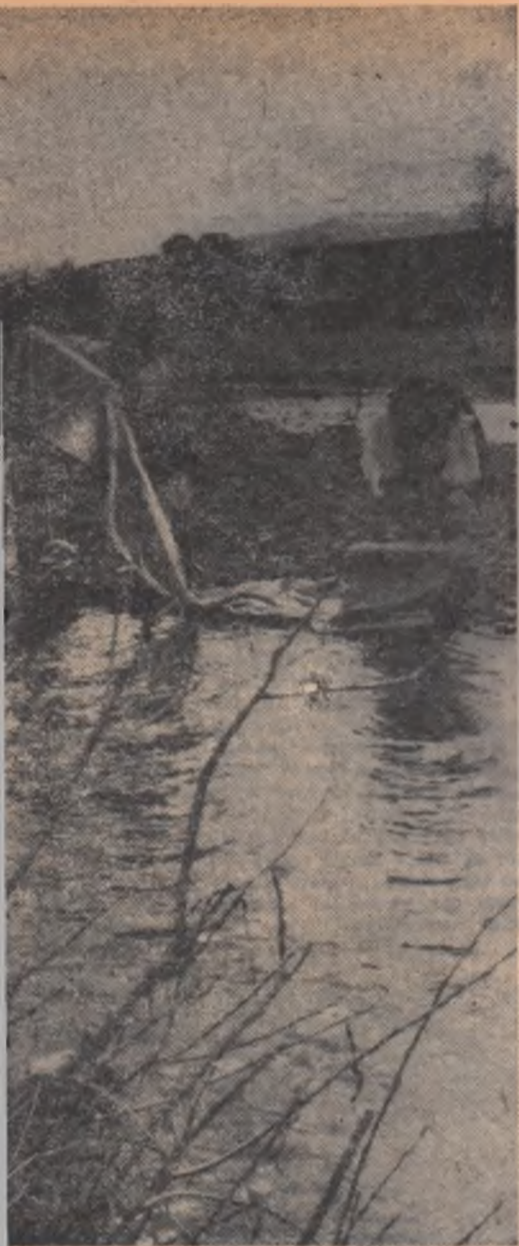
lucea rufele la riu..."