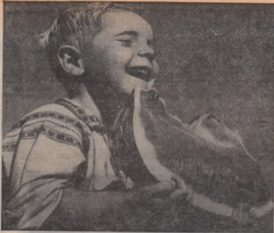
Cine-i mai dulce... ?

Consiliul de conducere al căminului cultural