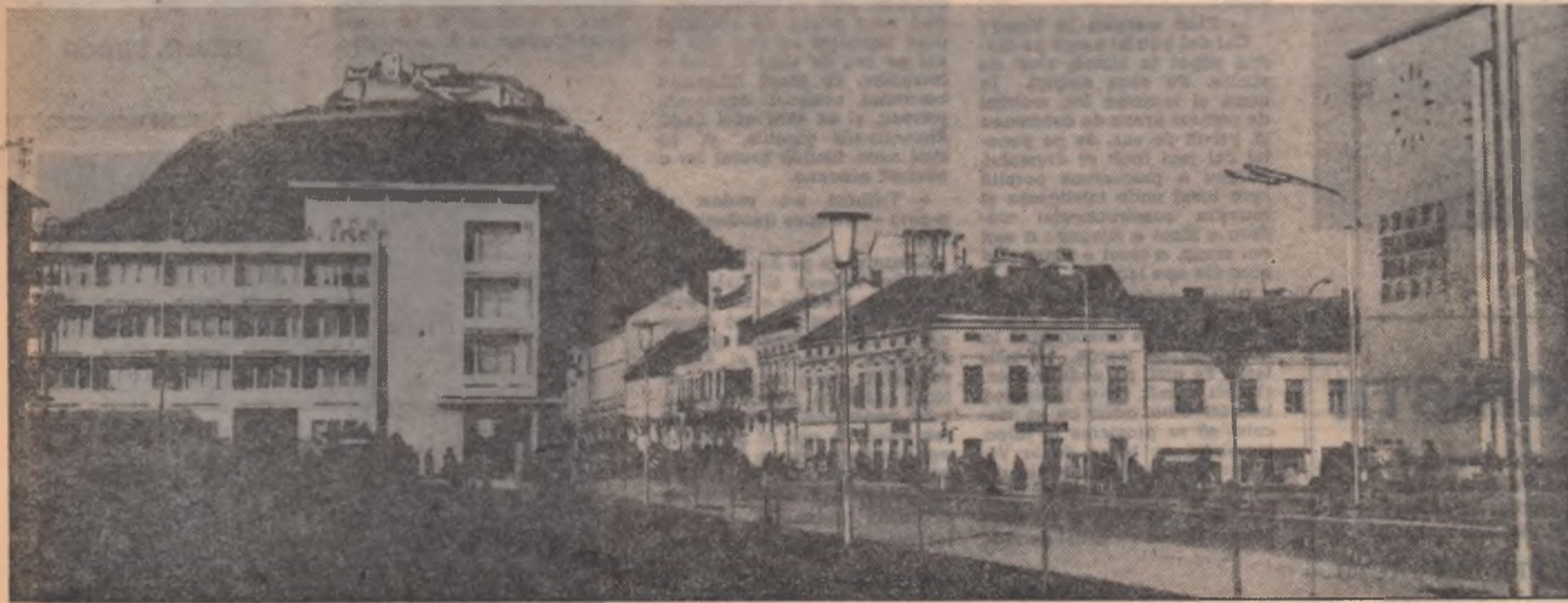
Vechiul și noul