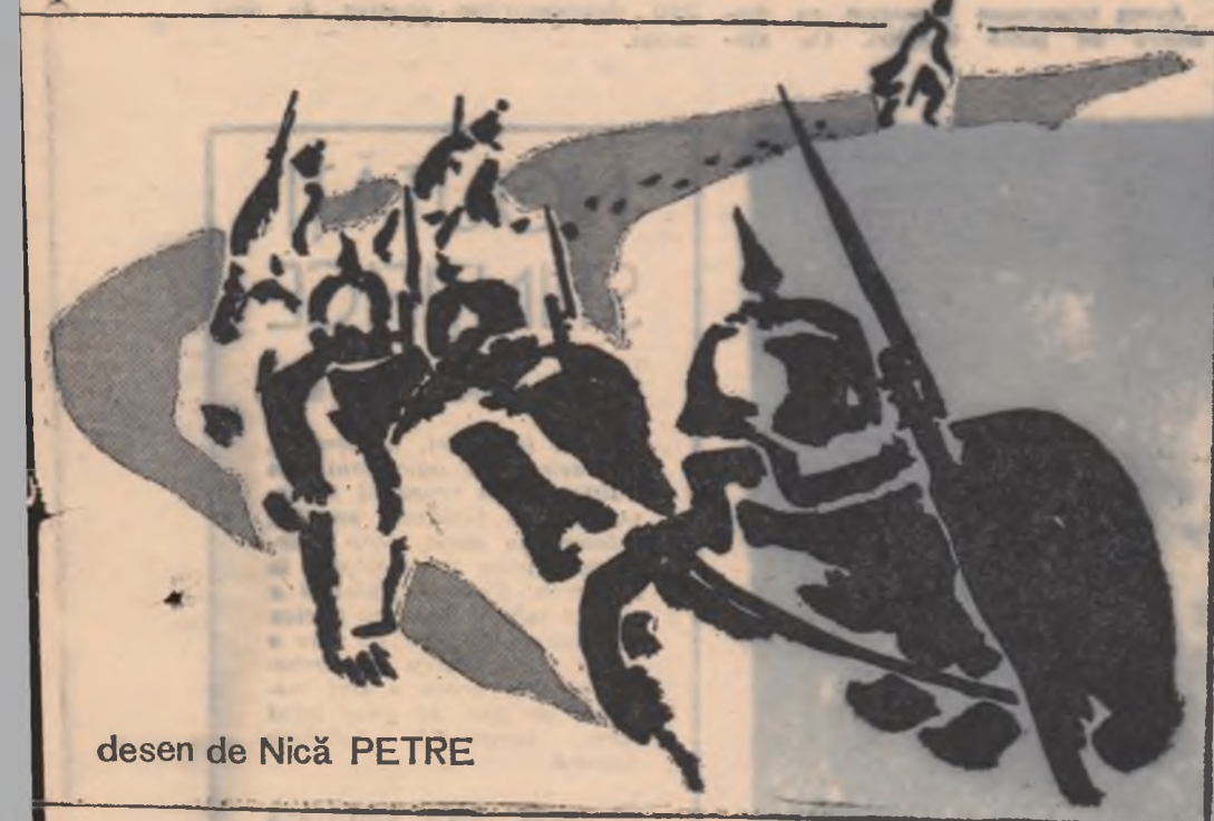
desen de Nică PETRE

— Au trecut zilele și săptămînile. S-au scurs și lunile și a venit primăvara. Zăpezile au prins să se prefacă-n șuvoaie. Apele au năvălit în văioage. Pe costise au înflorit ghiocelii și albastrelele. Și-au arătat moțul și diditeii. A dat colțul verde al ierbii și copacii au înmugurit. Ramurile țepoase ale gherghinilor erau ninse de floare. Numai în cheile Viltorii,