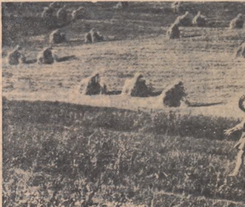
Au pornit voioși la drum!

Băiatul întorcea din cînd în cînd capul. Se gîndi să-i ducă pe alte cărări, pînă la ziuă. Așa îi va scăpa pe români și se va răzbuna pe nemți. Trecură printr-un defileu îngust, ajunseră la o răspîntie, unde se găsea o troiță. Băiatul se opri. De acolo porneau două drumuri. Unul ducea de-a dreptul la Stîna. Celălalt oco-