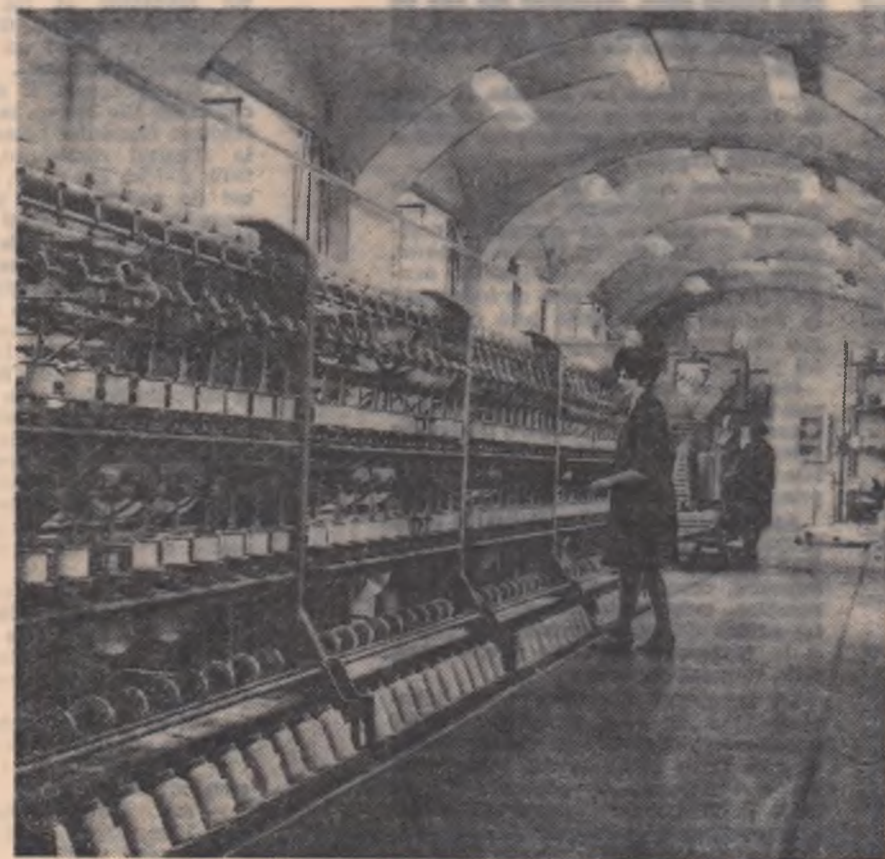
Aspect de la Fabrica de textile SOMEȘUL din Cluj

Trebuie să arătăm totuși că în privința calității mai există destule rezerve. Se mai întimplă bunăoară ca lînă să fie predată cu scame și alte impurități vegetale datorate întreținerii și adăpostirii necorespunzătoare a oilor. De asemenea, în multe locuri se mai face însemnarea oilor cu smoală, păcură și alte substanțe care nu ies la spălat. Aceste neglijențe au, după cum e și firesc, efecte negative atît asupra calității sto-