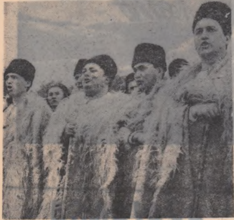
Cor din Rupea