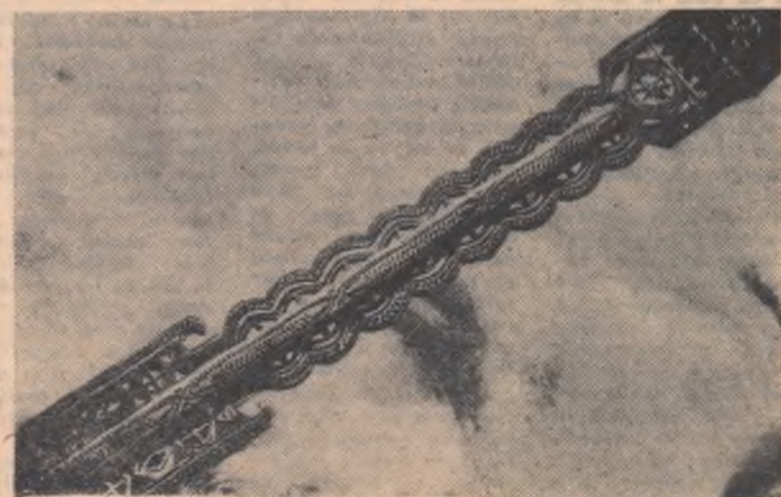
Furcă de tors