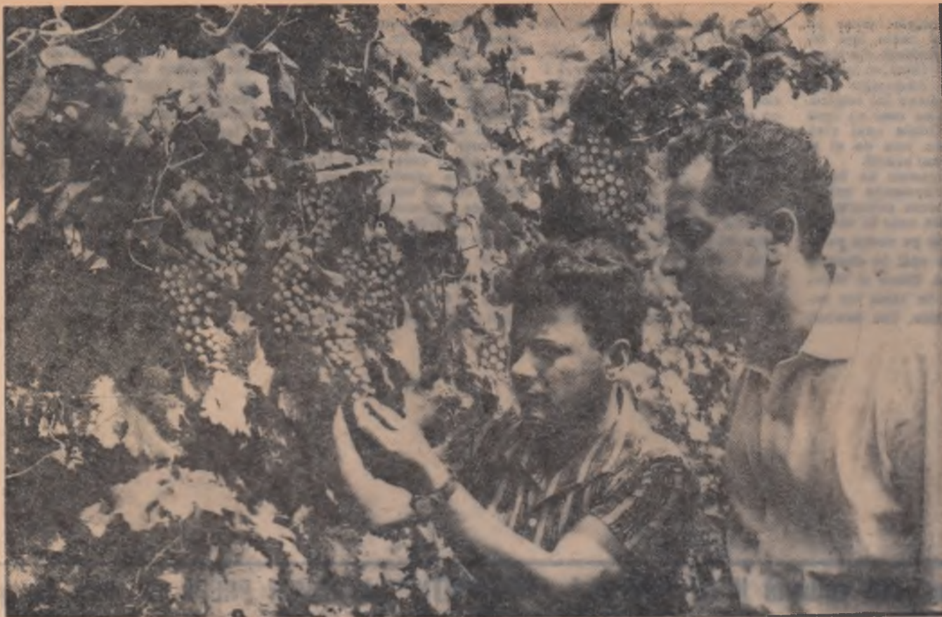
La G.A.S. Panciu se prevede o recoltă bogată de struguri