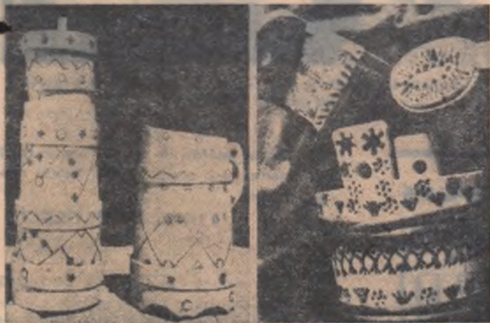
Obiecte de uz casnic din lemn.