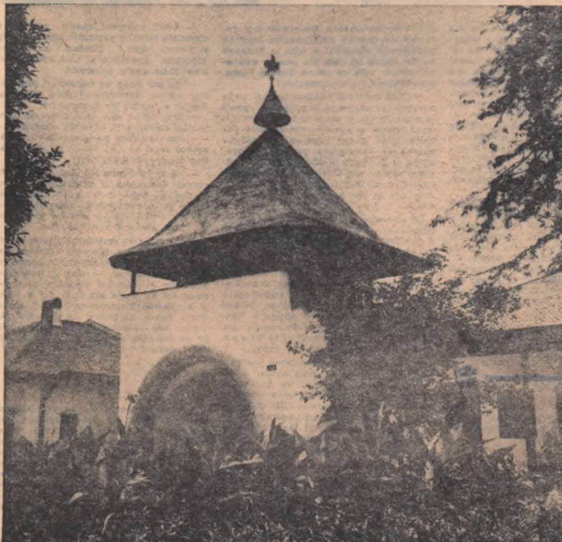
Foșorul de la Muzeul Golești